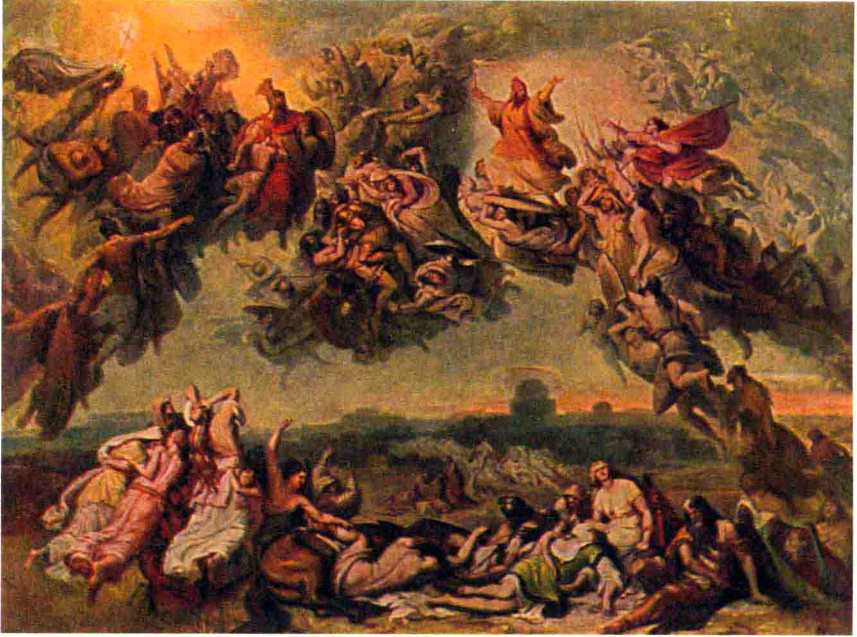
汉斯之战 科尔巴赫 油画