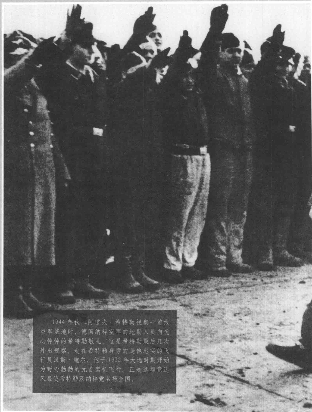
1944年秋，阿道夫·希特勒视察一前线空军基地时，德国纳粹空军的地勤人员向忧心忡忡的希特勒敬礼。这是希特勒最后几次外出视察。走在希特勒身旁的是他忠实的飞行员汉斯·鲍尔，他于1932年大选时期开始为野心勃勃的元首驾机飞行。正是这场竞选风暴使希特勒及纳粹党名扬全国。