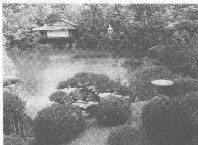
图 1-2 风景式园林