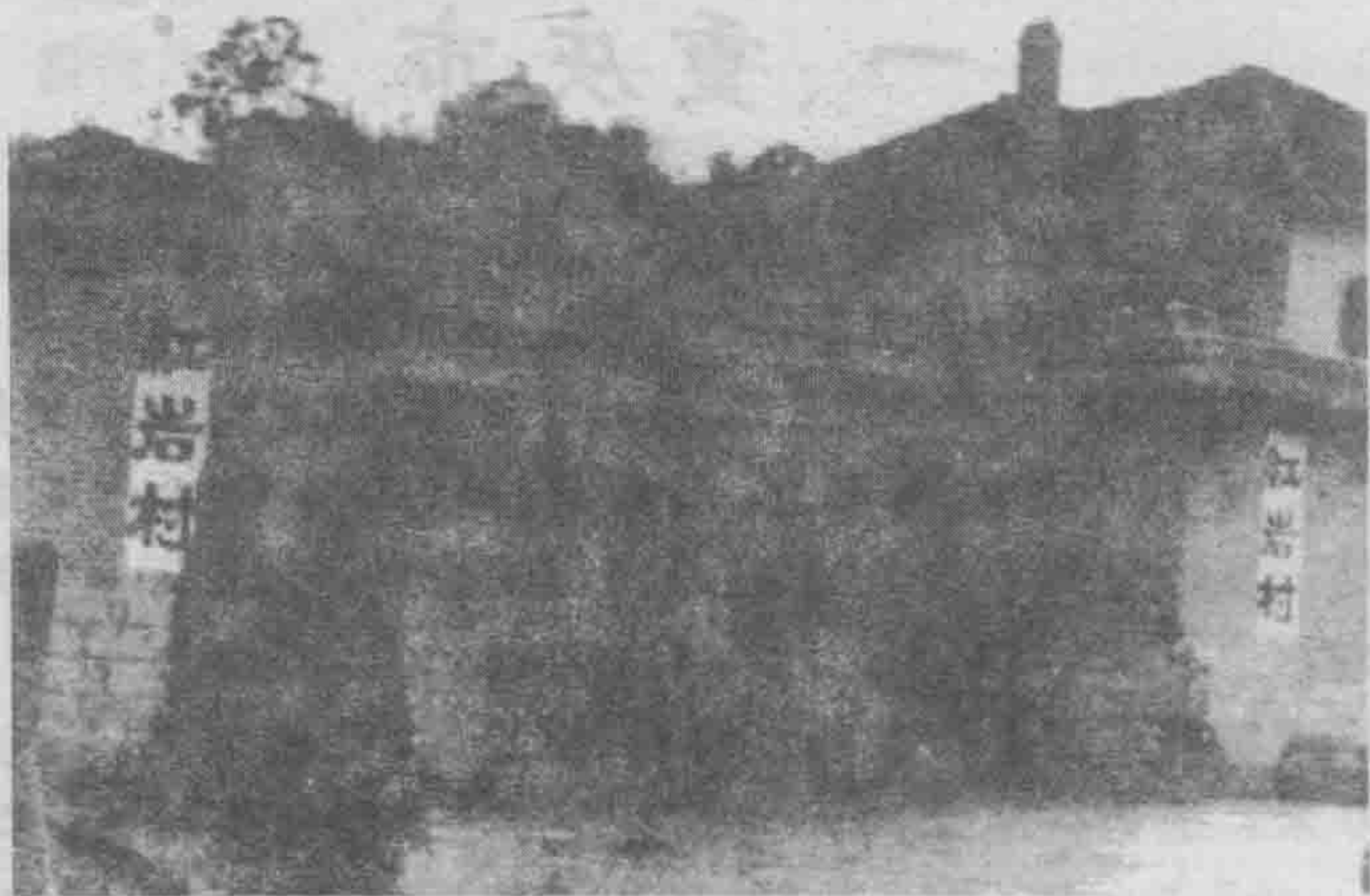
南方局、八路军驻渝办事处旧址：红岩村。

是虎头岩《新华日报》编辑部和印刷厂；三是位于嘉陵江畔的红岩村，即中共中央南方局和八路军驻重庆办事处。