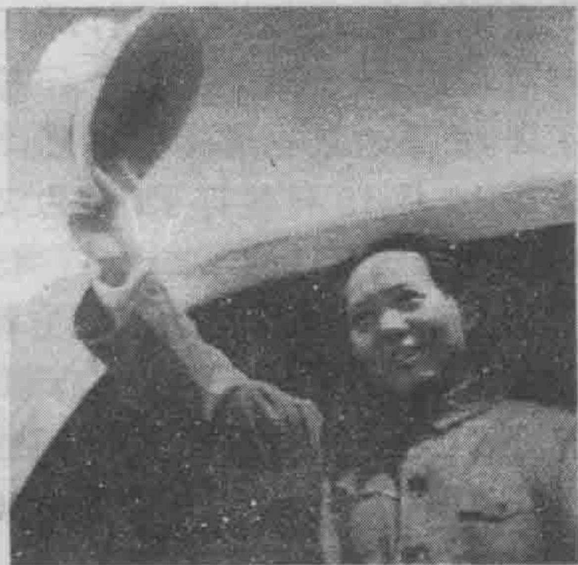
毛泽东赴重庆谈判前，在延安机场向欢送的军民挥帽告别。

战前线去，因此，蒋介石变换策略，作出和平的姿态，表示愿意与共产党谈判，企图用假和平来掩盖真备战的阴谋。8月14日、20日、23日，他三次电邀中国共产党中央委员会主席毛泽东到重庆“共商国家大计”。蒋介石错误地估计毛泽东不会去重庆，他以为这样就可以大造舆论，说共产党不要和平，妄图把打内战的罪责强加给共产党。