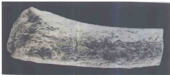
刻有纹路的鹿角 旧石器时代

随后发明的陶器在工艺的制作上与新旧石器区别很大。陶器质地、型制、纹饰的不同，表明了新石器时代前后各个阶段与不同文化区域的鲜明特征，通过艺术形象反映出当时社会从母系氏族向父系氏族过渡的历史进程。