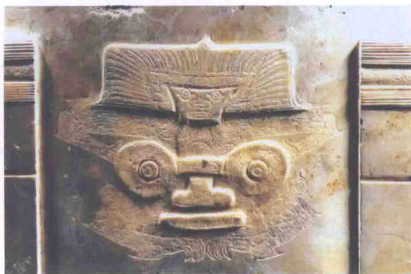
玉雕族徽 良渚文化