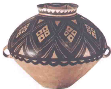
彩陶罐 马家窑文化

在迄今为止的彩陶文化遗址中，发现最早的是仰韶文化，主要分布在黄河沿岸的河南、山西、陕西、青海和甘肃等地。在甘肃、青海