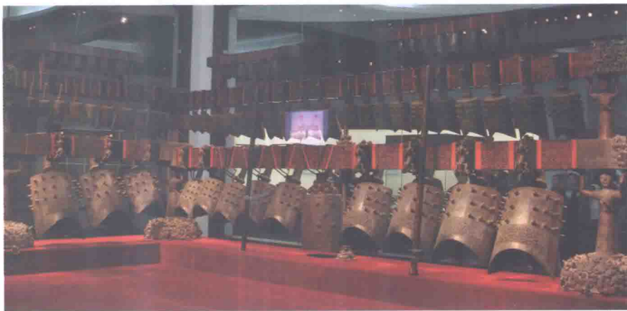
曾侯乙墓出土编钟 战国早期

乙墓出土。此编钟由六十五件青铜编钟组成，音域跨五个半八度，十二个半音齐备。这么庞大的乐器显示出了当时高超的铸造技术和良好的音乐性能，震惊世界，被中外专家、学者称之为“稀世珍宝”。