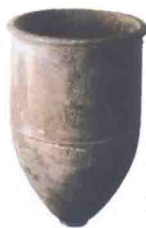
《符号灰陶》大汶口文化

仰韶文化出土的彩陶器，口沿上刻有各种符号，这些符号有些会重复出现，有些会出现在某一处遗址中，有的则出现在不同的遗址中，这些符号被认为是原始文字的雏形。另外，山东大汶口出土的陶器上的象形符号，西安半坡彩陶上的几何符号，距今8000年前河南贾湖龟甲上的几何符号、贾湖契刻符号等，这些都可能是原始文字形成中（或形成前）不同阶段的表现。