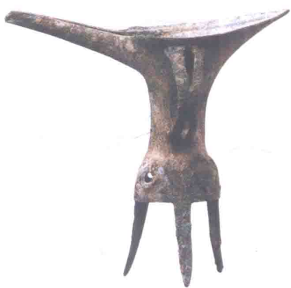
二里头文化-铜爵（酒器） 夏代