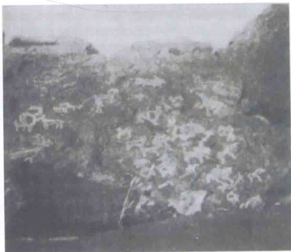
几公海勒斯太岩画 新石器时代