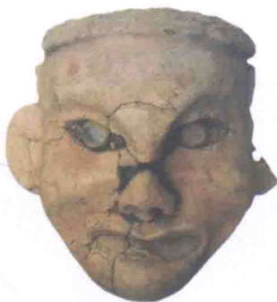
陶塑女神头像 红山文化