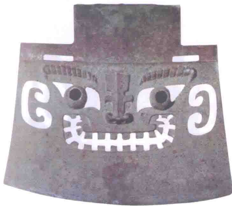
透雕人面纹铜钺 商代后期