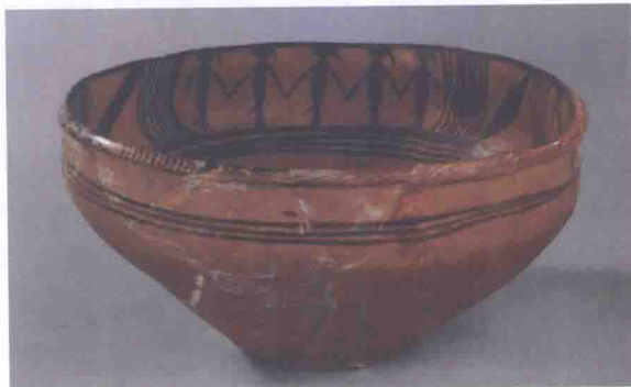
舞蹈纹盆 马家窑文化

从岩画的风格来看，它豪放粗犷，手法简练，风格质朴，在写实的基础上进行夸张。从所有的岩画图像中不难看出，岩画的创作并不是一种单纯的绘画艺术，而是融合在原始信仰中的巫术活动的产物，是人们消解生活困苦的精神寄托。