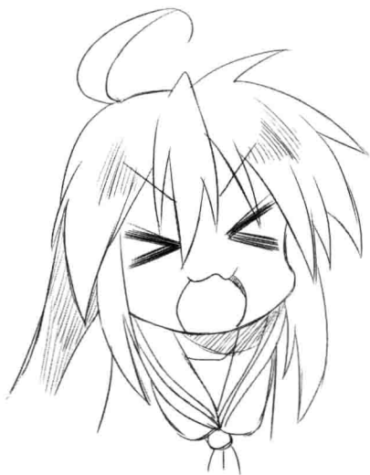
泉此方的夸张表情