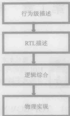
图 1-1 TOP-DOWN 设计层次

进行一项新的电路与系统设计，设计伊始，极有可能在行为级仿真时就不能通过，这说明设计者对所设计的电路与系统的功能理解有误，必须重新认识该电路与系统。经反复修改、调试，直到行为级仿真通过，验证了设计者对电路与系统的认识的正确性。此后，RTL 仿真可能通不过，此时，问题只可能出现在对信号流向、时序的认识方面，而不用再