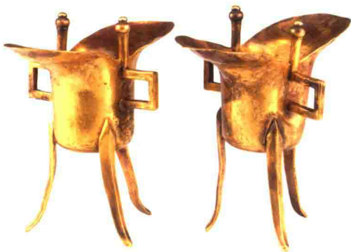
附图一 金爵，明朝，东波斋藏品

在南京（洪武帝墓）和北京，皇帝的陵墓往往处于城郊，陵园如十三陵位于北京西北部，离北京40公里左右。永乐皇帝的陵墓长陵，于1415年建成，成为十三陵的中心，其他十二座陵墓分布在周围的山坡上，围绕着神道（附图二）。在所有的皇陵中，唯有1573—1620年间在位的万历皇帝朱翊钧的陵墓定陵在1956—1958年间被抢救性发掘。它始建于1584年，直到1590年才完成，据史料记载，在它建成之后，皇帝还在那里大宴群臣。这座地下宫殿主要由石料砌成，长达87.34米，宽47.28米，面积达1195平方米，共耗用了八百万两银子，相当于整个国家两年的税收（附图三）。1957年10月，考古学家们进入了皇帝的墓室，陪葬于他的身边的是孝端皇后和孝景皇后。