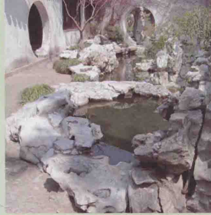
蜗庐成趣(浴鸥小院)