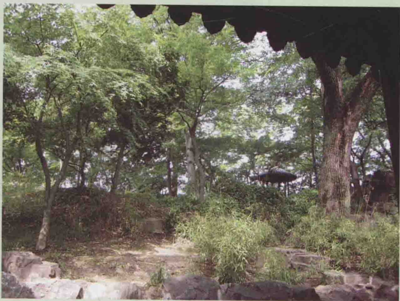
登东皋以舒啸 (舒啸亭)