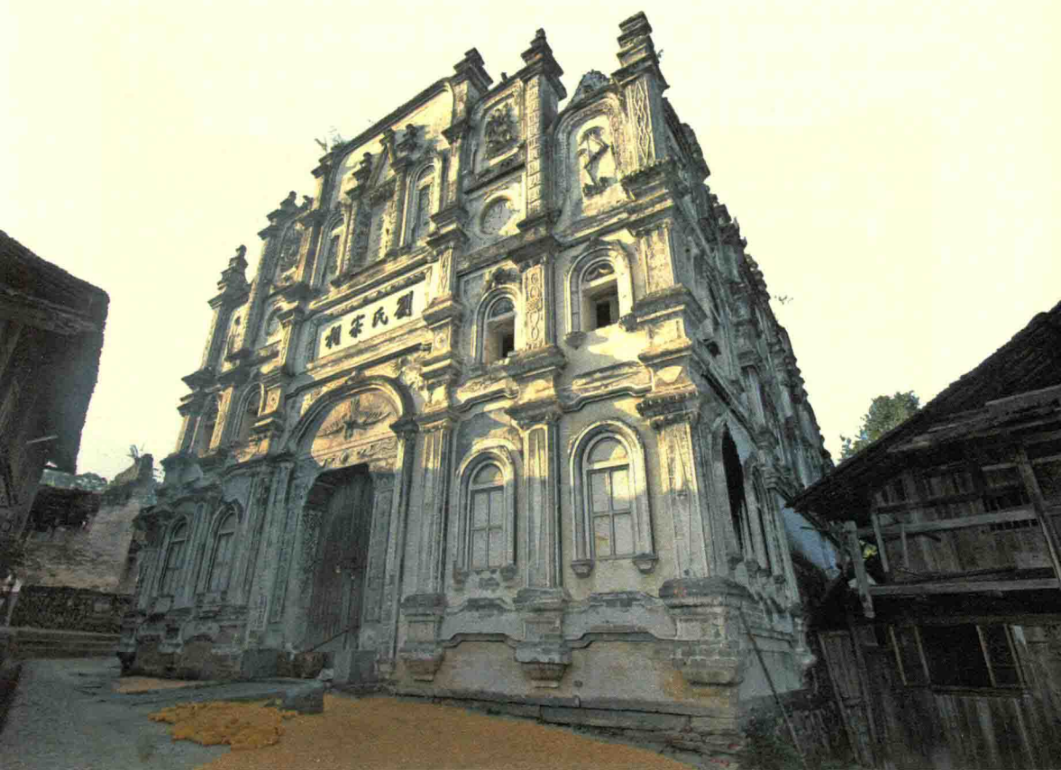
天柱县最具代表性的宗祠——刘氏宗祠全景

本项目自2009年立项以来，鉴于天柱域内宗祠分布广、涉及面宽等实际情况，课题组成员对天柱祠堂的实地调查主要实施了11次，从2009年10月至2011年2月，先后深入天柱县16个乡镇50余个行政村进行田野调查。在考察过程中，主要获取的信息有祠堂的建筑面积和占地面积、坐向、规模、具体布局、所属民族、建筑年代、文物、族谱等。尽管课题组成员曾多次进入历史现场，但“来去匆匆”的调研活动，显然和人类学所倡导的田野方法有所差别。因此，