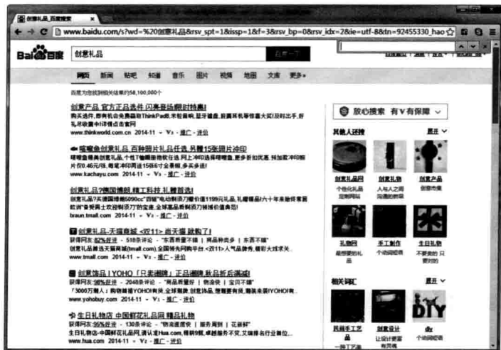
图1.1 在百度中搜索“创意新品”

SEO是Search Engine Optimization的英文缩写，中文称为搜索引擎优化。对于在互联网中“安居乐业”的站长们来说，搜索引擎可能是网站或者博客的主要流量来源。例如要搜寻一个创意产品的网站，可以进入百度搜索引擎（http://www.baidu.com），然后在搜索框中输入关键词“创意新品”，搜索引擎将会从其索引库中的成千上万条记录中查找与创意新品相关的网页，如图1.1所示。