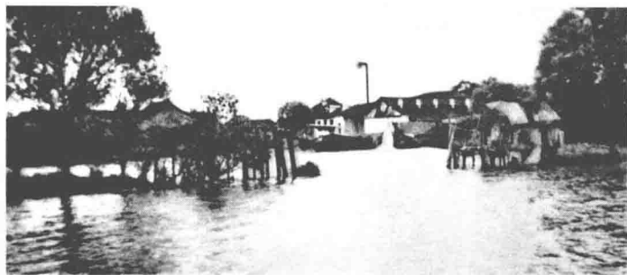
一九三〇年代的江村