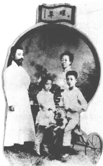
费孝通的父母及兄长和姐姐