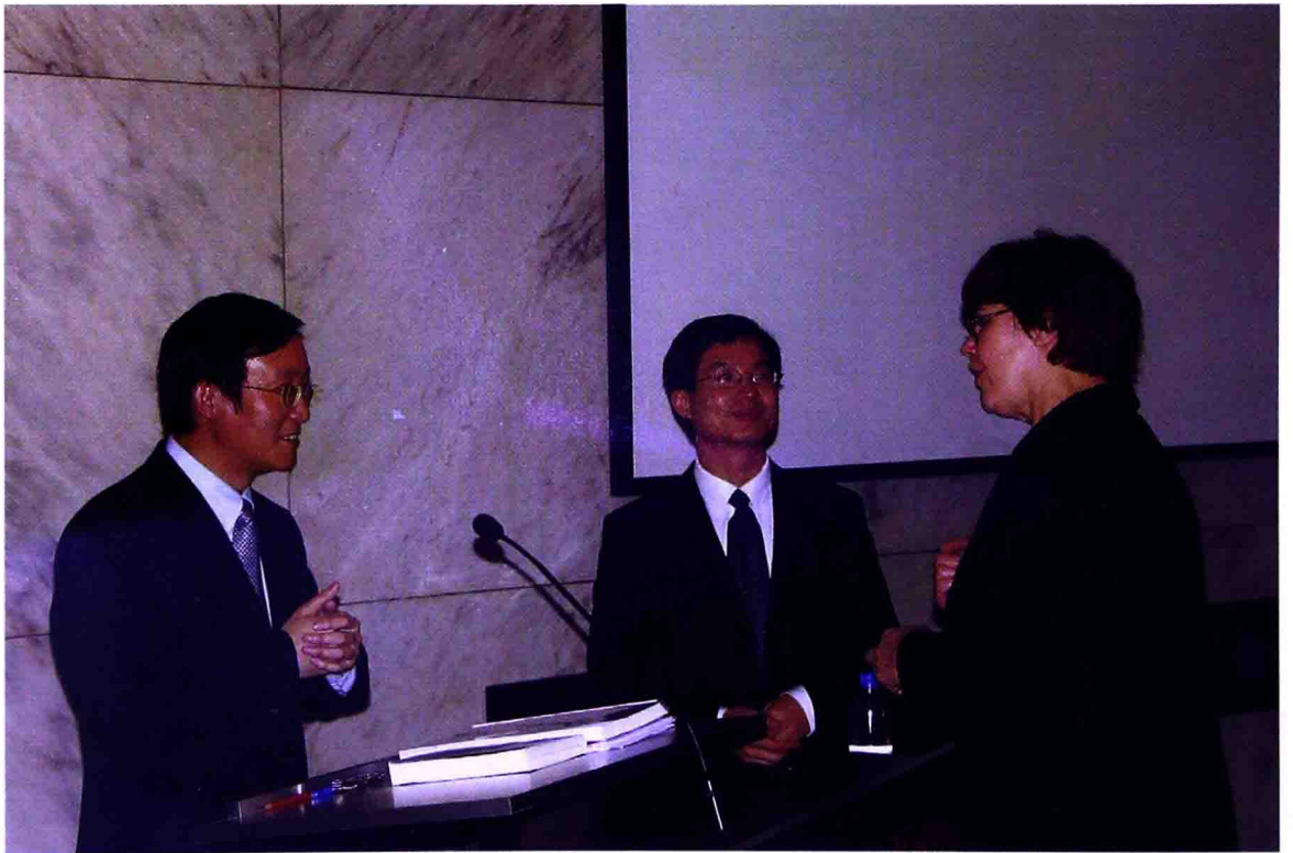
▲ 学术会议 沟通有无