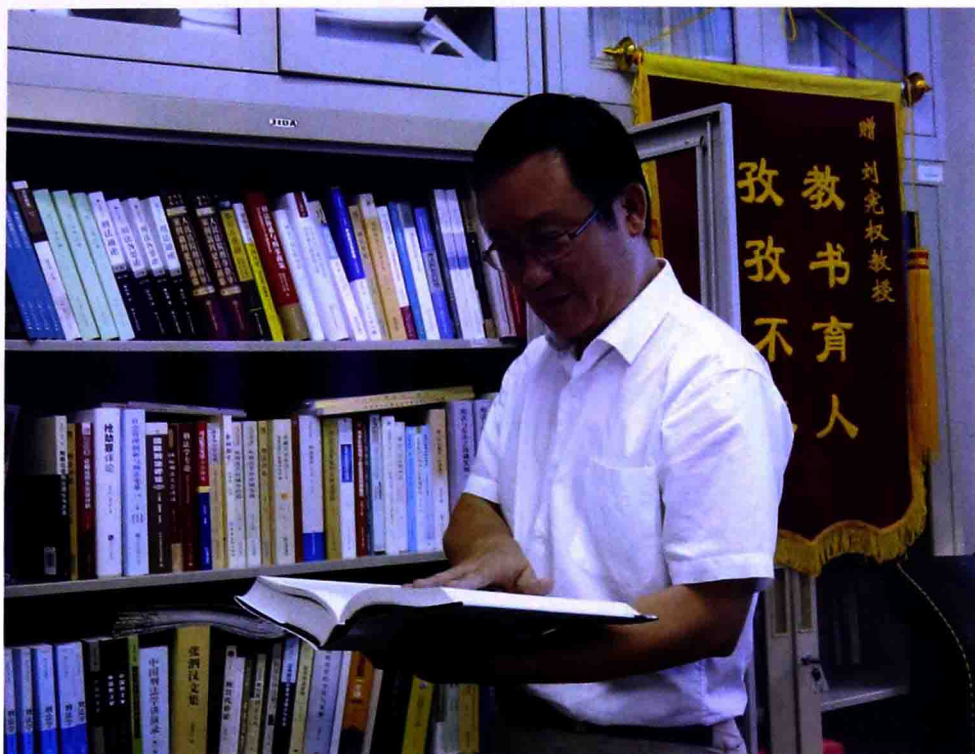
▲ 学术研究 一丝不苟