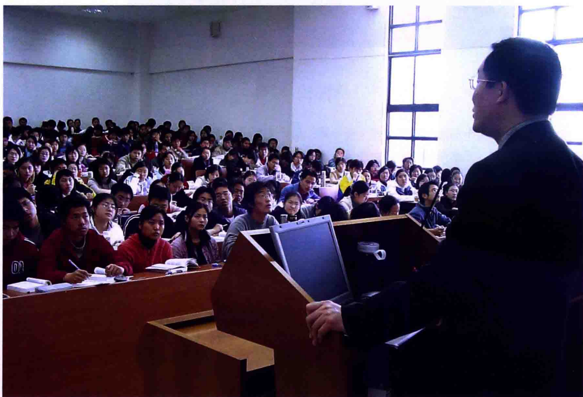
▲ 三尺讲坛 辛勤耕耘