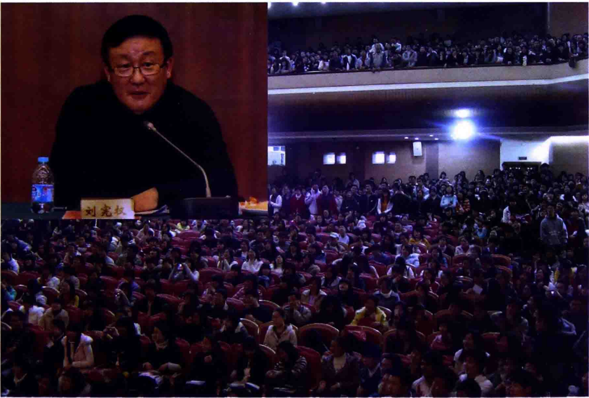
▲ 热点评析 爆棚满座