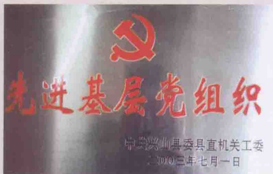
2003年被机关工委评为先进基层党组织