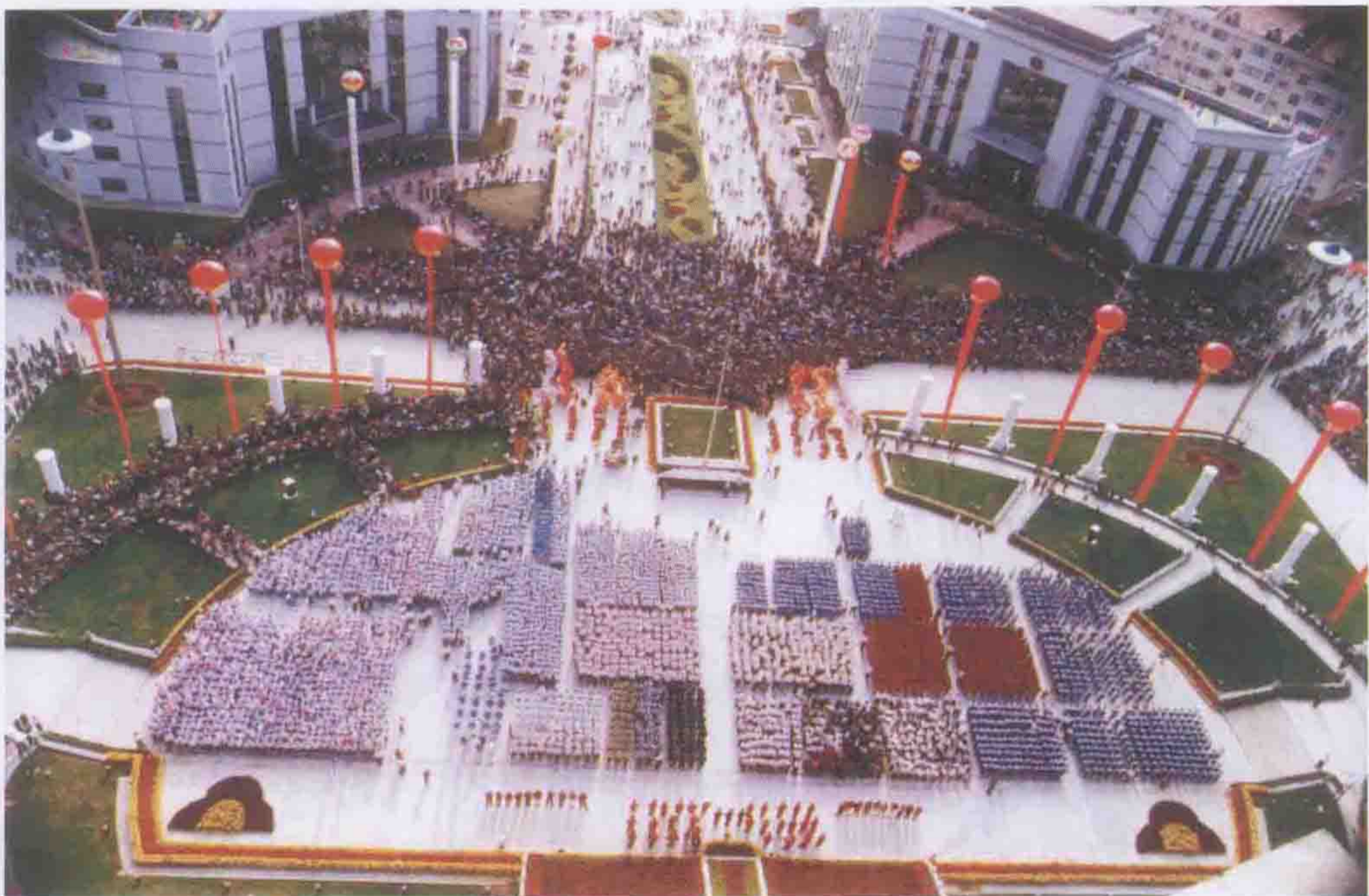
新县城庆典这天，古夫镇人声鼎沸，彩旗飘扬，近四万人参加这一庆典活动。