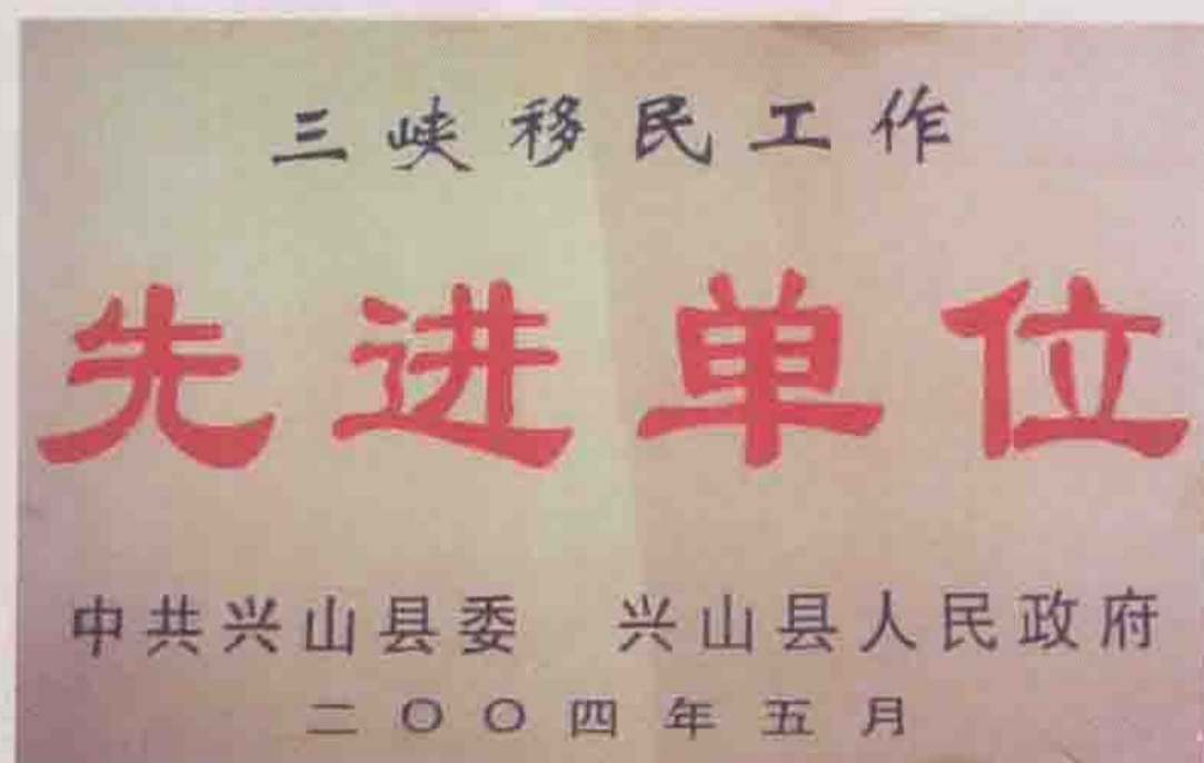
2004年被兴山县委、县政府评为移民工作先进单位