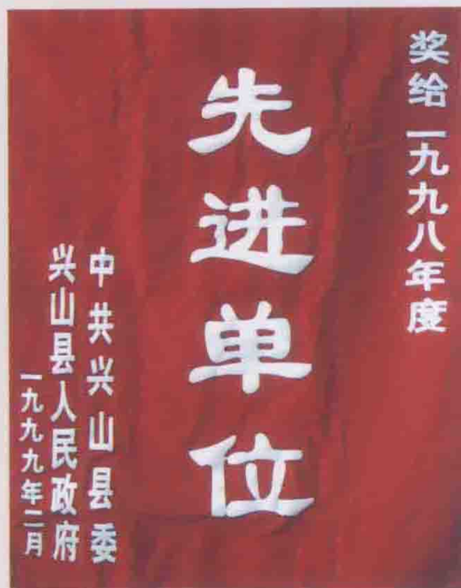
1998年被兴山县委、县政府评为先进单位