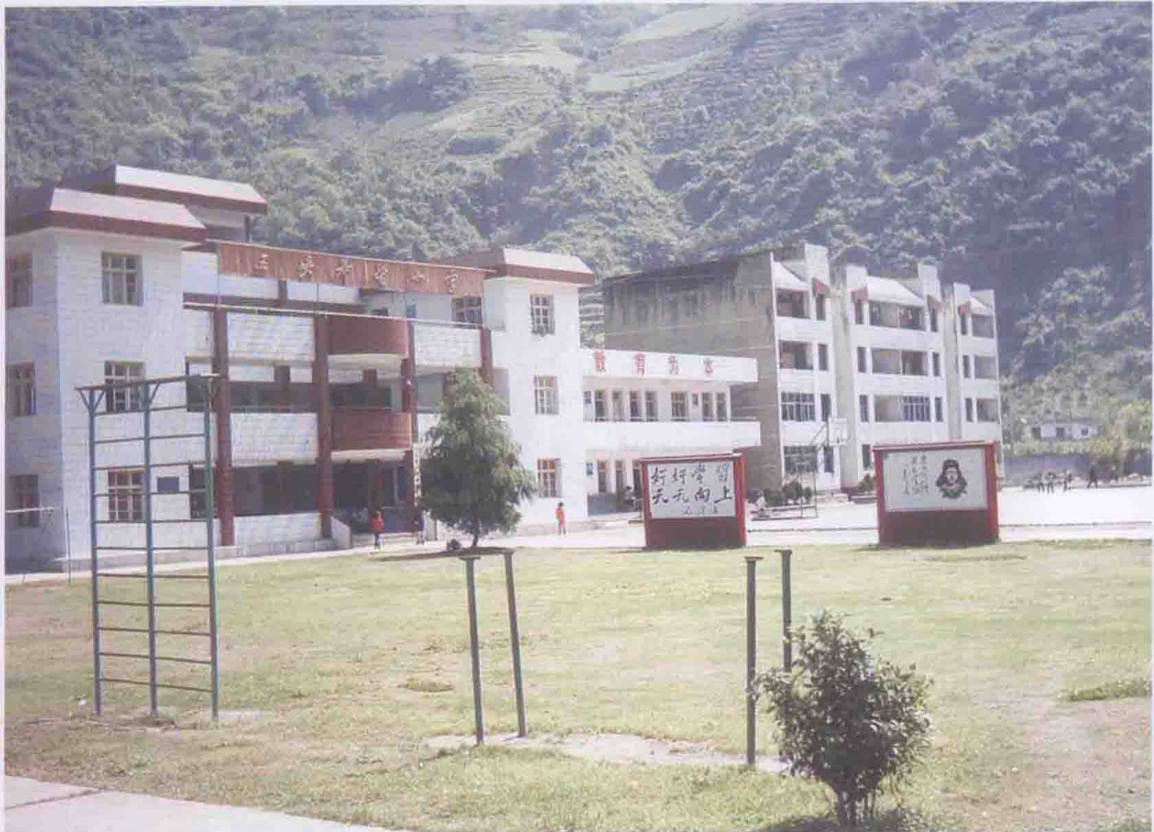
三峡总公司援建的三峡希望小学。