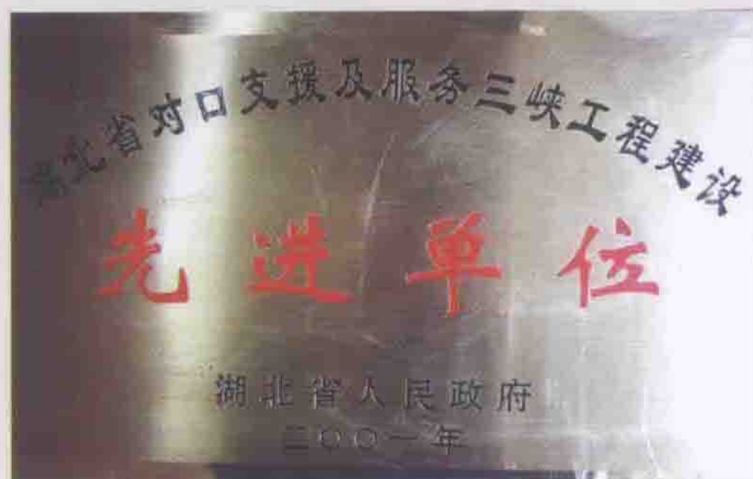
2001年被湖北省人民政府评为先进单位