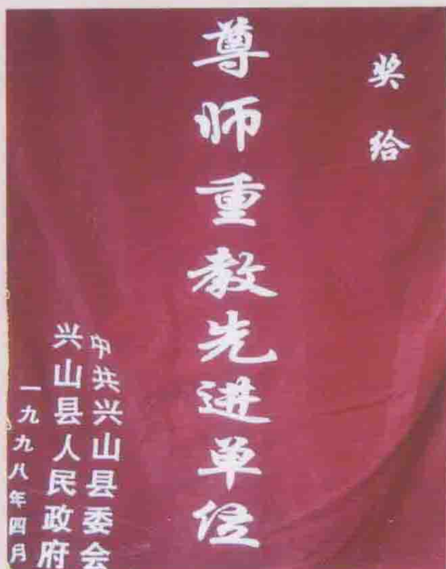
1998年被县委、县政府评为“尊师重教”先进单位