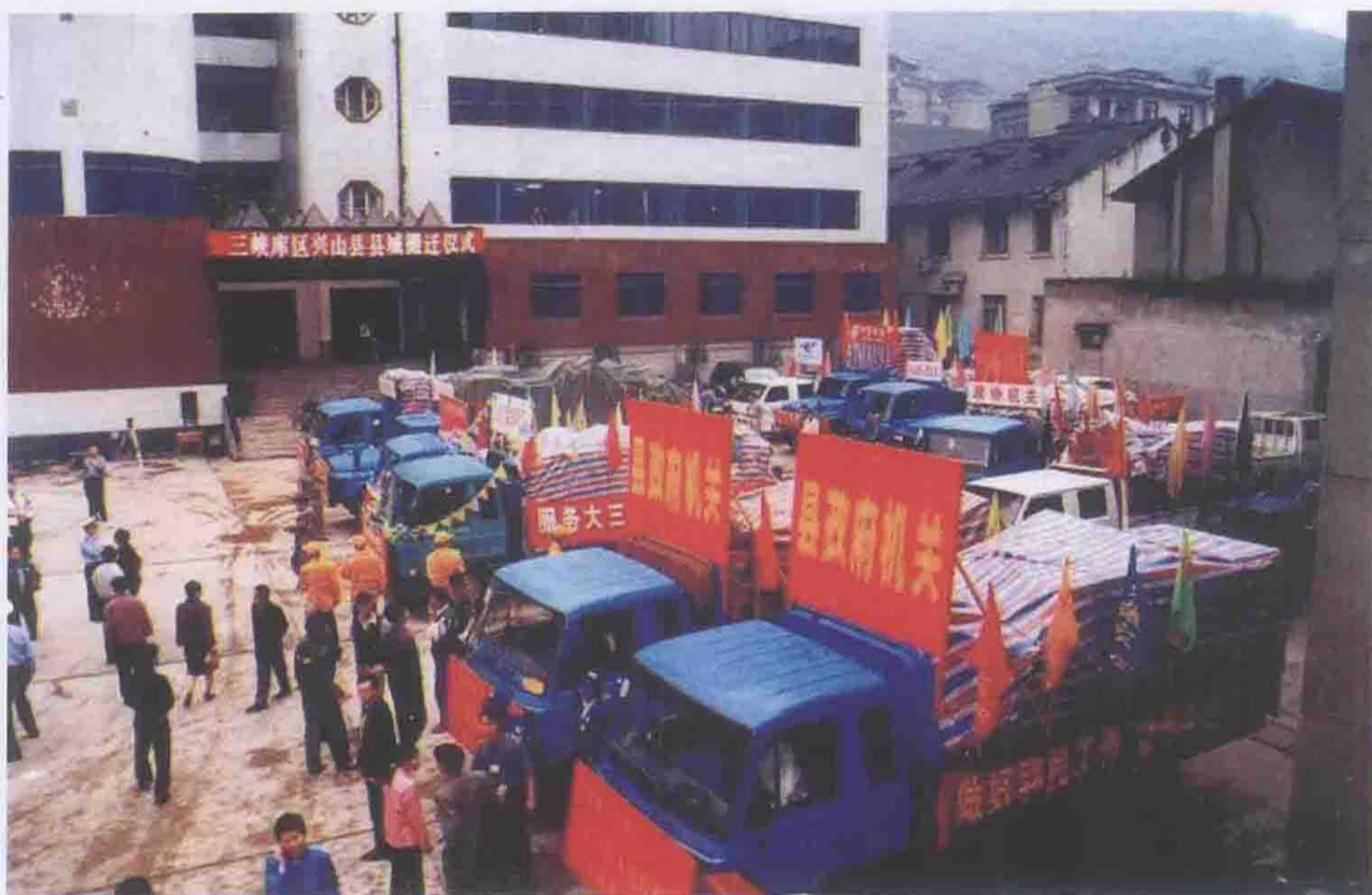
2002年5月28日县直机关搬迁启动。