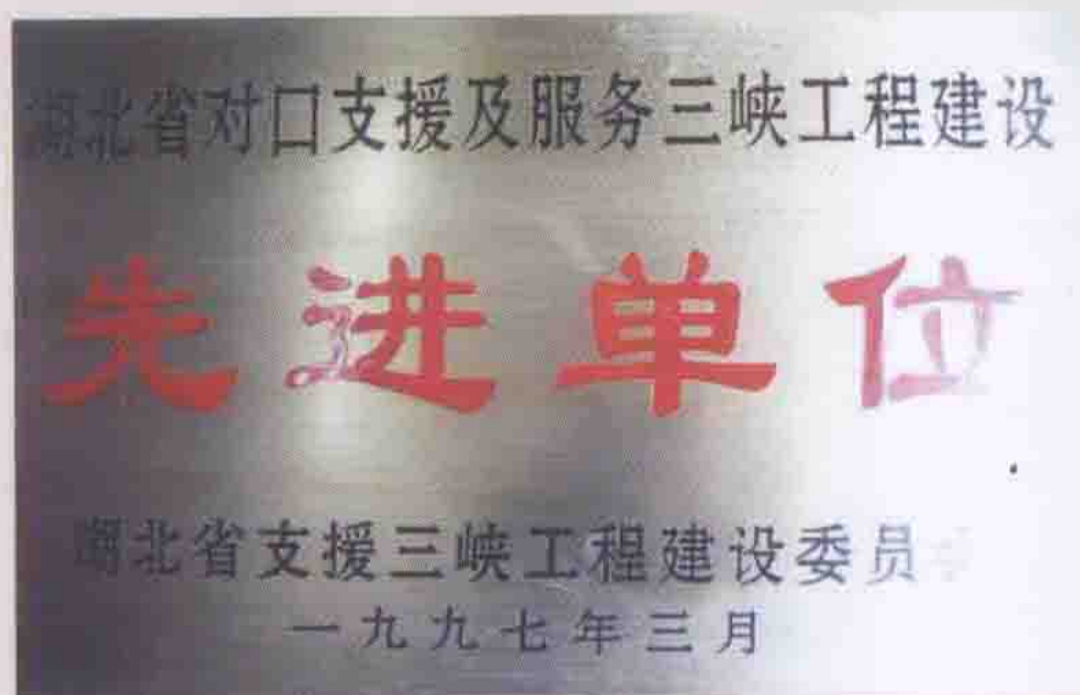
1997年被湖北省三峡工程建设委员会评为先进单位