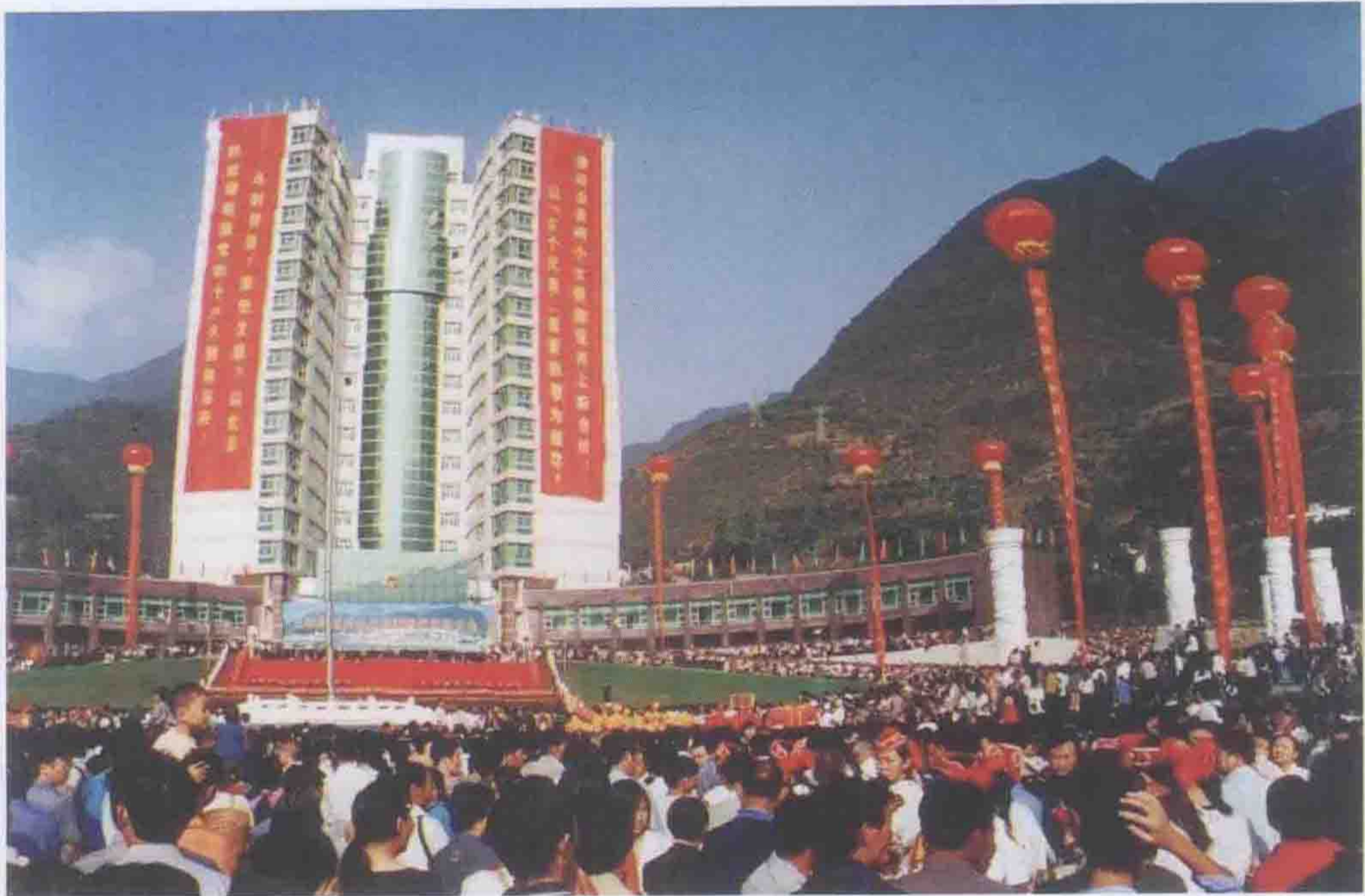
2002年9月28日，兴山县古夫镇举行新县城落成庆典仪式。