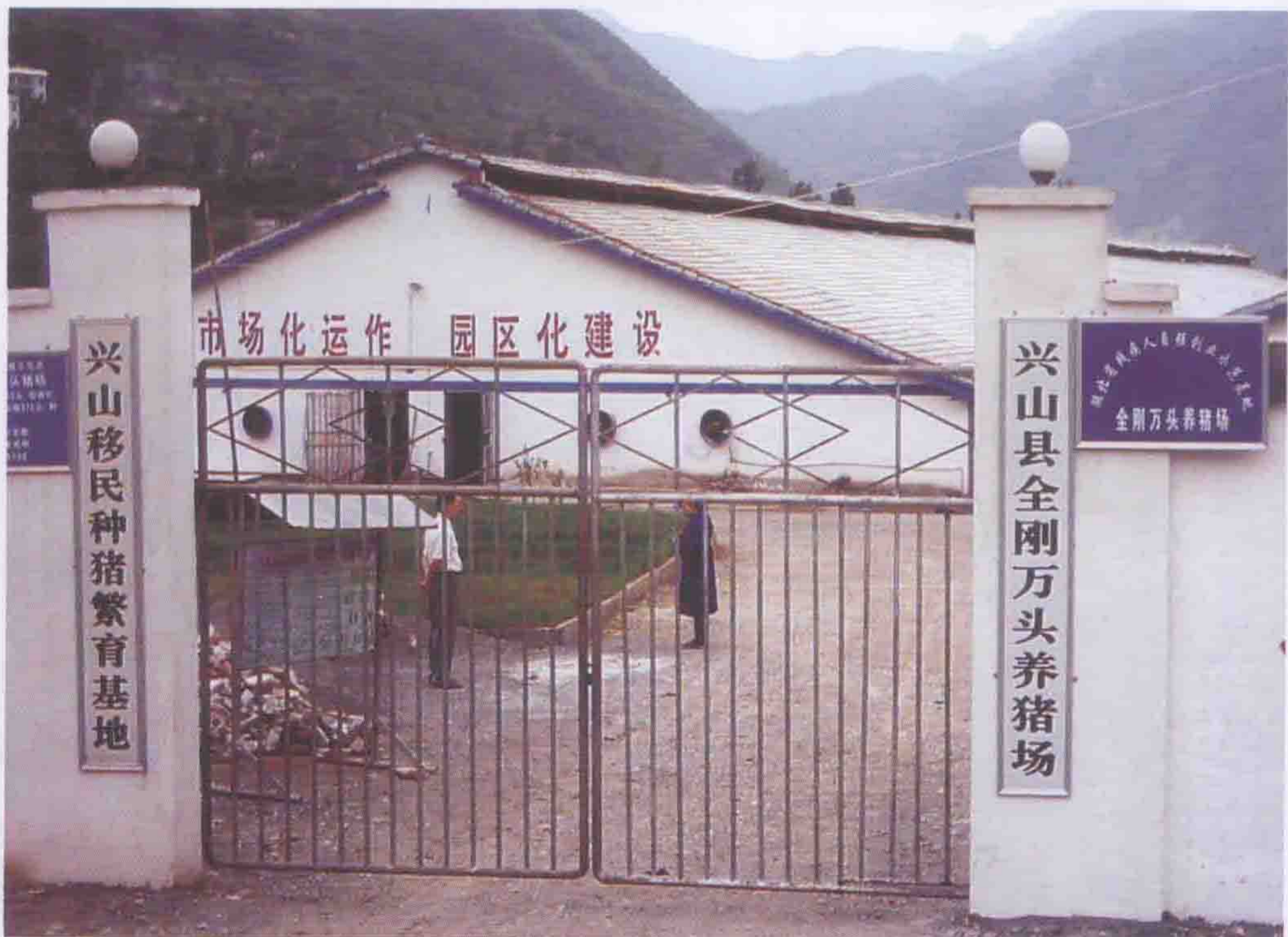
国务院三峡办援建的兴山县全刚万头养猪基地。