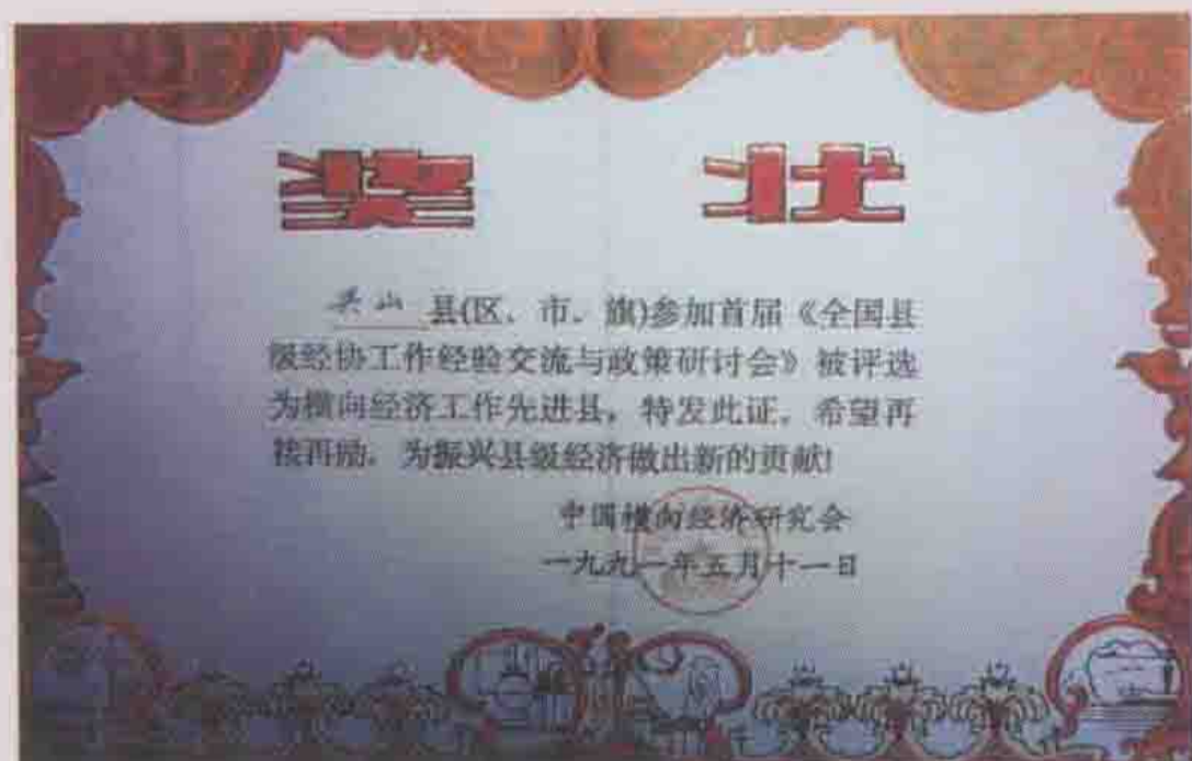
1991年被中国横向经济研究会评选为横向经济工作先进县