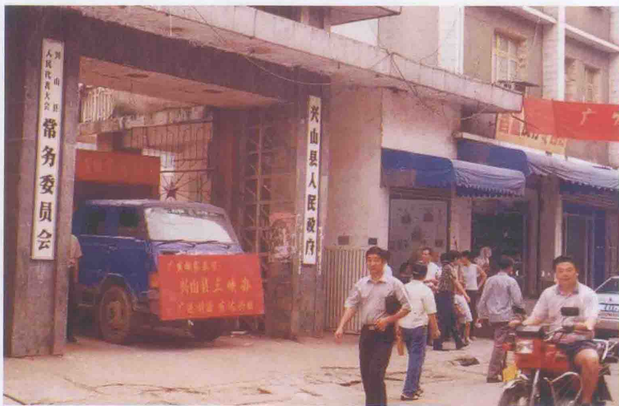
2002年6月，兴山县三峡办迁入新县城古夫镇办公。