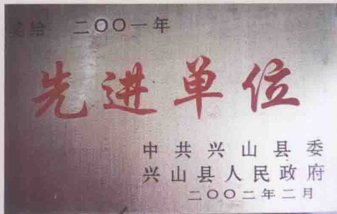
2001年被兴山县委、县政府评为先进单位