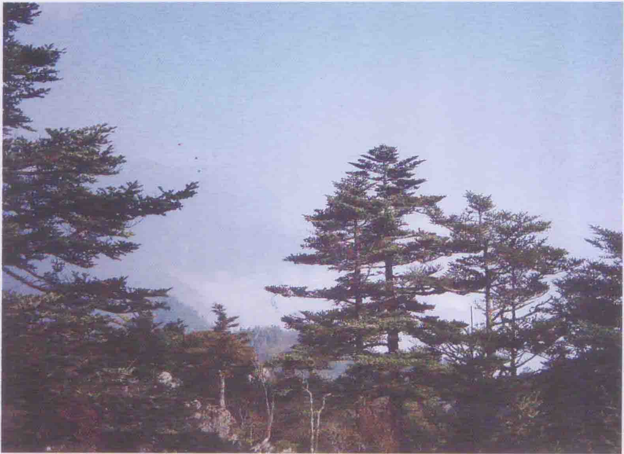
国务院三峡办援建的龙门河自然保护区项目。