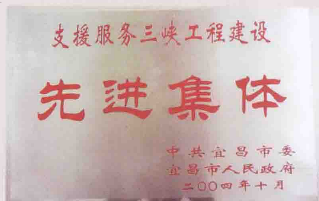
2004年被宜昌市委、市政府评为先进集体