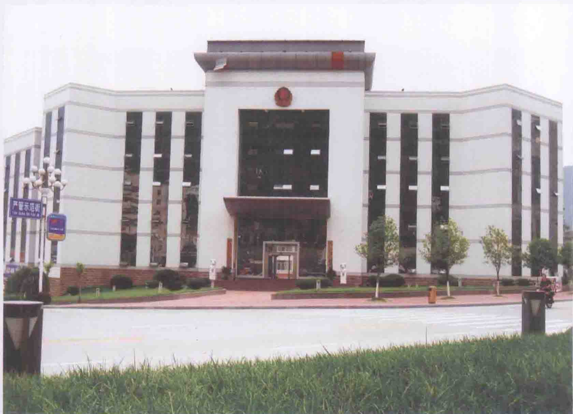
广东省公安系统为兴山县公安局修建办公大楼援助资金200万元。