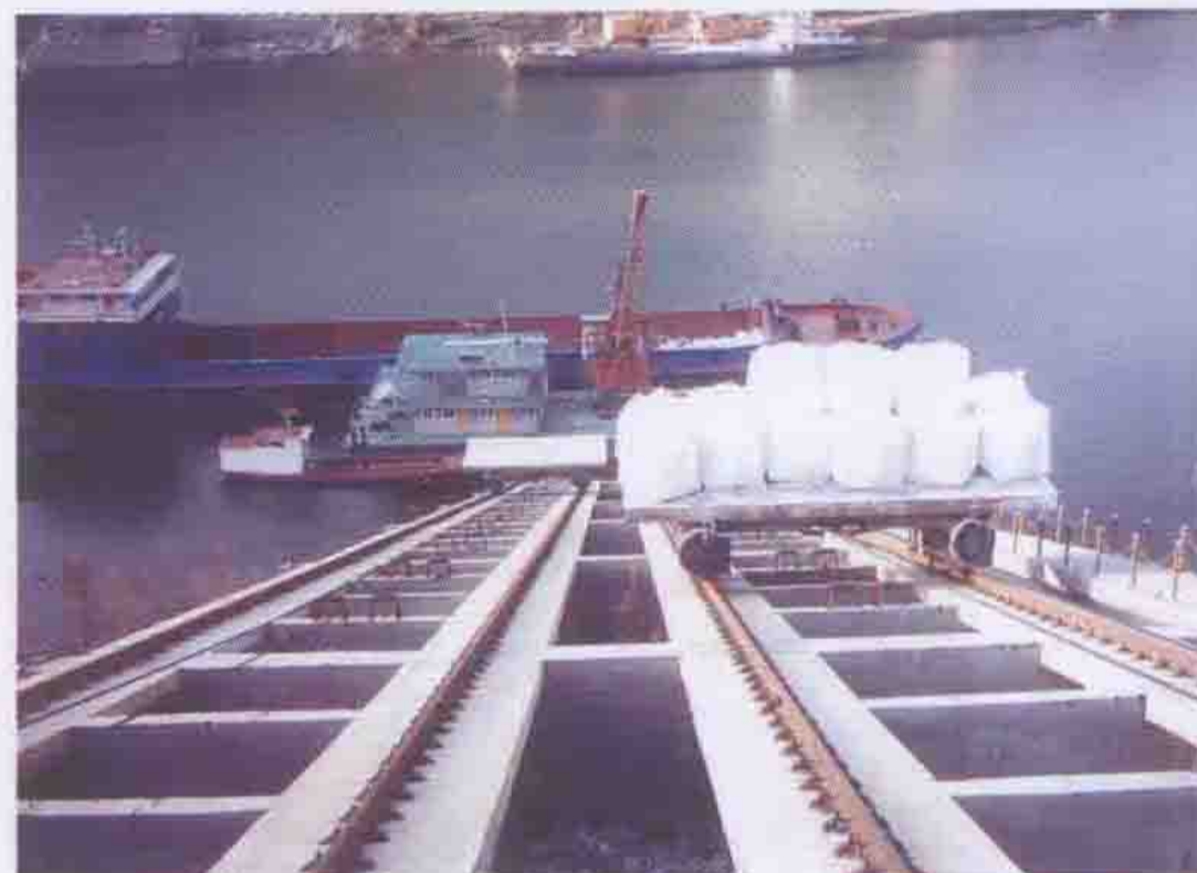
兴发化工产品远销海内外