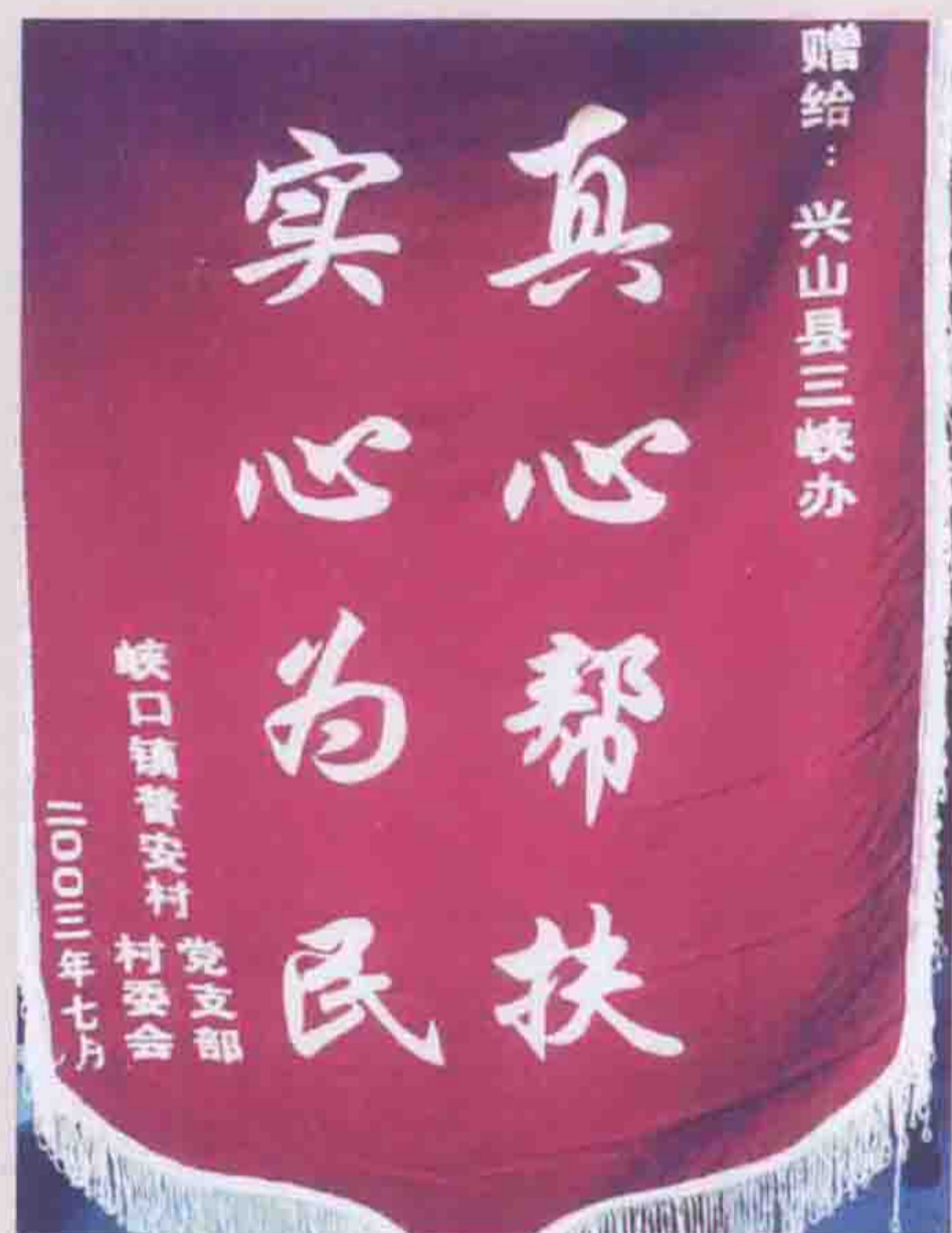
2003年扶贫村峡口镇普安村为三峡办赠送“真心帮扶、实心为民”锦旗