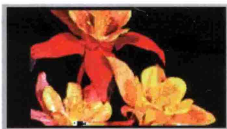
户内双基色显示屏