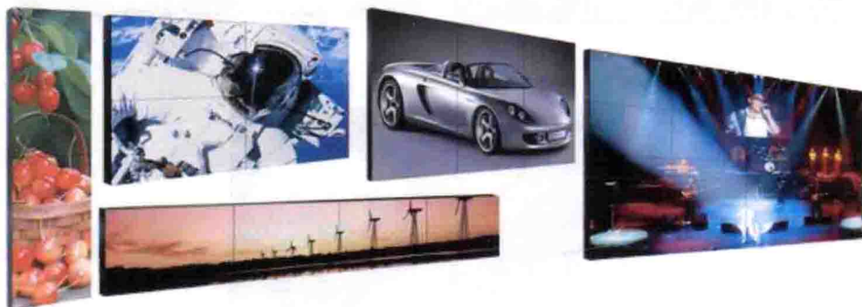
■ 图11-6 等离子拼接显示系统的实际应用效果