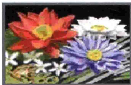
户内全彩色显示屏