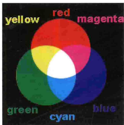
■ 图10-3 三基色示意图