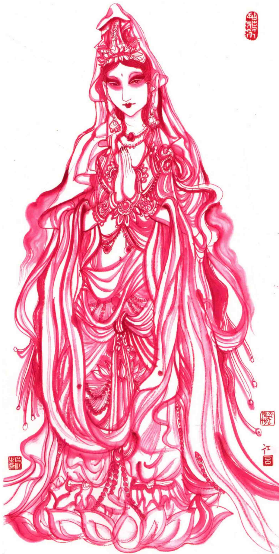
踏 蓮 69.5cm × 34cm 2013