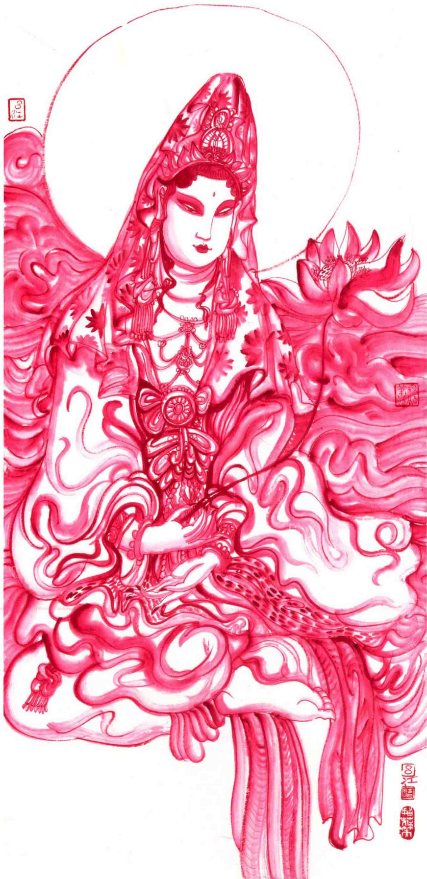
出水莲 96.5cm × 45cm 2014