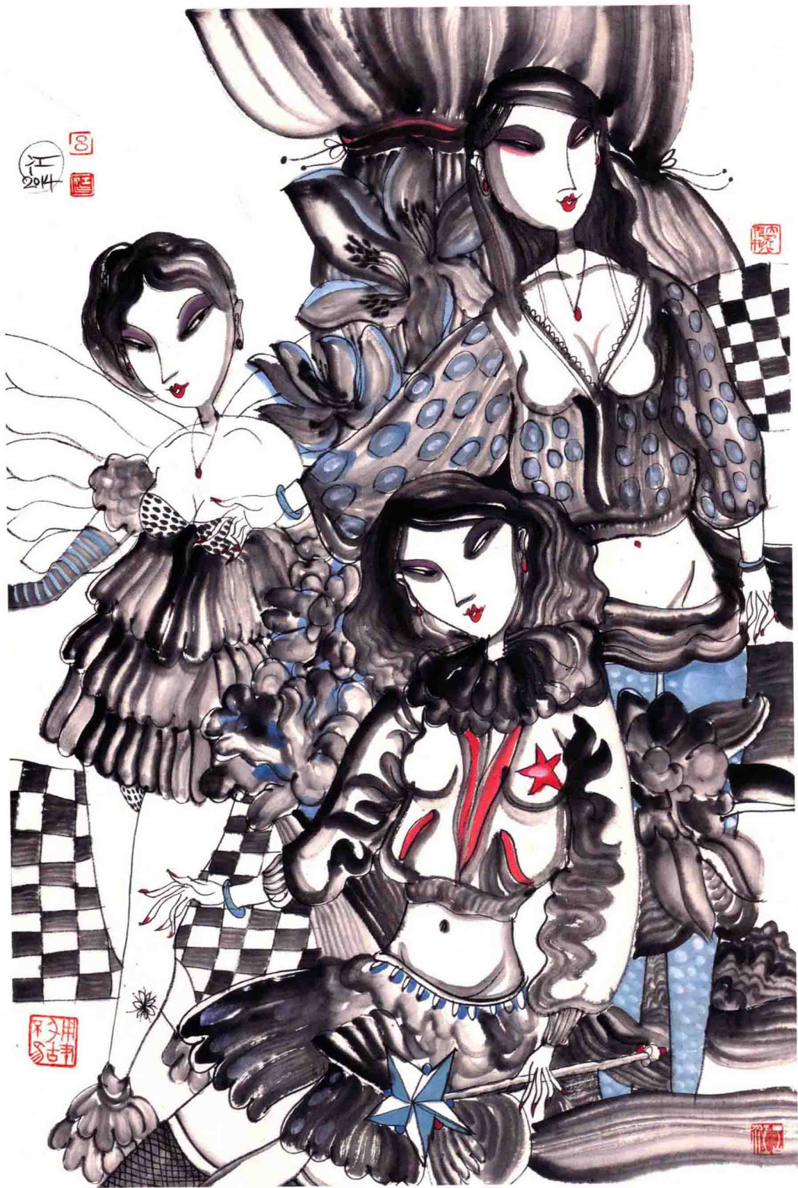
走秀 70cm × 46cm 2014