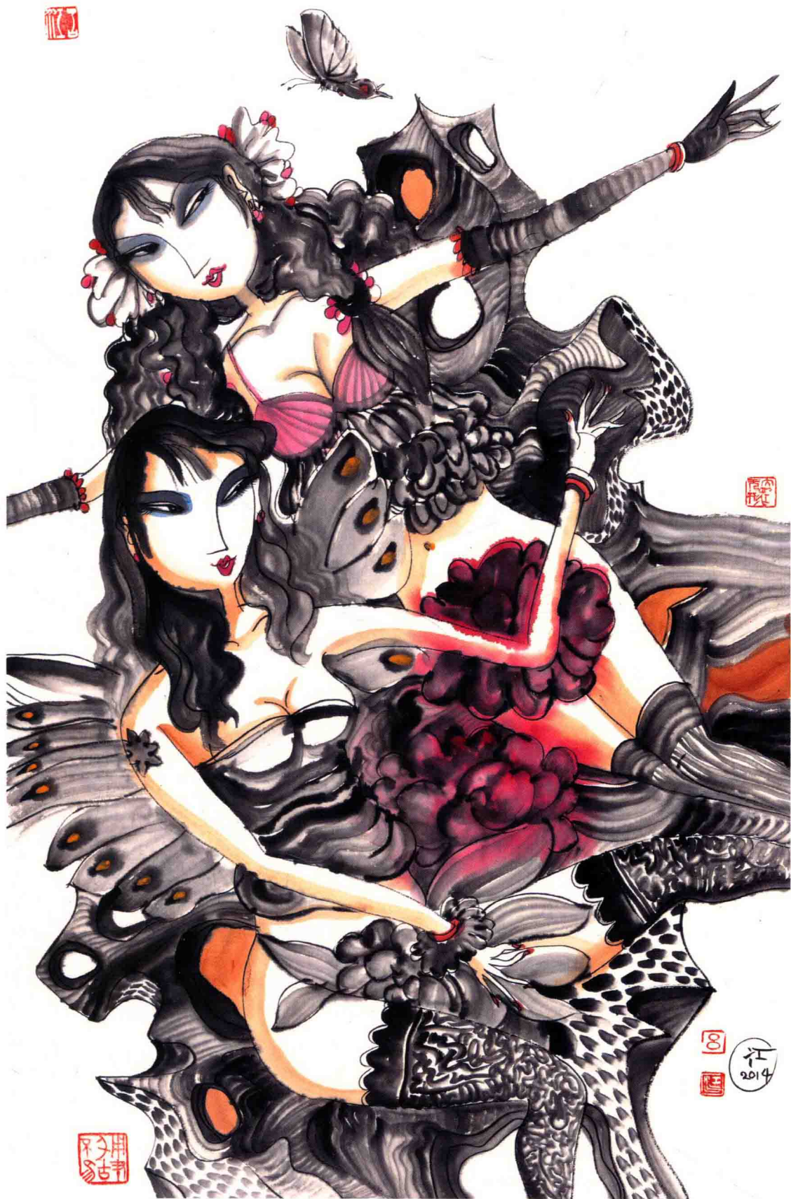
平衡 70cm × 46cm 2014