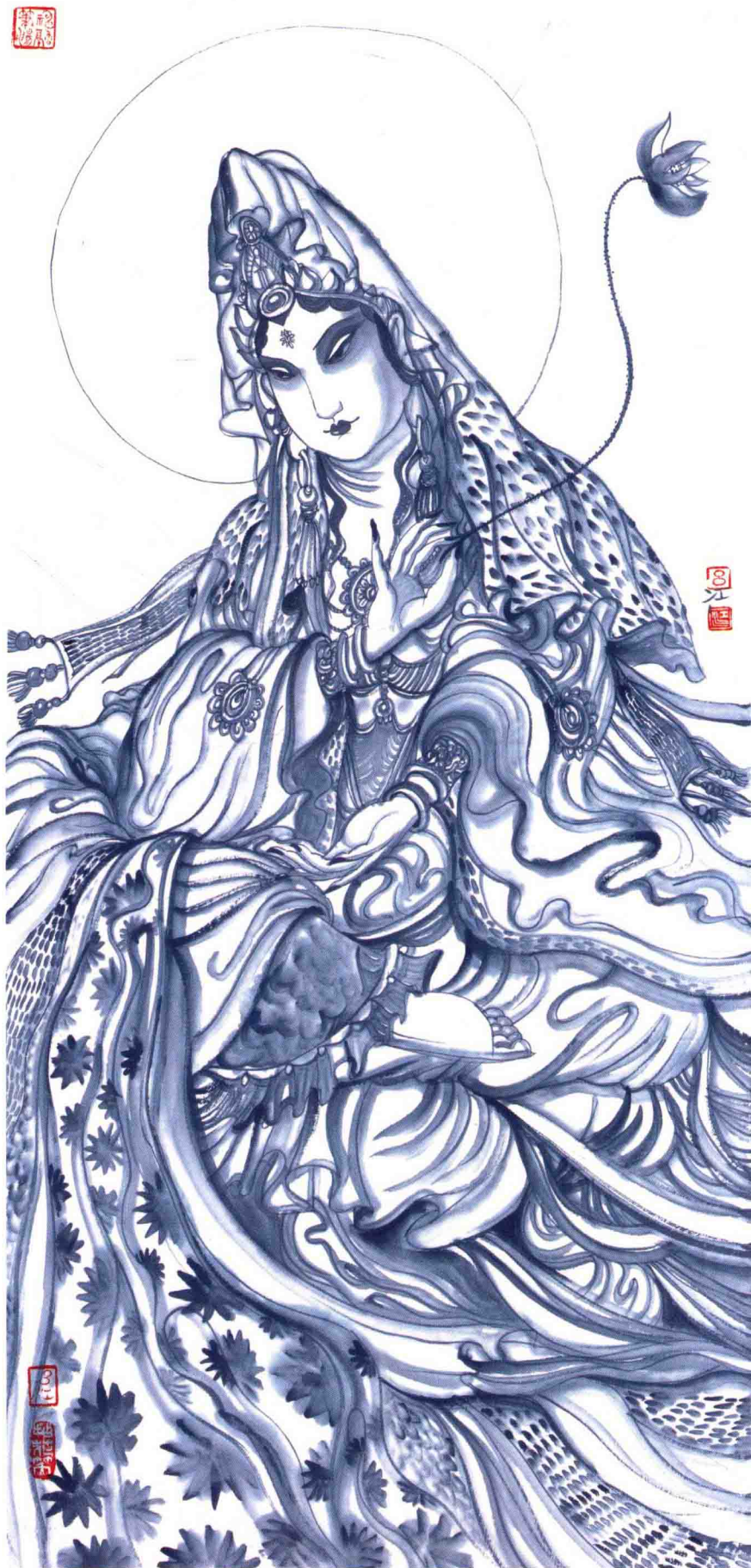
拈花笑 96.5cm × 45cm 2014