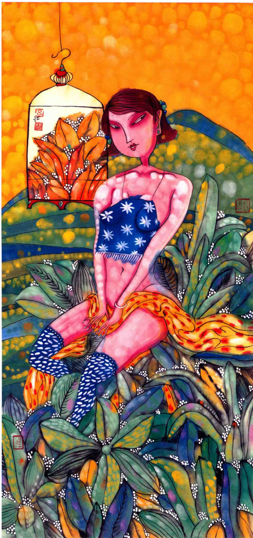
空巢 96.5cm × 44.5cm 2014