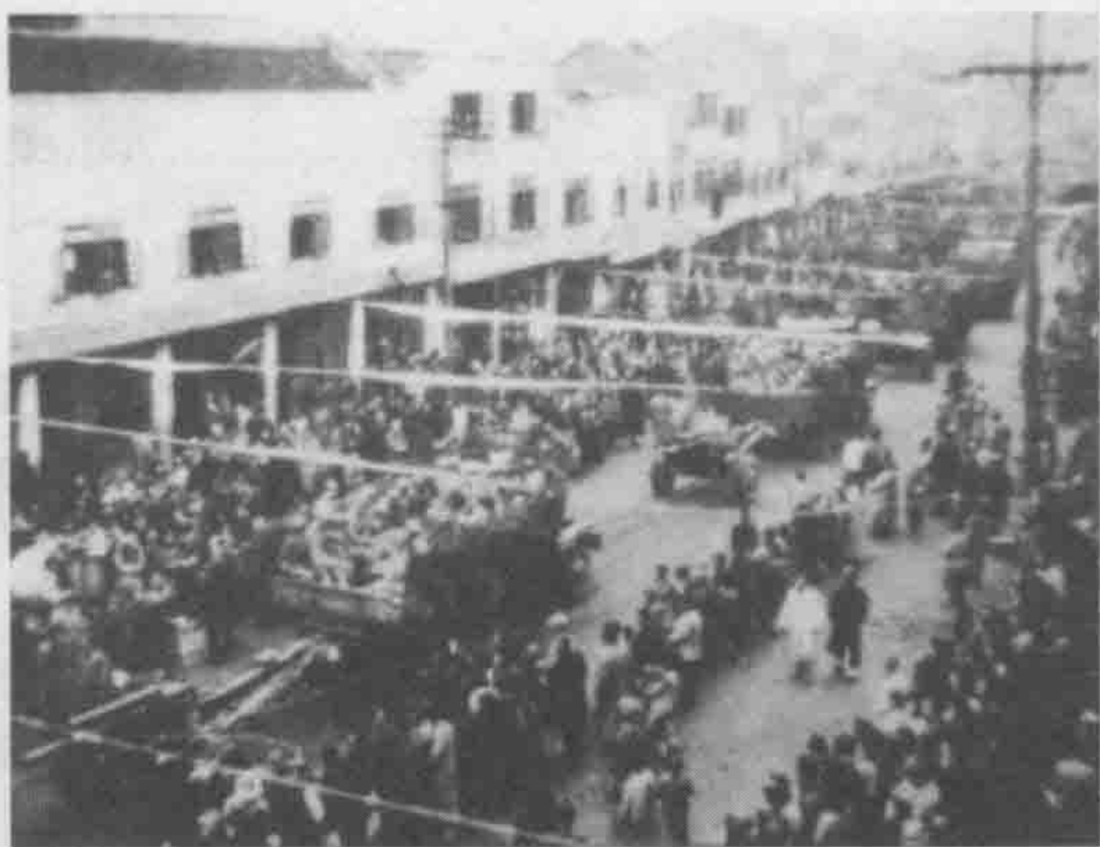
1949年解放军通过中华路。