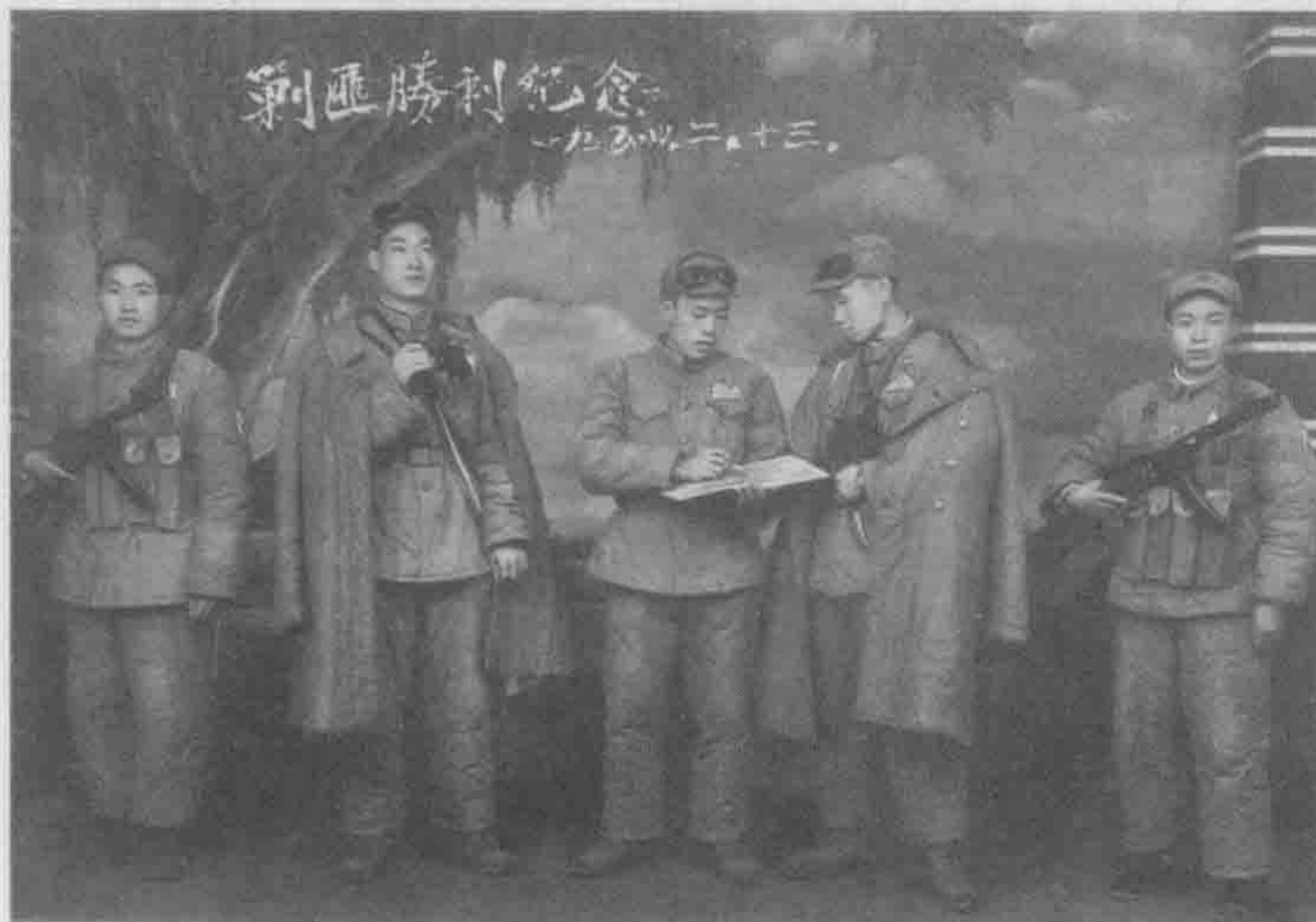
1954年2月,参加惠水剿匪任务的公安大队官兵。

后,队伍爬上观音山,准备开展解放贵阳的战斗。但敌人早已丢下贵州以东这个最后屏障——贵阳,逃得无影无踪了。为防止敌人对贵阳进行破坏,部队紧接着发出动员令:“快赶,快追,别叫敌人把贵阳破坏了。”