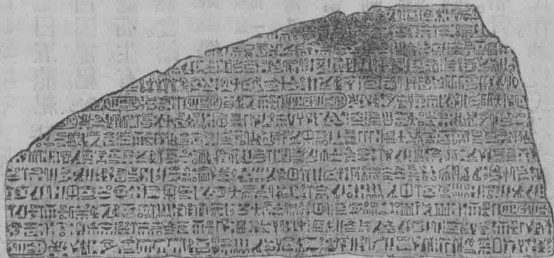
埃及古碑五錐形字