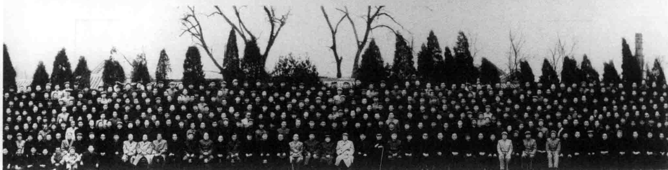
1963年4月2日，毛泽东主席等党和国家领导人接见出席第三、第四机械工业部全国性专业会议的全体人员（其中有航空工业的代表若干名）

毛泽东主席和党中央的其他领导同志接见出席第三机械工业部、第四机械工业部全国性专业会议的全体人员合影 一九六三年四月二日