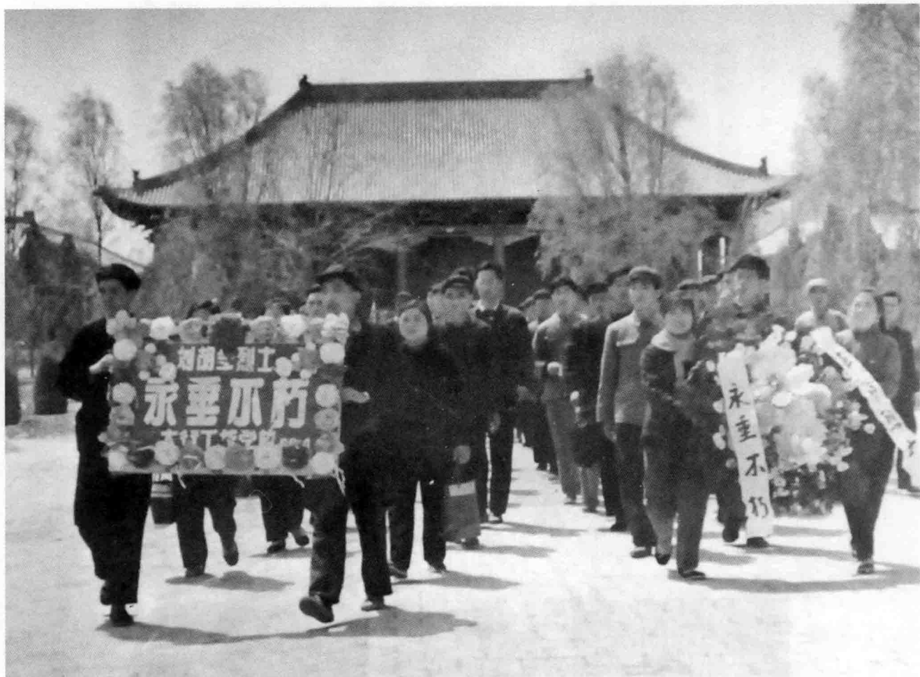
赴刘胡兰烈士陵园扫墓并献花圈

训练中，男女民兵全都严抠细训，决不放过一个细小的不规范的动作；工作中，他们积极主动，所到之处，红旗一扬，什么苦活、累活、脏活、突击性的任务全都解决了。在当时治理汾河和防汛劳动中，