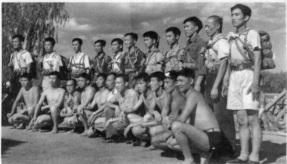
进行武装环湖比赛