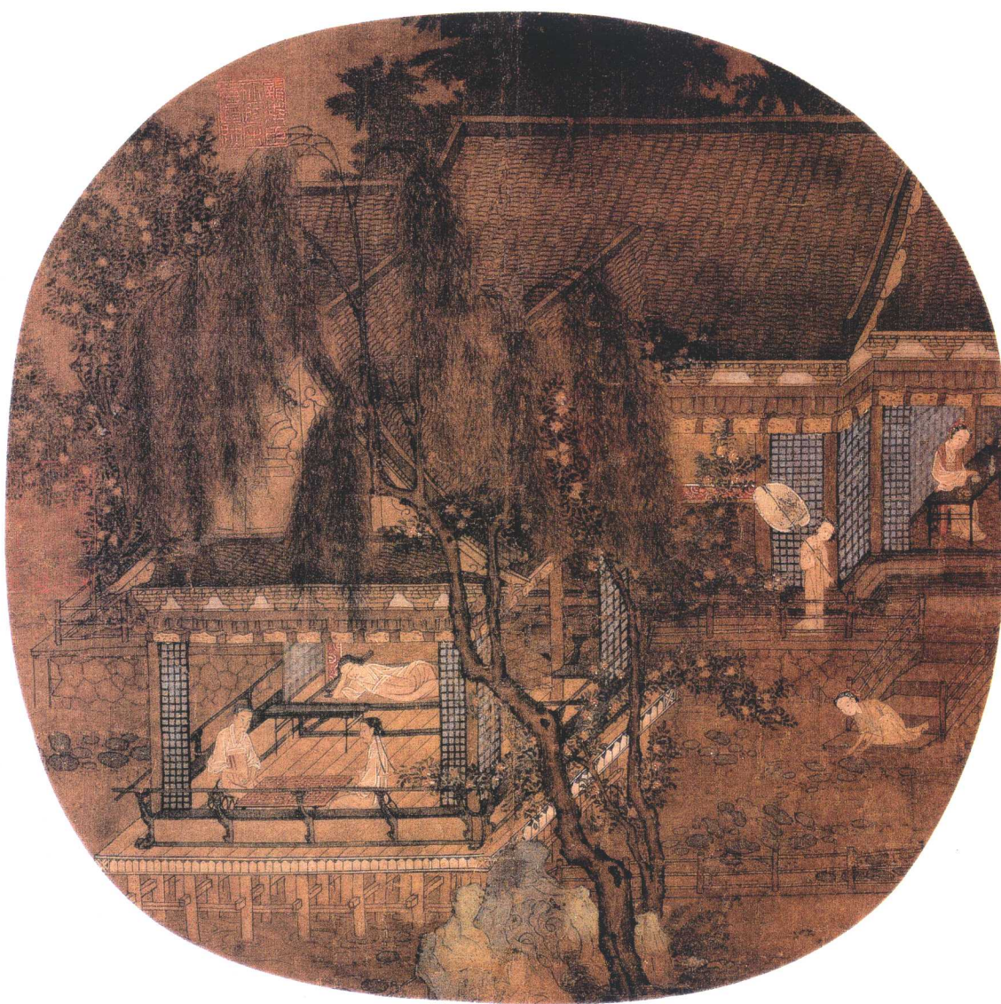
无款 荷亭对弈图页 南宋