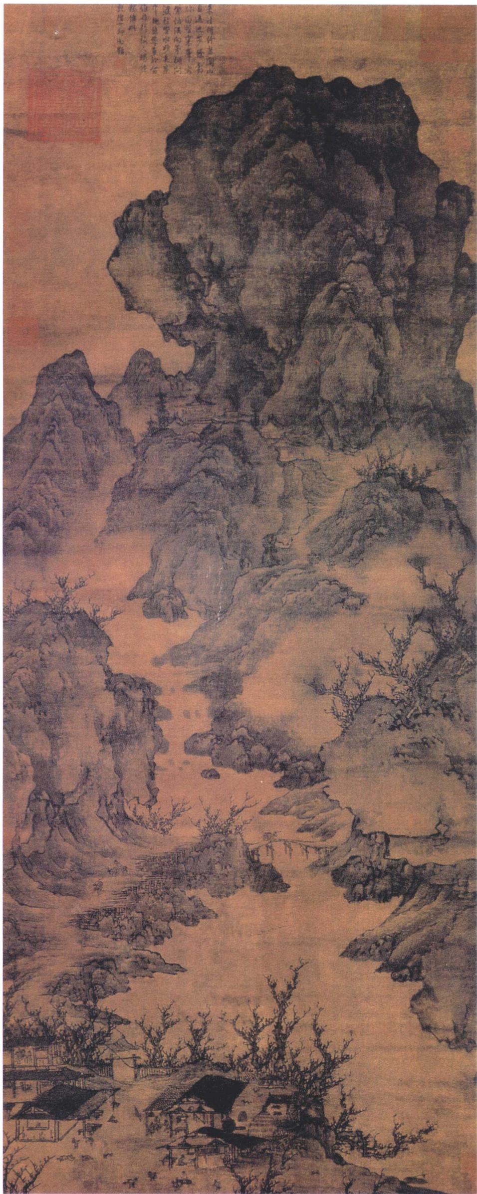
关仝 关山行旅图轴 五代