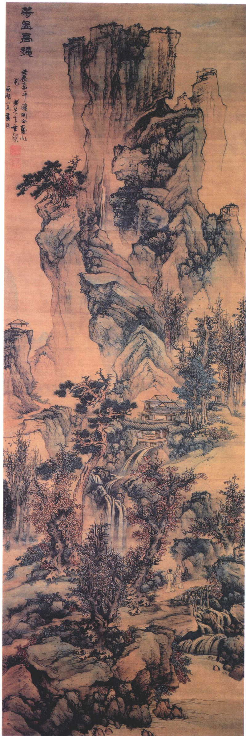
蓝瑛 华岳高秋图轴 明