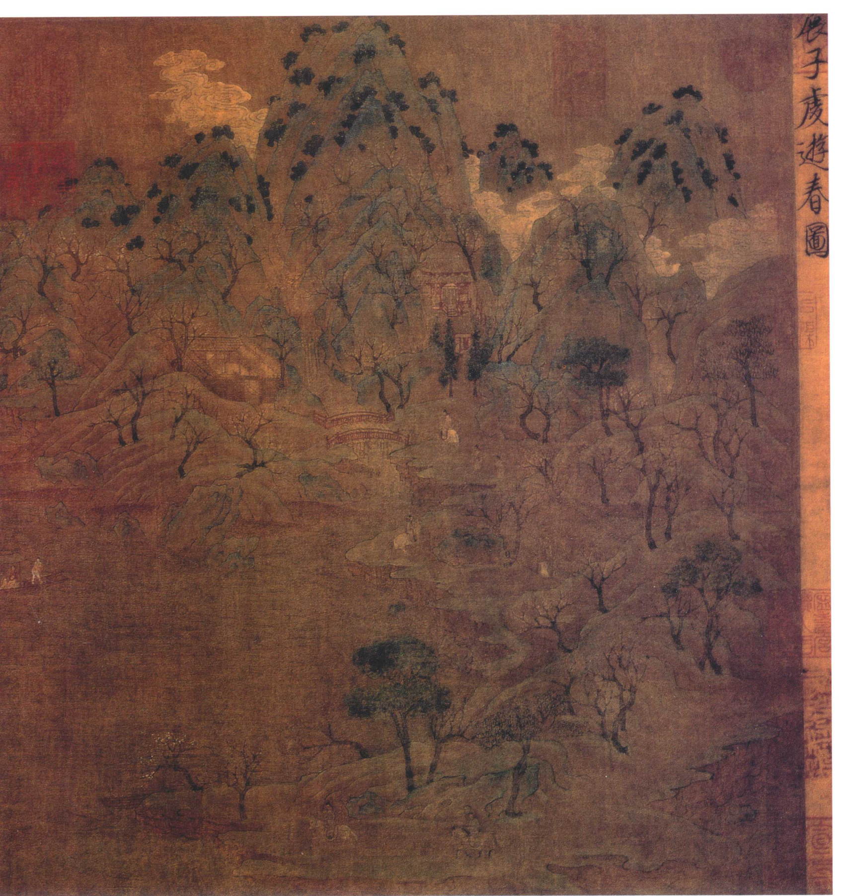
展子虔 游春图卷 隋