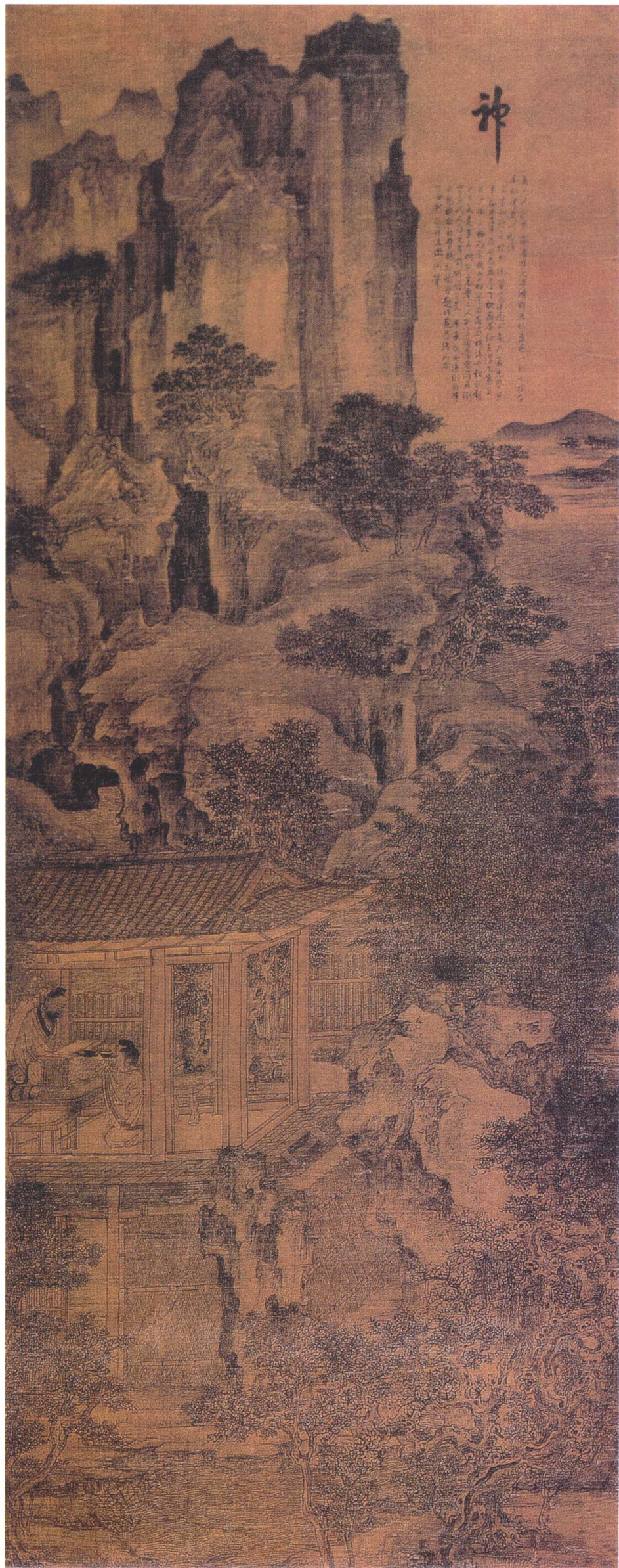
卫贤 高士图轴 五代