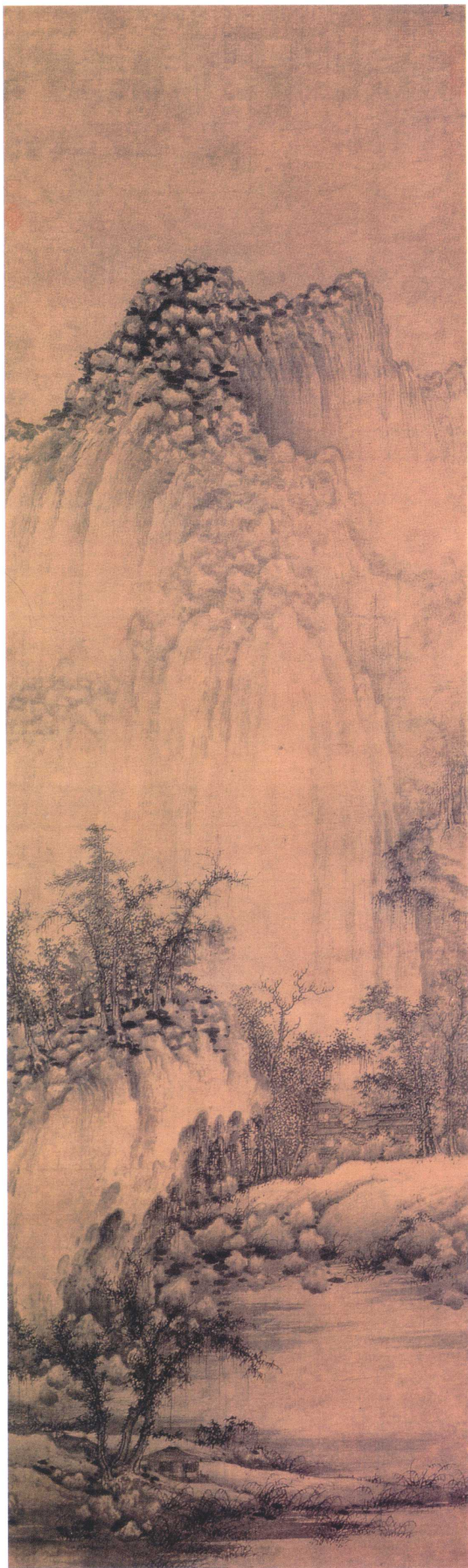
巨然 溪山兰若图轴 五代