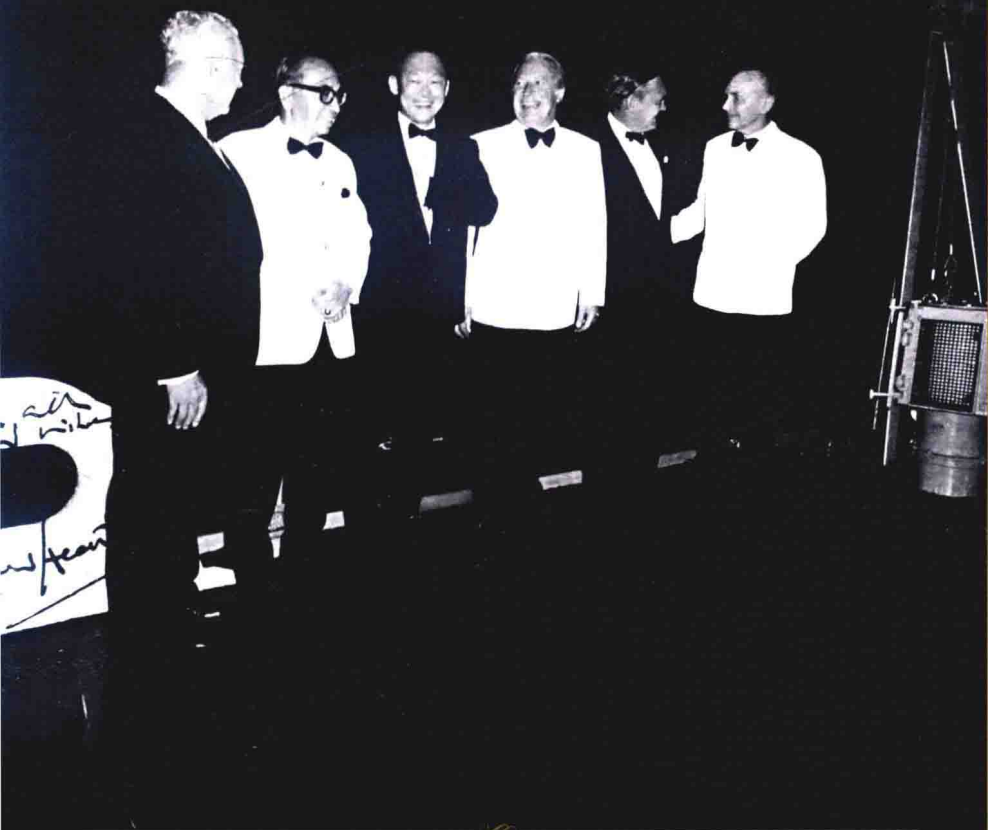
1971年1月16日：共和聯邦政府領導會議在新加坡舉行期間，英國首相愛德華·希斯在英國皇家海軍的無畏號軍艦上設宴款待與會領導人。左起：紐西蘭總理基斯·霍利約克、馬來西亞首相阿都拉薩、我、希斯首相、澳大利亞總理約翰·戈頓和英國外交部長亞利克·道格拉斯-霍姆。