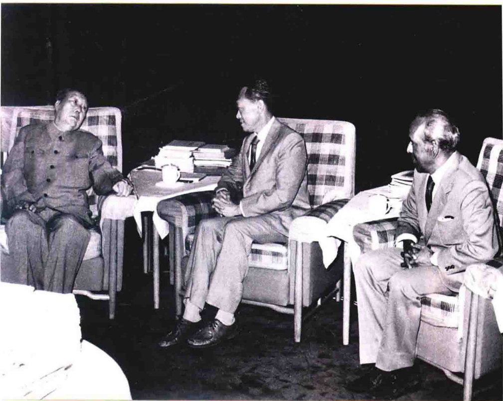
1976年5月：在北京與毛澤東主席（右三）舉行15分鐘會議，列席的還有中國外交部長喬冠華（左起）、總理華國鋒、翻譯員和我的外交部長拉惹勒南。會議地點在北京市西邊中南海的毛主席住家。