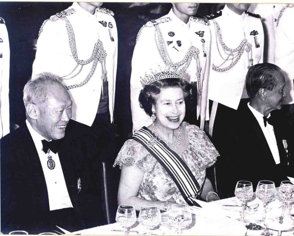
1989年10月10日：在總統府設國宴款待訪問新加坡的英國女王伊莉莎白二世（中）。右為黃金輝總統。