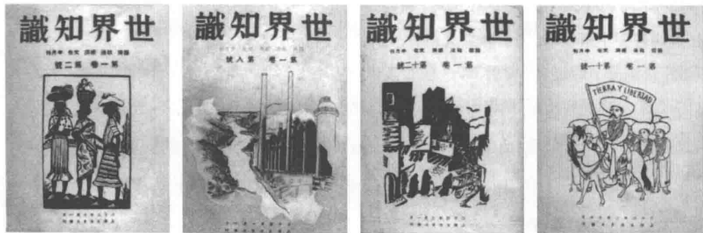
《世界知识》早期封面