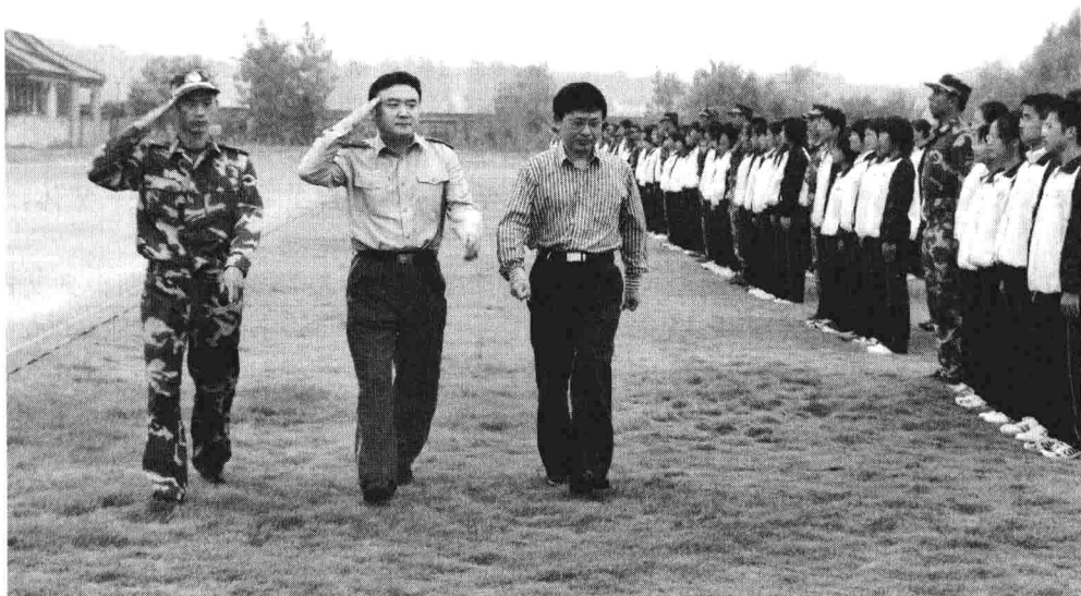
图 1-1 2006 年 9 月 29 日,我(左三)检阅扬州教育学院新生军训队伍

军训是迎接新生的第一堂课,也是新生终生难忘的一段经历。军训是一个锻炼意志、铸造品格的熔炉,你不仅可以给大家留下一个先入为主的好印象,而且可以锻炼自己的各种素质。军训一下子把我们融化在集体之中,有人如鱼得水,有人如履薄冰。2005 年,南京某高校两名女生难以适应艰苦的军训,不约而同地萌生退意,主动要求退学。军训确实很苦很累,新生要注意维护健康。2008 年 8 月 24 日,江苏某高校军训中,材料工程学院一名年仅 19 岁、体重近 150 千克的男生因心脑血管循环系统脆弱再加上过于劳累和心理压力过大,导致猝死,留下了血的教训。