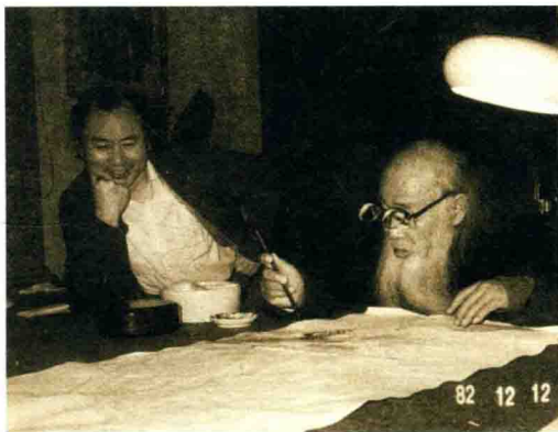
张大千与其子张葆罗