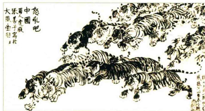
张善孖的《怒吼吧·中国》

张大千生于1899年，为四川内江县人。他本名正权，因家人相信他为黑猿转世，后于上海拜曾熙为师时改名媛，号季爰，后被取“大千”法号。他的父亲张怀忠早年从事教育，后来从政，最后改行盐业。母亲曾友贞，当时也是远近闻名的。家中兄弟十人，自己排行第八，自幼年便在家中学画，十二岁已能画山水花鸟。姊姊张琼枝，也善画，尤其花卉，可惜她在出嫁后因病误服药物去世。二兄张泽亦为画家，号喜好，别号虎痴，以画虎名于世。张大千于19岁奉家长命，与其兄张泽留学日本京都，学习绘画与染织。1919年分别从师于李瑞清、曾熙，学习书法绘画。张大千的人生充满着传奇。他曾说过：“我早年有两件事，对我影响很大：一是被绑匪掳去，受迫为土匪当了师爷一百天；一是出家当和尚，也是一百天！”