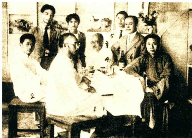
黄宾虹与张善孖等在一起