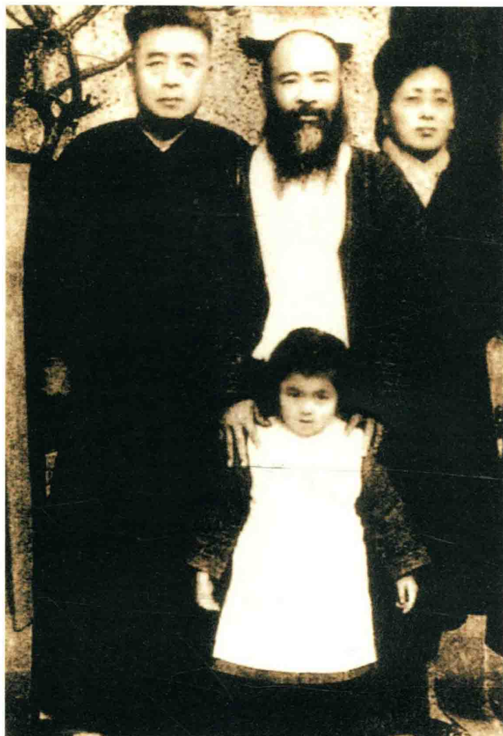
张大千（中）与李秋君（右）、李祖韩（左）合影，1946年摄于上海李家

1929年张大千筹办全国美展，任第一届全国美术展览会干事。1931年与兄张善孖一同作为唐宋元明中国画展代表赴日本。次年，全家移居苏州网师园。1933年，参加巴黎波蒙博物馆主办之中国近代画展，作品《荷花》被该馆购藏。同年应南京中央大学校长罗家伦、艺术系主任徐悲鸿之邀，任中央大学艺术系教授，转年即因觉与自身性格相违而辞职，专事创作。1934年及1936年在北京举办展览。