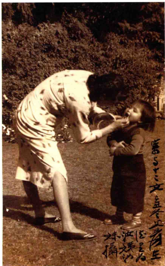
1949年张大千拍摄照片