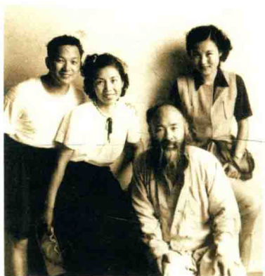
张大千与郁风、黄苗子等