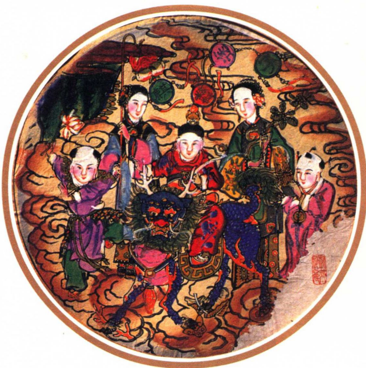
麒麟送子（天津杨柳青）

时明代的插图版画艺术繁荣，促进了民间木刻年画的发展，不少人物画家、画师继承我国人物画的优良传统，创作了不少人民喜爱的作品，有些至今仍存于世。如蒋三松《南极星辉》图、无名氏《三星图》《九九消寒之图》《孝行图》等。清朝是民间年画昌盛时期。由于明朝末年农民李自成、张献忠起义反明，连年战火不息，清兵入关后，用兵扫平“三藩”，人民久经兵灾马祸、流离失所之苦，因此希求社会安定，发展农业以图温饱生活。清朝政府也欲统一天下后，长治久安。康熙皇帝颁布六条“圣训”：“孝顺父母，尊敬长上，和睦邻里，教训子孙，各安生理，毋作非为。”这六条在当时来说，犹如今天的施政纲领，因它切合了百姓愿望，得到了民众的拥护。反映社会生活和人民思想的民间年画，出现了诸如《孝悌皆天性》《友弟重天伦》