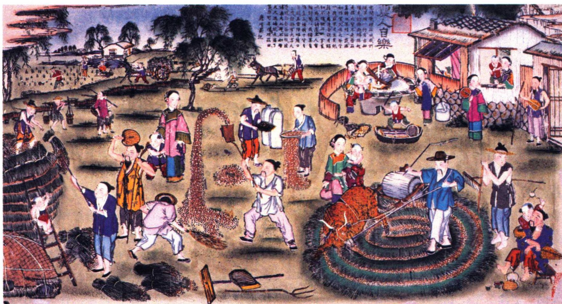
同庆丰年 (天津杨柳青)