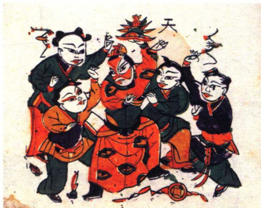
五子夺魁 (河南开封)

(4) 吉祥喜庆类：如麒麟降瑞、天赐黄金、财神叫门、五子登科、丰年吉庆、连中三元、马