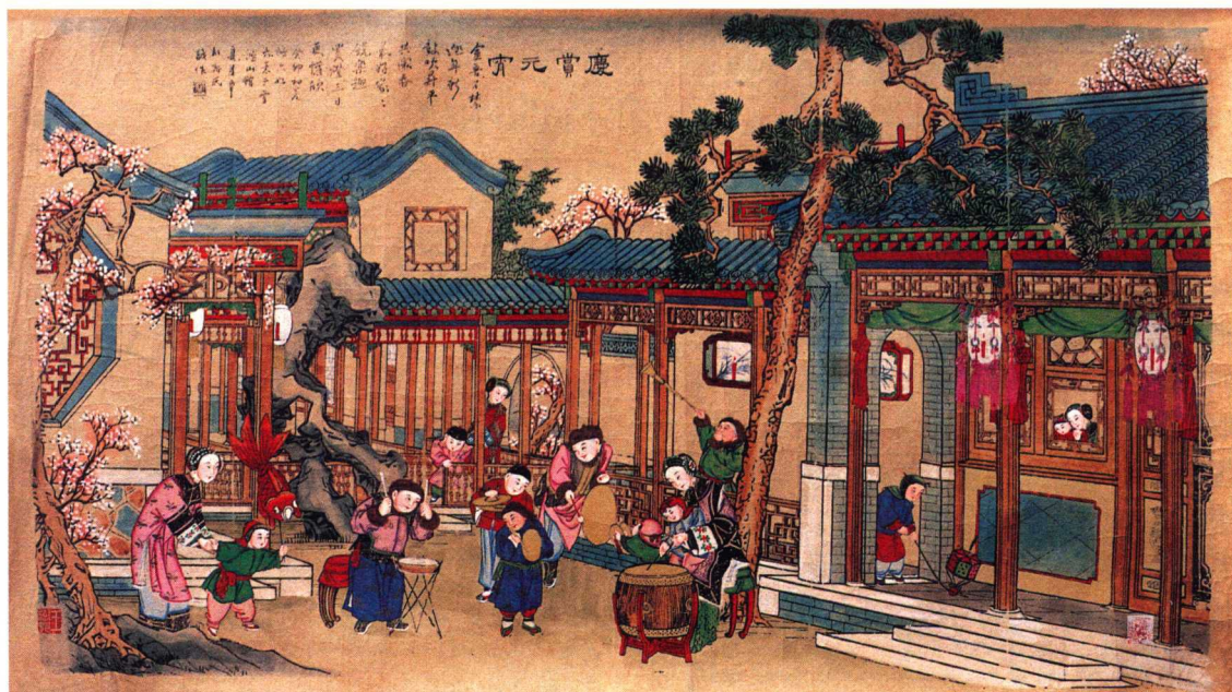
庆赏元宵 (天津杨柳青)