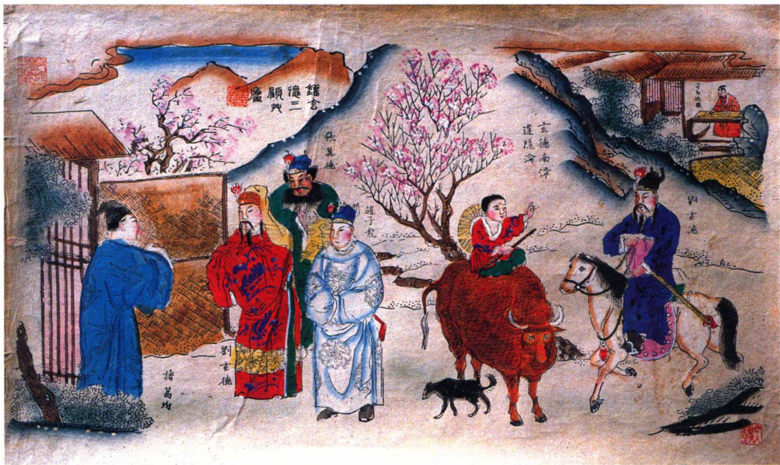
三顾茅庐 (天津杨柳青)

辛亥革命推翻了腐败的封建清王朝，建立中华民国临时政府，选举了孙中山为临时大总统，全国各地同胞无不欢欣鼓舞。反映这次重大变革的辛亥革命年画，陆续在各地作坊绘刻印行。如福建漳州刻印的《革命大戏武昌城》，苏州桃花坞彩印的《上海通商庆贺总统万岁》，山东平度刻印的《炮打南京》，安徽芜湖刻印的《民国军女大元帅攻打北京》，天津杨柳青印绘的《五族共和，南北统一》等，都是歌颂这一次革命推翻了数千年封建专制制度，成为很有时代气息和历史价值的珍品。民国5年（1916）窃国大盗袁世凯称帝后，又有张勋复辟的丑剧出现在北京，接着军阀混战以及日、德在我国山东青岛开战……这些社会不安、人民涂炭的国家大事，在各地民间年画中，一一刻画出来，它充分体现了民间木刻年画艺术的高贵价值。辛亥革命前，曾有进步人士彭翼仲在《京话报》上提倡