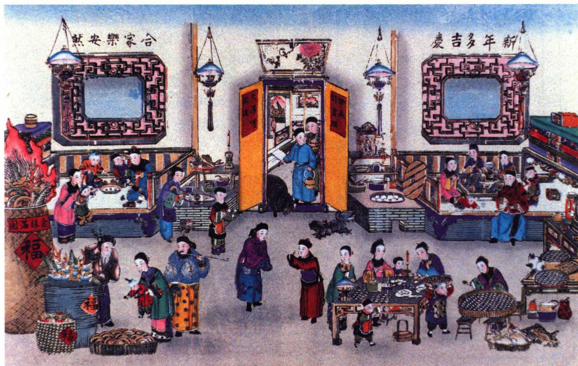
新年多吉庆，合家乐安然 (天津杨柳青)