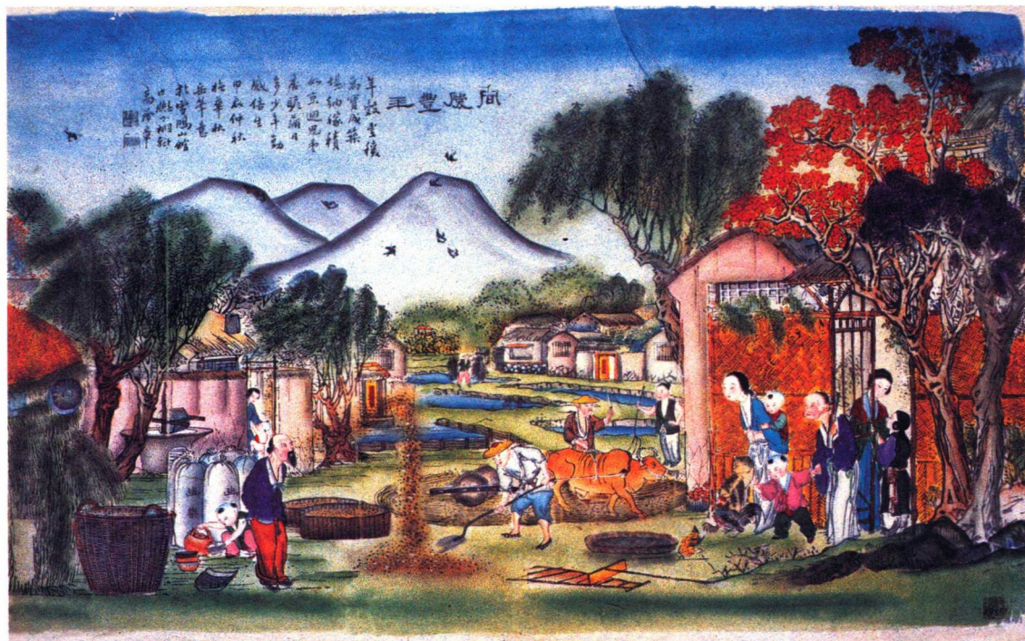
丰收图 (天津杨柳青)