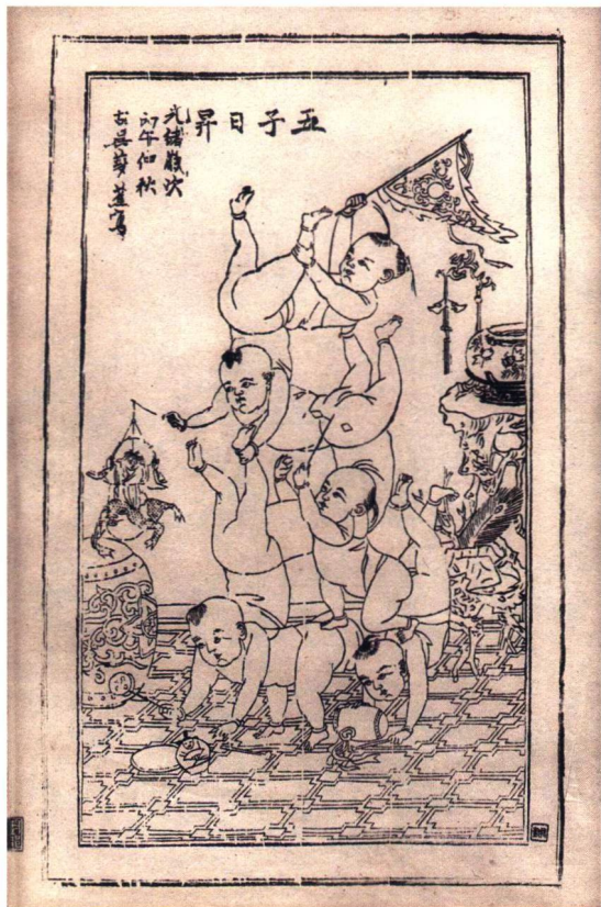
五子日升 (江苏苏州)

(2) 历史故事类：如岳武穆精忠报国、三战吕布、郭子仪祝寿、文王访贤、窦燕山教子、昭君出塞、孟母迁居、薛仁贵别窑、吕蒙正赶