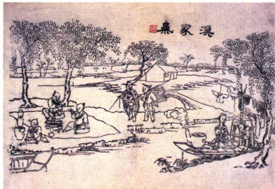
渔家乐 (天津杨柳青)