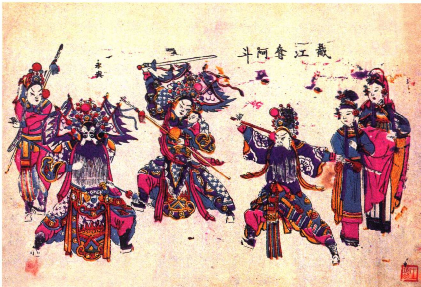
截江夺阿斗（山东潍坊）

城乡弃农经商的地主大户不断涌向新开辟的商埠，因此买卖财富，发财还家的年画大量出现。如山东潍坊印刻的《人财两旺》《黄金万两》《元宝成山》都说明了发财致富的思想要求，它代替了过去《五谷丰登》《渔家欢乐》等题材。此时人民大众喜爱的通俗小说和神话与传说人物的题材，仍是年画作坊不断翻刻的画样，如《三国演义》《杨家将》《说岳全传》以及《麒麟送子》《群仙祝寿》《三星高照》等，各地年画中都曾反复出现。再有就是东南沿海一带的人们，曾随船漂洋过海到域外经商谋生，但他们并未隔断故土乡情。为了使海外侨胞新年与故乡亲友共度良辰，广东佛山、潮州，福建泉州、漳州，广西南宁等地区的年画店，印制了具有乡土民俗气息的“纸马” ⑧ （功德纸），供当地和海外同胞新年时祛灾祈福之用。它虽然在过去曾作为一种焚化或弃置在路旁桥头的祛灾之物，但仍不失其为过年时出现的木刻版画之品类。像广西南宁的《驱邪获福之巫符》，广东佛山《接