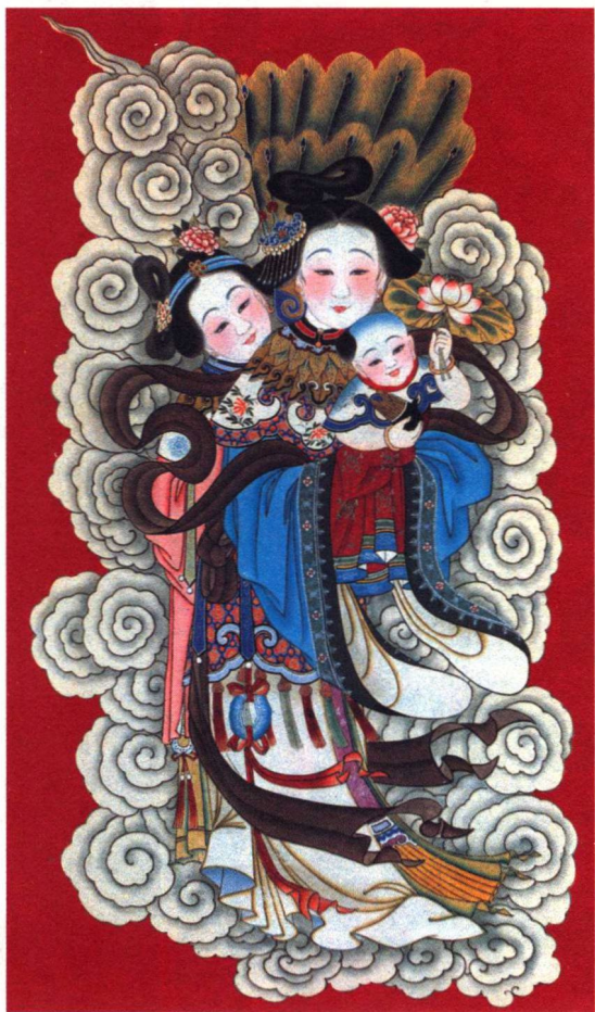
天仙送子 (天津杨柳青)