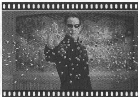
图 1-1-2 黑客帝国3:矩阵革命

2003年上映的美国电影《黑客帝国3:矩阵革命》(图1-1-2),导演创造性地使用了“子弹时间”的特效效果,尼奥灵巧躲避呼啸而来的子弹。子弹时间是一种使用在电影和电脑游戏中,用计算机辅助的摄影技术模拟变速特效,如强化的慢镜