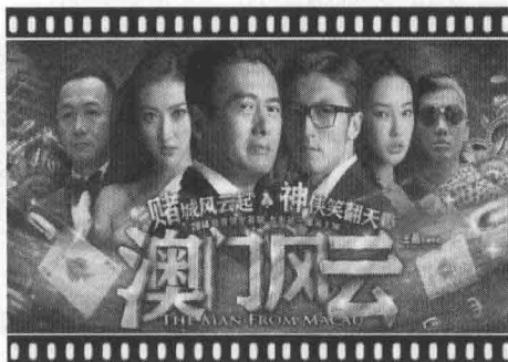
图 1-1-1 澳门风云

“赌神”是周润发(发哥)创造的一个经典银幕角色,这次他与新生代影星谢霆锋等,共同演绎两代赌神的风采。人比子弹快,这是不少枪战电影不可或缺的经典桥段,发哥同样以潇洒的身手躲开射来的子弹(图 1-1-1)。