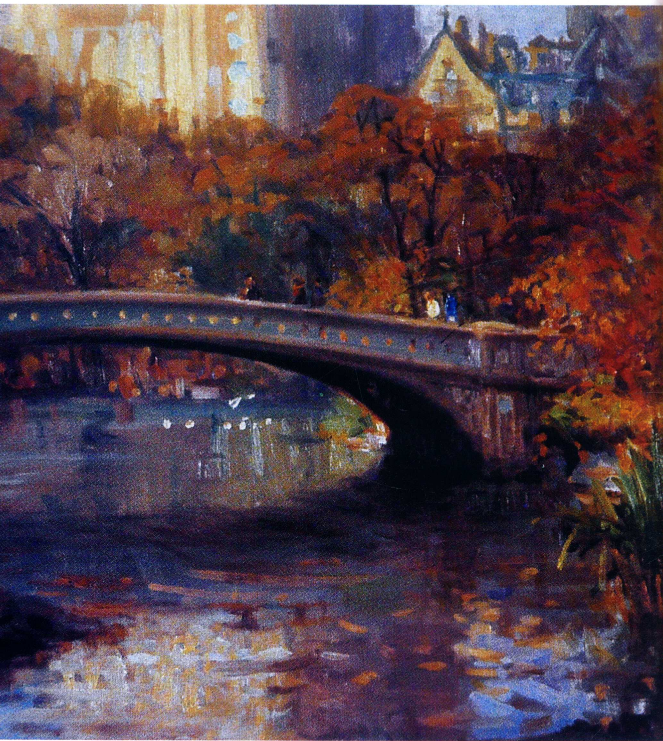
《虹桥》 乔·阿布里亚作品