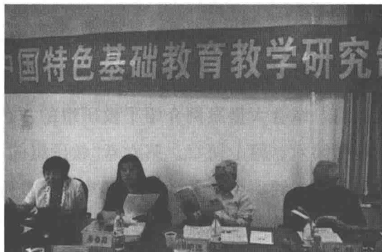
图2 2012年“中国特色基础教育教学研究制度创新研究”开题论证会

累了丰富的一手资料(如图2所示),对中国特色教研组的建设规律有了一定的了解和把握,并汇集成《夯实基础——中国特色教研组建设》一书。