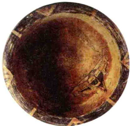
○ 名称：人面鱼纹 时间：仰韶文化 规格：高16cm

新石器时代早期窑床简陋，甚至平地起烧，所以窑床很少有被发现。到了中期，发现结构比较简单的横穴窑和竖穴窑，直至火膛、火道、窑室结构完备的陶窑。这些表明，到了新石器时代的中期，已在控制火焰气氛、温度方面取得了一定的经验，为早期青瓷的诞生准备了条件。新石器时代晚期，以植物作为燃料，温度达到了制瓷的需要，这就为早期青瓷的出现进一步准备了条件。根据对新石器时代陶片的