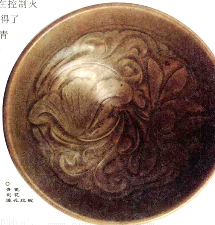
○ 青瓷 刻花 莲花纹碗

陶器是随着史前人类进入定居生活而出现的。我国现存最早的陶器残片距今约9000-10000年，出土于南方一些洞穴居住遗址中。制陶的发明与人类开始使用火有密切的关系。