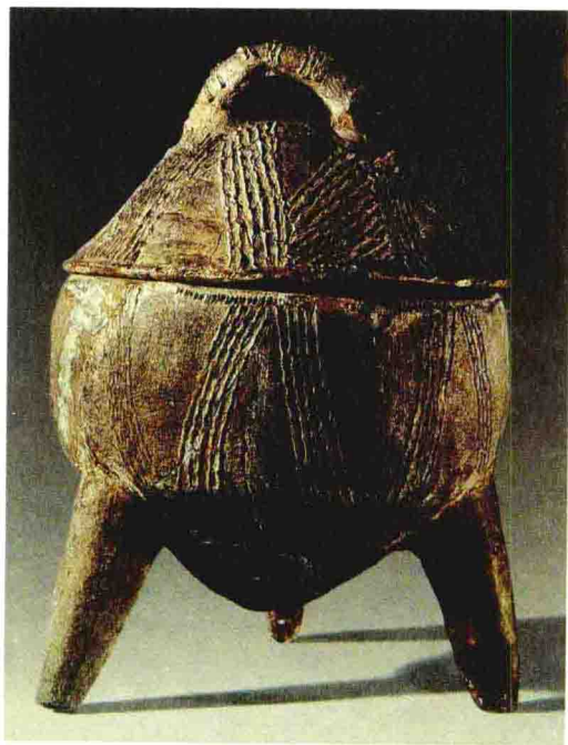
名称：带盖陶鼎 时间：北辛文化（前5000—前4000） 规格：通高37.5cm

陶器是随着史前人类进入定居生活而出现的。我国现存最早的陶器残片其年代距今约9000—10000年，出土于南方一些洞穴居住遗址中。制陶的发明与人类开始使用火有密切的关系。史前人类用火烧烤食物、取暖、趋赶野兽，发现被火烧过的土地或粘土变得坚硬定型，这些促使原始先民有意识的用泥土或粘土烧制他们需要的器物。