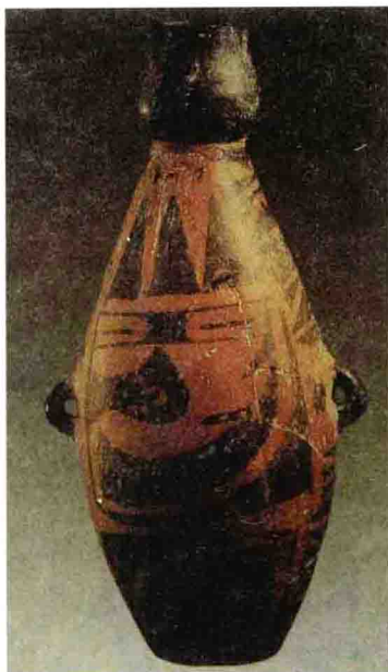
名称：人面鱼纹葫芦瓶 时间：仰韶文化 规格：高29cm