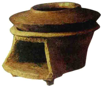
名称：红陶釜、灶 时间：仰韶文化 规格：釜高10.9cm 灶高15.8cm