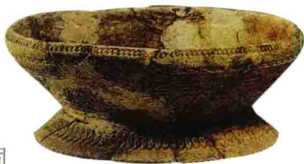
名称：印纹白陶盘 时间：大溪文化 规格：高7.5cm

器表加工有“表面磨光”和“涂釉陶衣”两种方法。表面磨光，是在陶坯未完全干燥时，用骨、石等坚硬光滑的工具对陶坯表面进行同一方向的打磨，使粘土颗粒顺同一方向排列并具有暗淡的光泽。这种修饰手法不仅使器物美