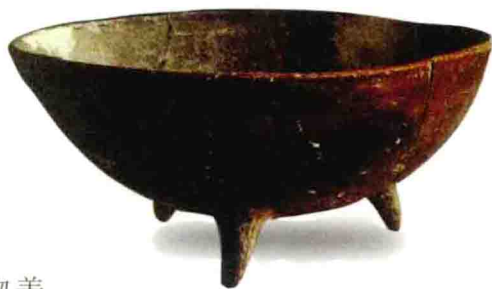
名称：彩陶三足钵 时间：大地湾文化 规格：高12.5cm

陶器是随着史前人类进入定居生活而出现的。我国现存最早的陶器残片距今约9000-10000年，出土于南方一些洞穴居住遗址中。制陶的发明与人类开始使用火有密切的关系。