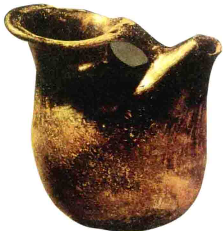
名称：陶盃 时间：河姆渡文化