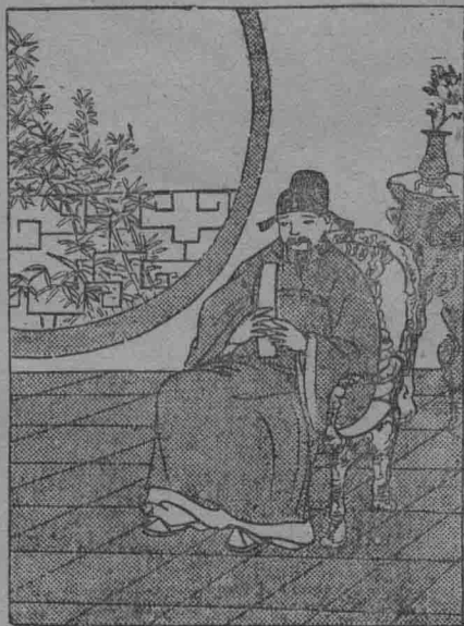
手裏執着上朝用的手版