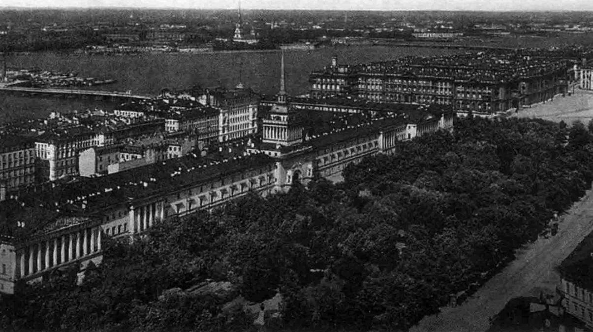
20世纪初的彼得格勒