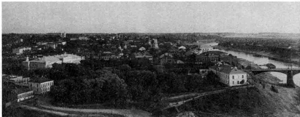
1912年，俄国维捷布斯克全景。

布尔什维克组建他们自己的内阁。尼古拉斯·列宁任总理，里昂·托洛茨基做外交部长 ① 。二月革命之后，他们的上台已经不可避免。这几乎立即就成为一件显然的事。经过那次革命，布尔什维克的历史就是他们稳步壮大的历史。