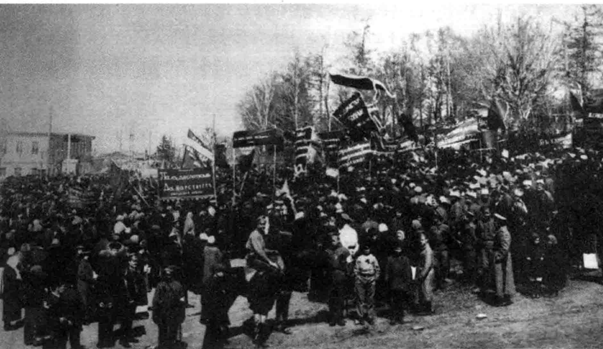
1917年，矿业小镇库什瓦的有组织示威。

五、俄国社会民主工党： 该党原本奉行马克思的社会主义。1903年的党代会上，该党因策略问题分裂为两个派别——多数派（布尔什维克）和少数派（孟什维克）。两派的名称也正来源于此。布尔什维克是“多数派成员”的意思，孟什维克则表示“少数派