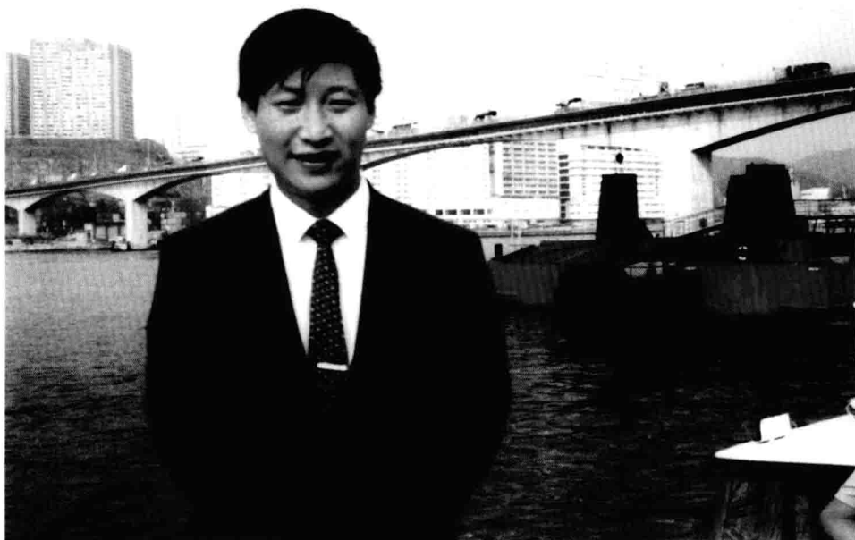
Xi Jinping, então vice-prefeito de Xiamen, província de Fujian, em visita ao exterior.