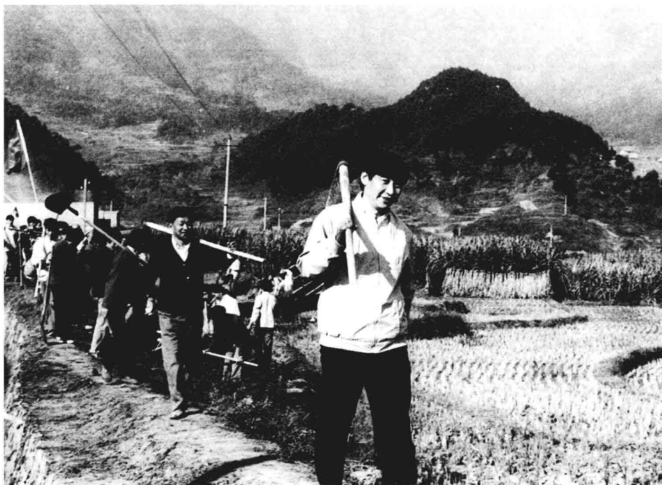
1989, Xi Jinping, então secretário do Comitê do PCCb na sub-região de Ningde, província de Fujian, em trabalho no campo.