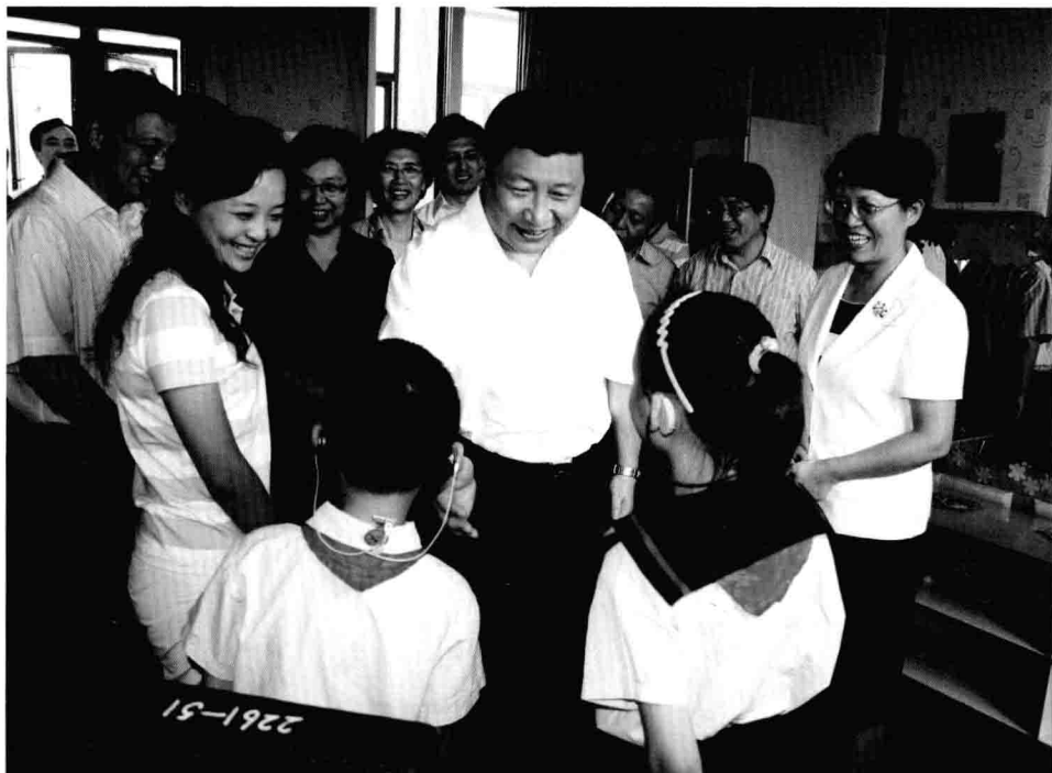
Em setembro de 2007, Xi Jinping, então secretário do Comitê do PCCb no município de Shanghai, conversa com estudantes portadores de deficiência auditiva da Escola Qiyin, no bairro Minbang, em Shanghai.