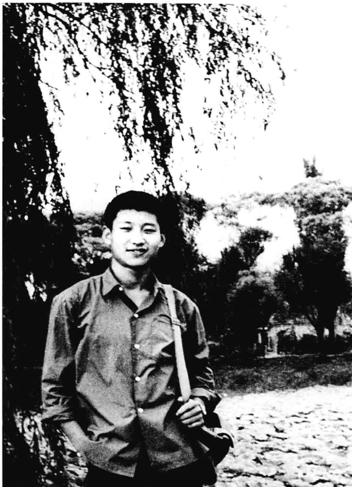
1972, Xi Jinping regressa a Beijing para visitar parentes quando trabalhava no campo como jovem instruído.