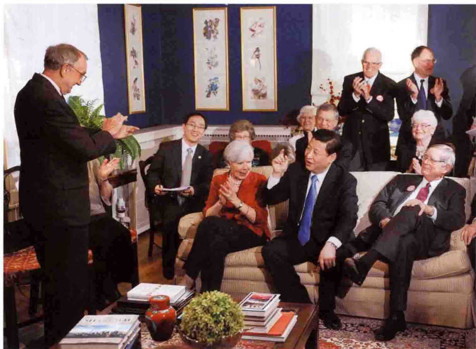
Em fevereiro de 2012, Xi Jinping, então vice-presidente da China, visita a família de um velho amigo norte-americano no Estado de Iowa. Eles se conhecem há 27 anos, desde a primeira visita de Xi Jinping aos EUA.