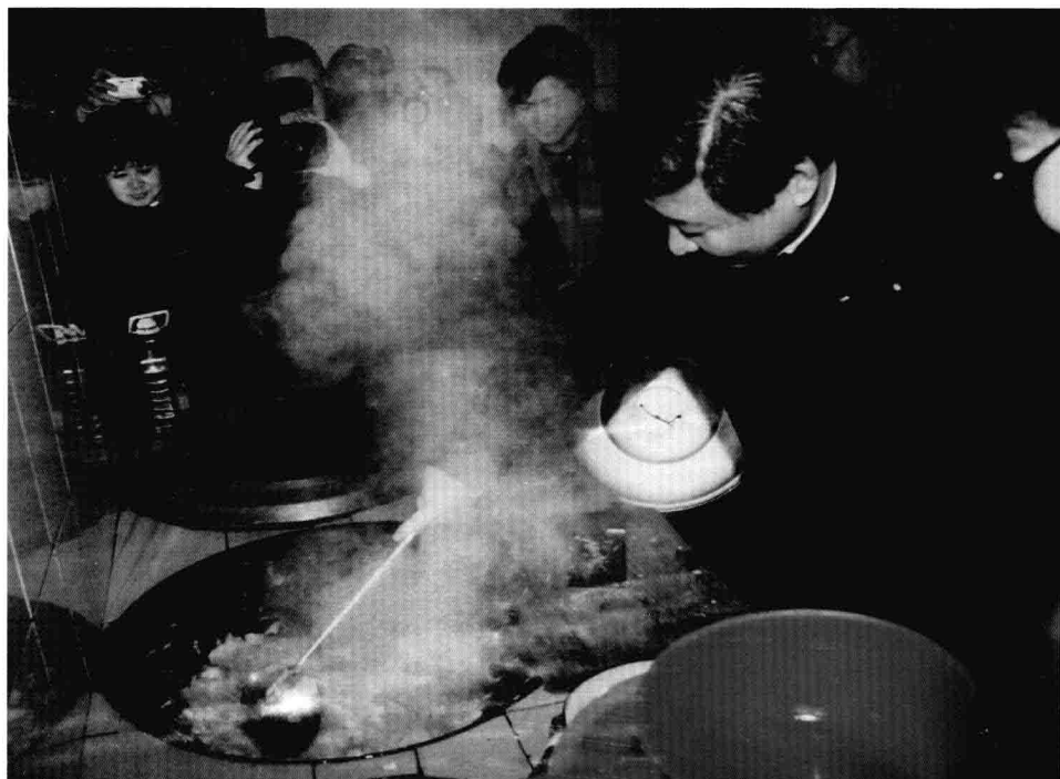
Em janeiro de 2007, Xi Jinping, então secretário do Comitê do PCCb na província de Zhejiang, cozinha para idosos numa casa de repouso em Pingdu, no distrito de Qingyuan, província de Zhejiang.