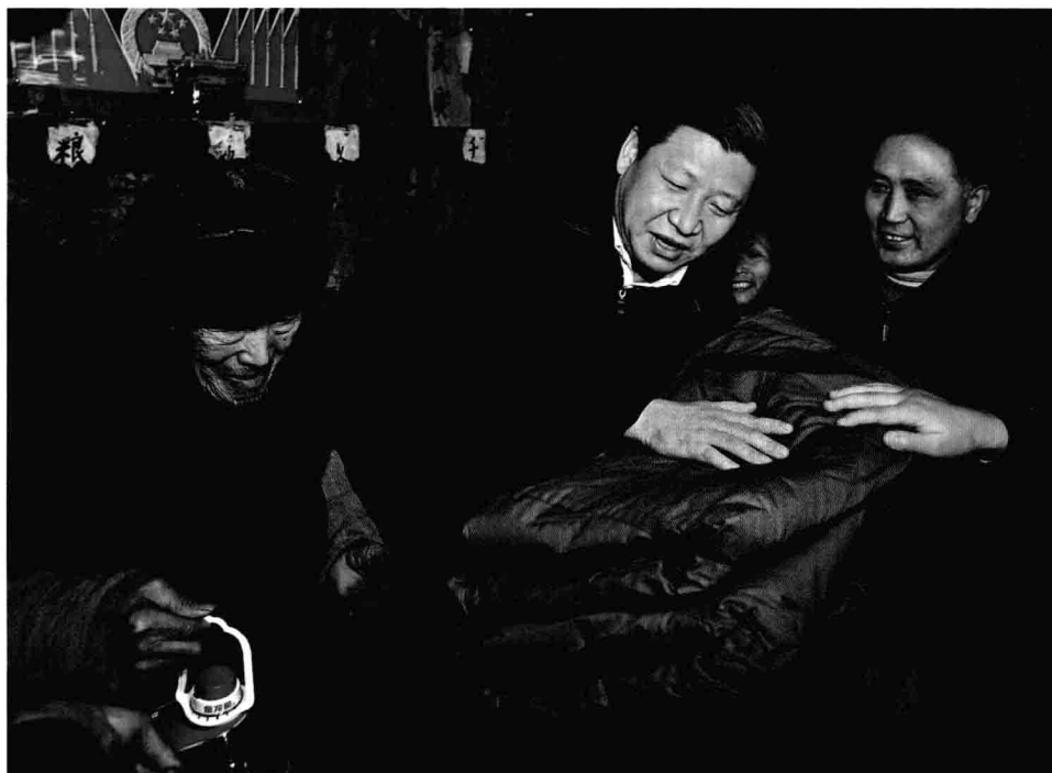
Em janeiro de 2008, Xi Jinping, então membro da Comissão Permanente do Biro Político e do Secretariado do Comitê Central do PCCb, visita a família de Tang Zhaowei, da etnia dong, que sofreu perdas durante uma tempestade de neve, na aldeia de Laoshankou, no distrito de Wanshan, província de Guizhou.