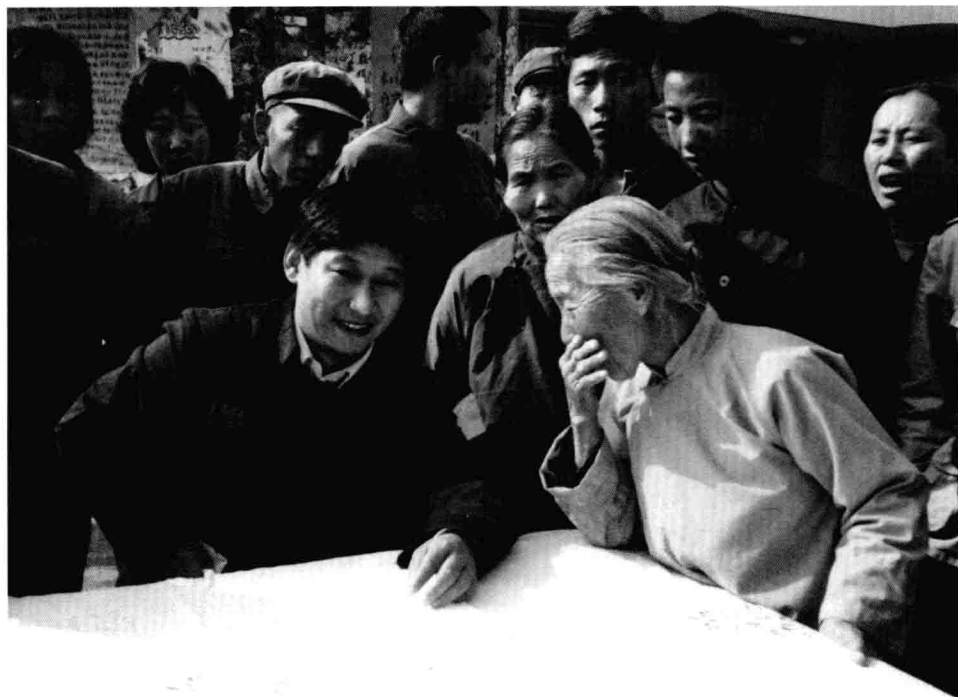
1983, Xi Jinping, então secretário do Comitê do PCCh no distrito de Zhengding, província de Hebei, ouvindo opiniões dos habitantes numa mesa improvisada na rua.