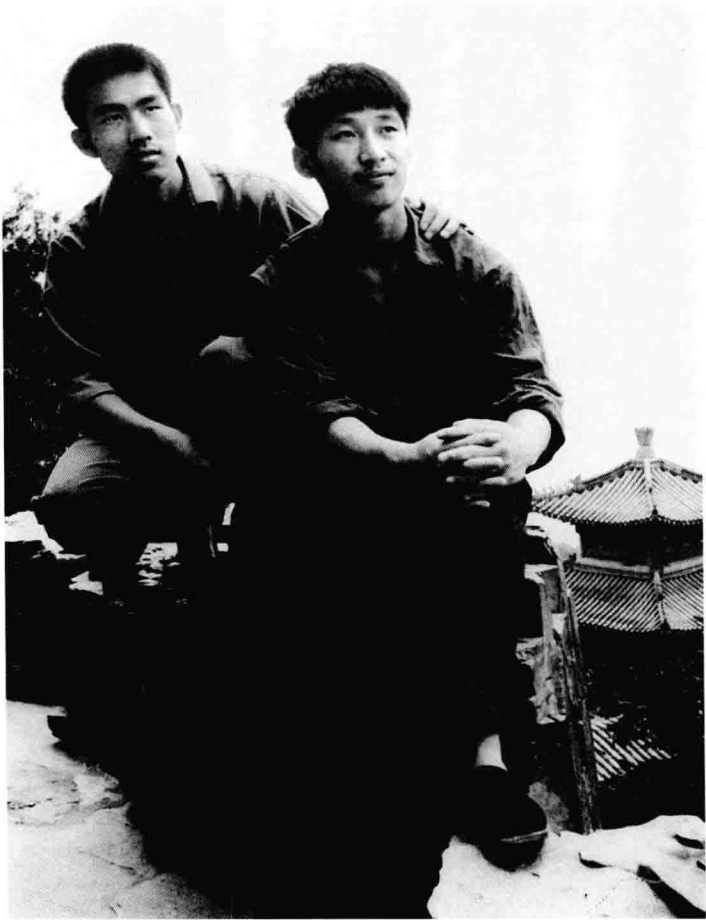
1977, Xi Jinping quando era estudante universitário.