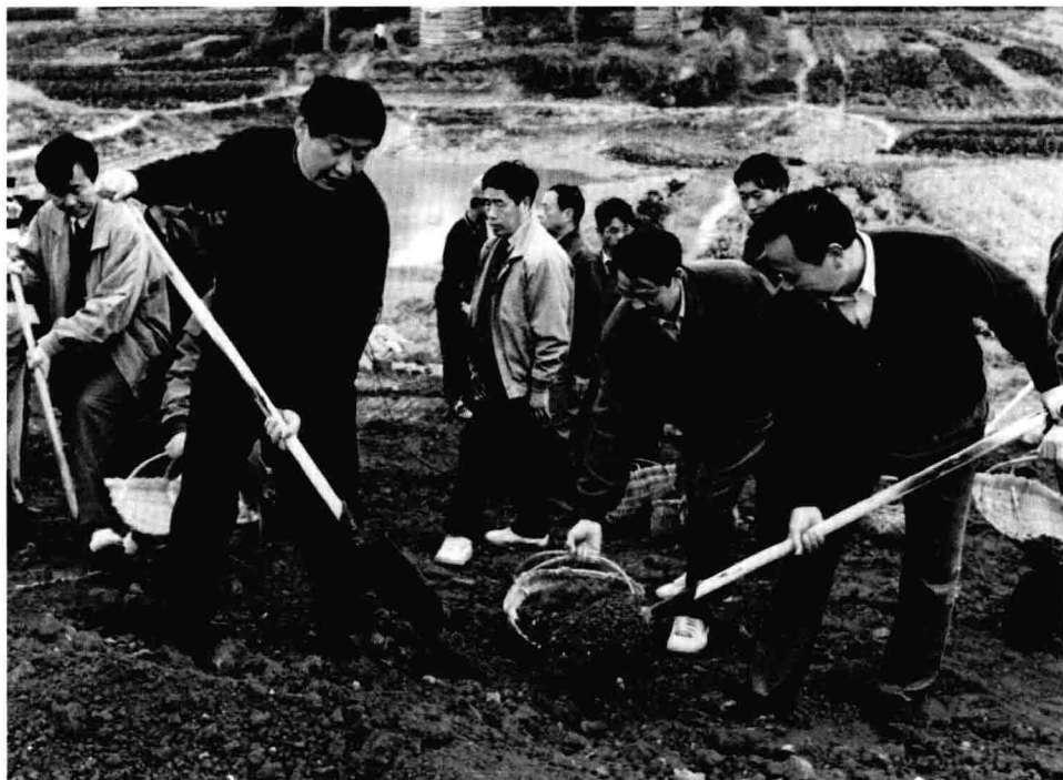
Em dezembro de 1995, Xi Jinping, então subsecretário do Comitê do PCCb na província de Fujian e secretário do Comitê do PCCb no município de Fuzhou, trabalha numa obra de reforço do dique no curso inferior do rio Minjiang, no distrito de Minhou.