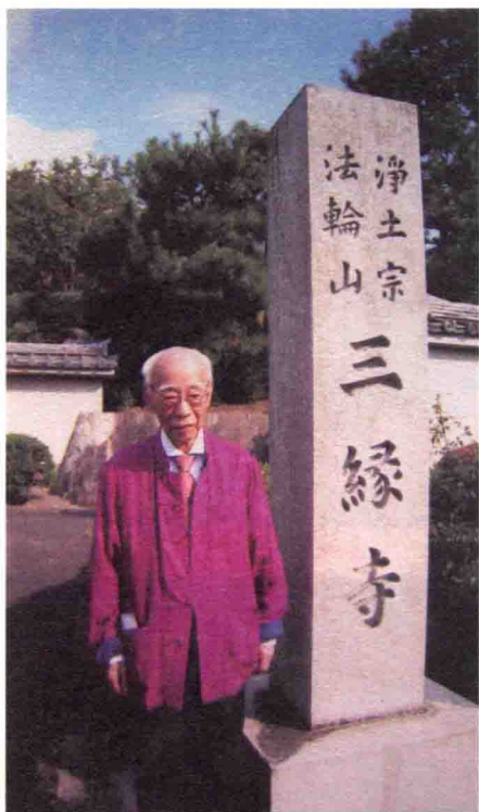
2007年10月25日，饶宗颐教授参观日本三缘寺。