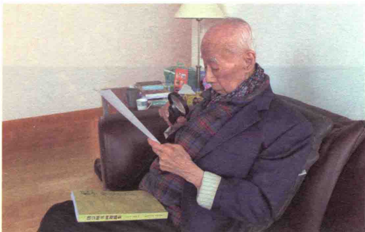
2012年4月2日，饶宗颐教授在审阅《饶宗颐书画题跋集》。