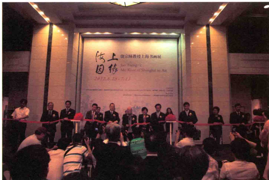
2012年6月28日，在上海美术馆举办“海上因緣——饶宗颐教授上海书画展”。