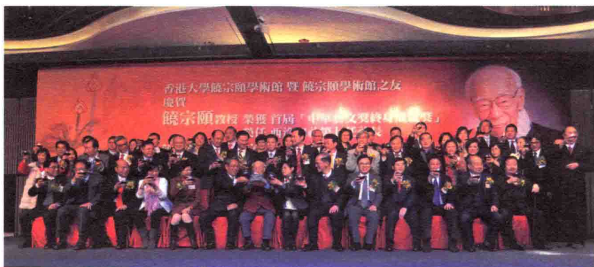
2012年2月28日，饶宗颐教授荣获首届“中华艺文奖终身成就奖”、荣任西泠印社第七任社长、饶学基金成立并香港大学饶宗颐学术馆及饶宗颐学术馆之友会创立八周年庆典仪式上的集体合影。