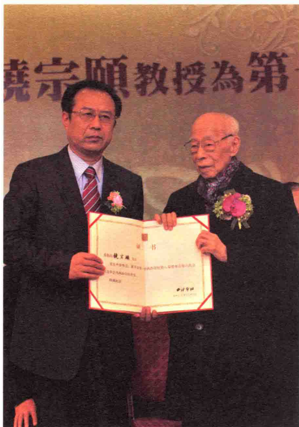
2011年12月16日，西泠印社聘任饶宗颐教授为第七任社长颁证仪式。