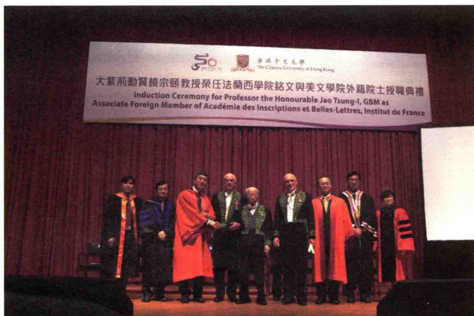
2013年9月19日，饶宗颐教授任法兰西学院铭文与美文学院外籍院士授职典礼。