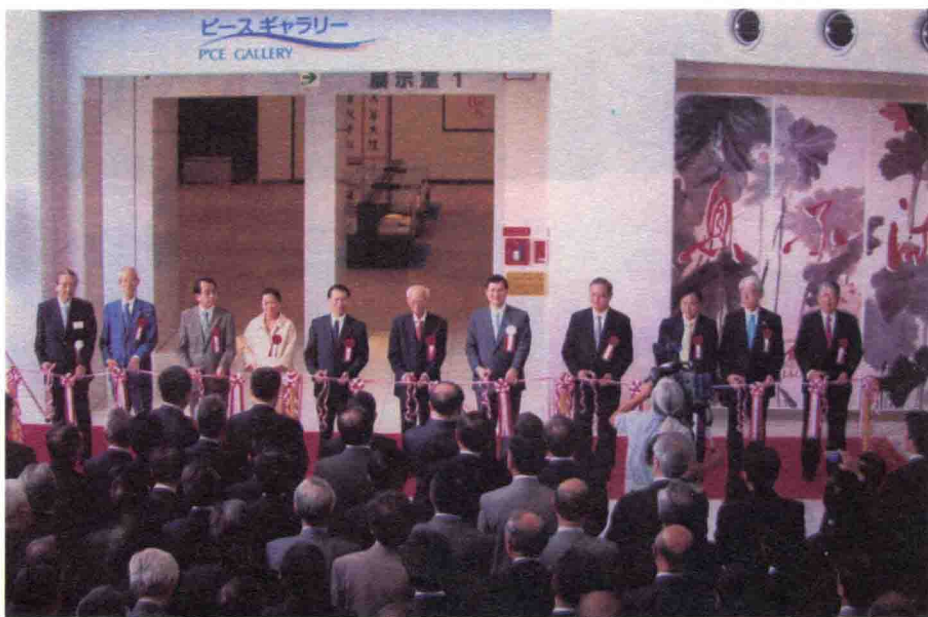
2007年10月25日，在日本兵库县关西国际文化中心展览馆举办“长流不息——饶宗颐之艺术世界”书画展。