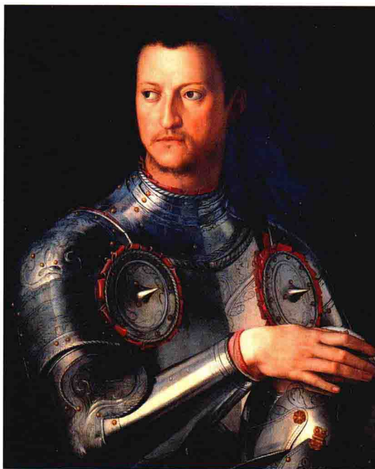
阿尼奥洛·布龙齐诺《科西莫一世肖像》(局部), 1545

乔尔焦·瓦萨里很高明，他沿着法官思路创造了一种建筑结构，既不局促也不夸张，而是一道均匀连接的墙，从一侧围住老宫和朗齐门廊之间的广场，从另一侧围住阿尔诺河上的街廊。此外，在1565年，为了弗朗切斯科一世与奥地利公主约翰娜的婚礼，天才的城市规划专家瓦萨里建了一个小走廊，作为一条横跨阿尔诺河的空中之道路，将封闭在厚重石墙内的中世纪城区延伸到河那边的山岗上，连接起正在兴建的皮提宫，形成了一个新城市。瓦萨里本人曾这样强调过遇到的技术困难：“我从未让人干过这种土木活儿——是在河上打地基，难上加险，几乎房子就在空中！”