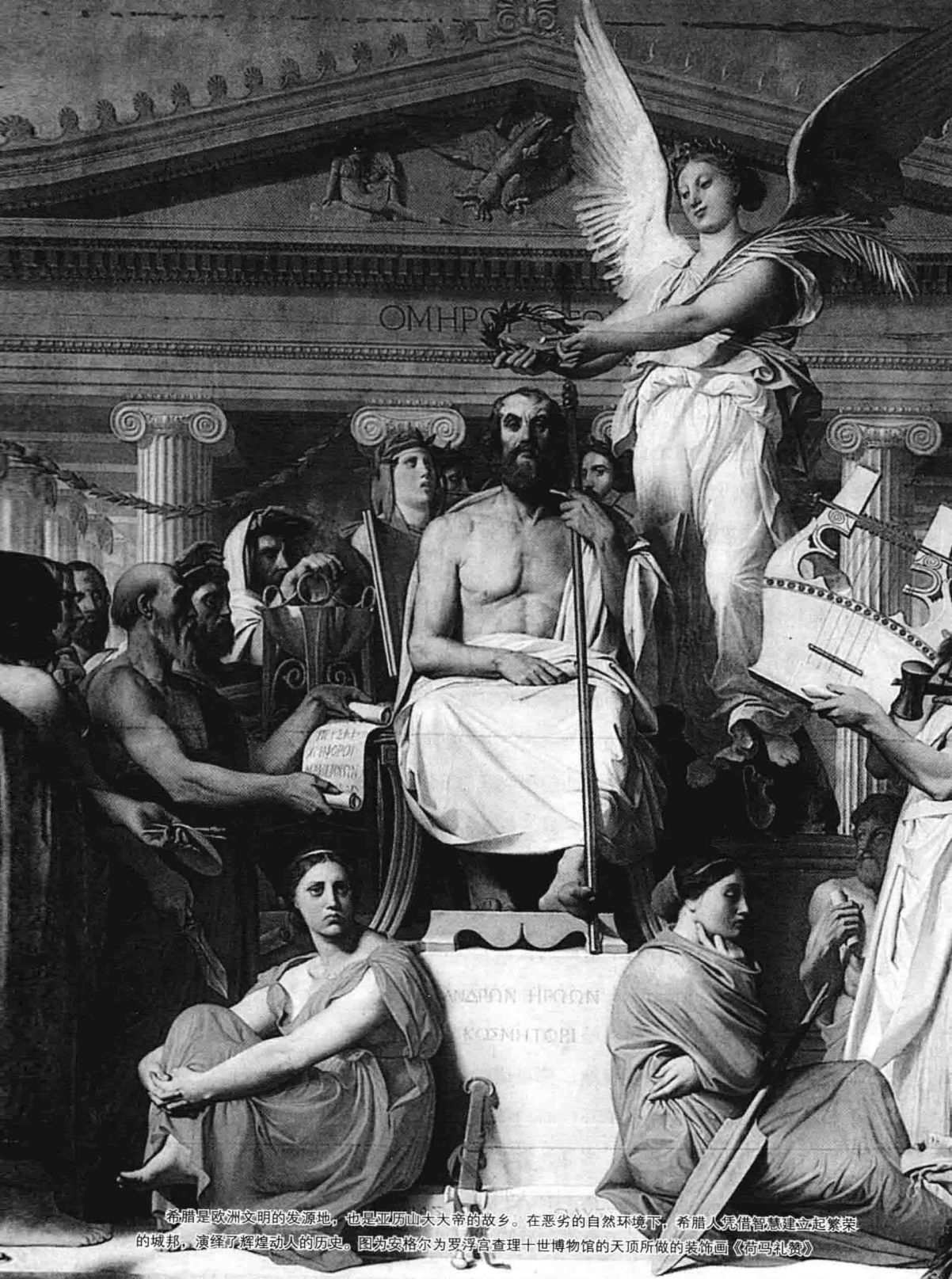
希腊是欧洲文明的发源地，也是亚历山大大帝的故乡。在恶劣的自然环境下，希腊人凭借智慧建立起繁荣的城邦，演绎了辉煌动人的历史。图为安格尔为罗浮宫查理十世博物馆的天顶所做的装饰画《荷马礼赞》

ΕΙΘΕΟΣ ΕΣΤΙΝ ΟΜΗΡΟΣ, ΕΝ ΑΘΑΝΑΤΟΙΣΙ ΖΕΙΣΣΩΝ· ΕΙ Δ' ΑΥ ΜΗ ΘΕΟΣ ΕΣΤΙ, ΝΟΜΙΖΕΣΘΑΙ ΘΕΟΣ ΕΙΝΑΙ·