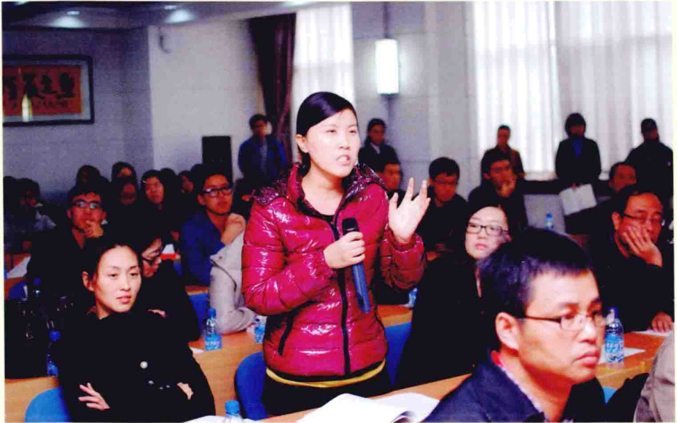
“主题论坛”现场，各界与会者积极发问