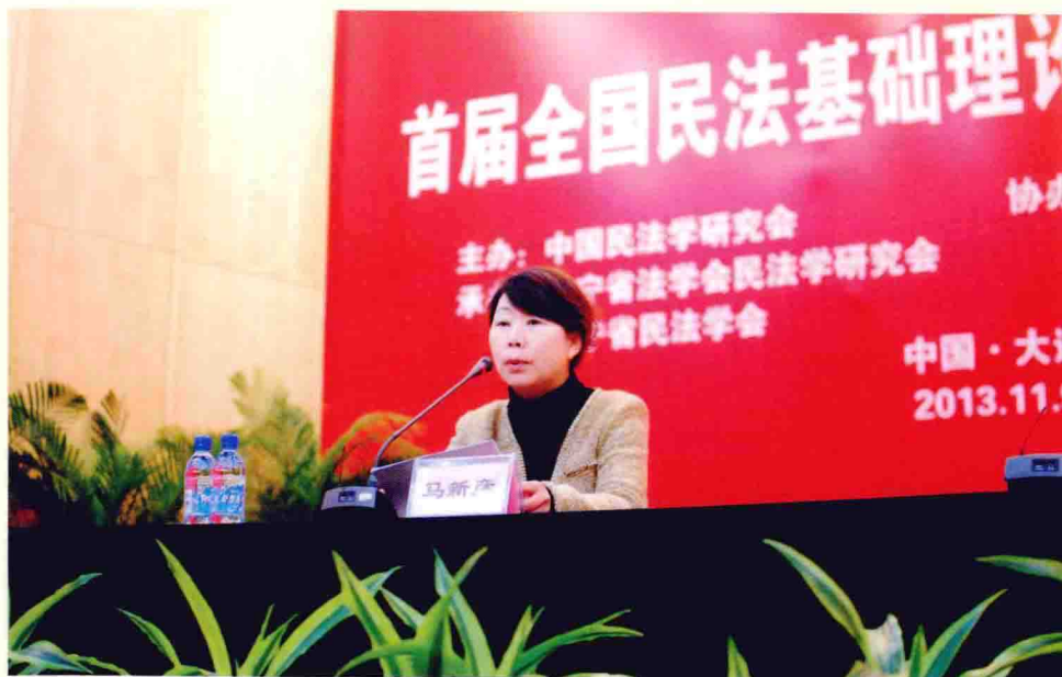
马新彦教授在论坛上作“主题报告”