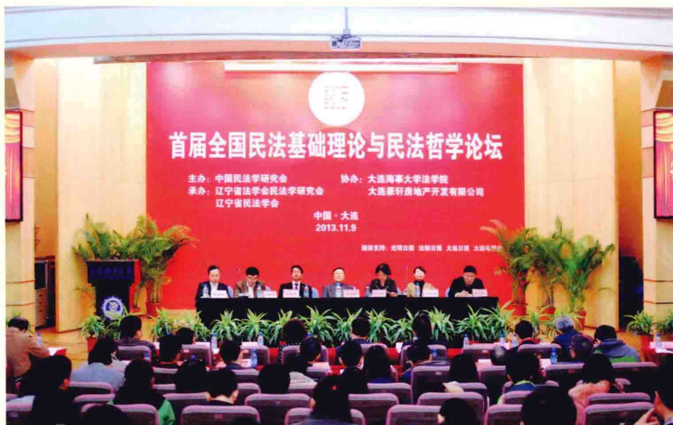
首届“全国民法基础理论与民法哲学论坛”开幕式现场