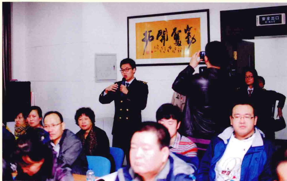
“主题论坛”现场，与会学生踊跃提问