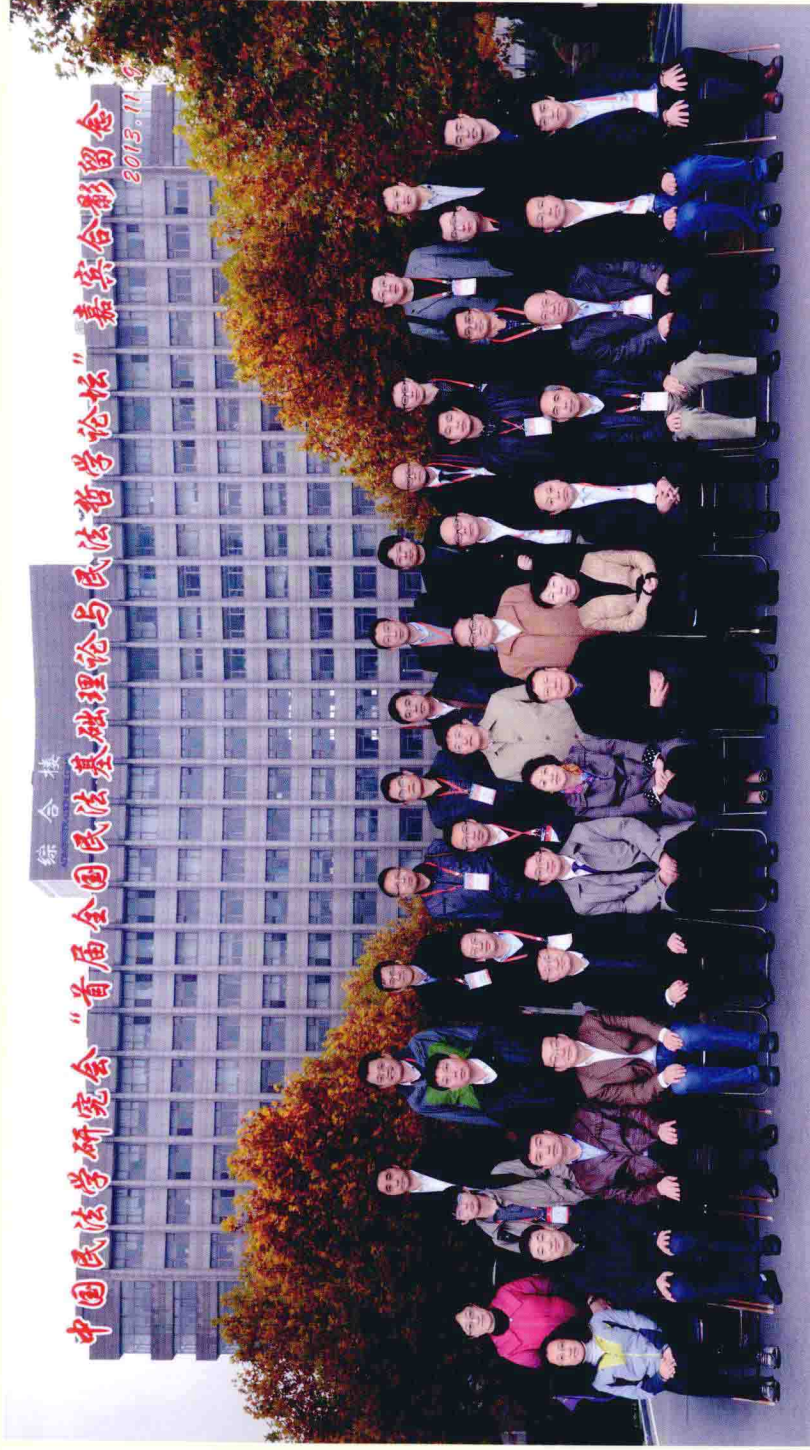
论坛与会学者与有关领导、嘉宾合影