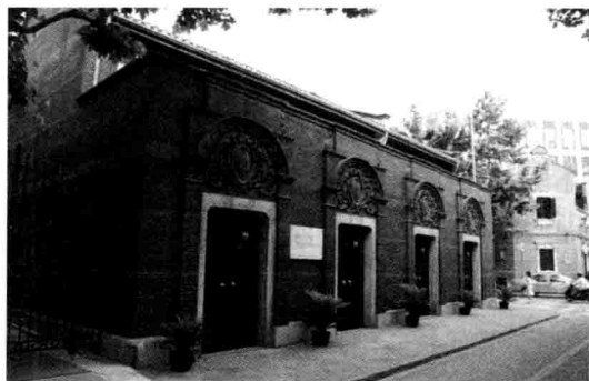
上海兴业路76号，中共一大会址。1921年7月23日，中国共产党第一次全国代表大会在此举行。