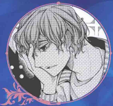
东关 异血人，东莱的哥哥，曾为太空魔佣兵

司城——夜行族人，萧龙学园大学园区优才计划学生 归海——巨人，萧龙学园大学园区优才计划学生 洛里——萧龙学园大学园区学生会会长 百发——萧龙学园大学园区学生 公祖——大学园区区长，萧龙种族人 仲长——109号仓库管理官 空桐——红毛怪医家族分家当家，现空桐医院院长，洛里的父亲