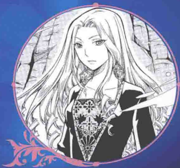
沙狐 黑龙洞里从事走私行当的大当家

空相——空洞的祖父，洛里的太祖父 屯泽——巨人洲一级监狱狱警 沙鼠——巨人洲死岛黑龙洞的引路人 金蝎——沙鼠的孙子 绿面雪狐——灵魂会转世的狐狸，通人性，会说人话 沙狼——黑龙洞招募异血人行当的二当家