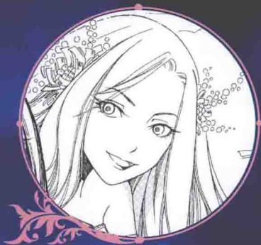
萧非 五千年前统一萧龙星球的女王，现以 由意识塑造的虚假灵魂游荡于世

空相——空洞的祖父，洛里的太祖父 屯泽——巨人洲一级监狱狱警 沙鼠——巨人洲死岛黑龙洞的引路人 金蝎——沙鼠的孙子 绿面雪狐——灵魂会转世的狐狸，通人性，会说人话 沙狼——黑龙洞招募异血人行当的二当家