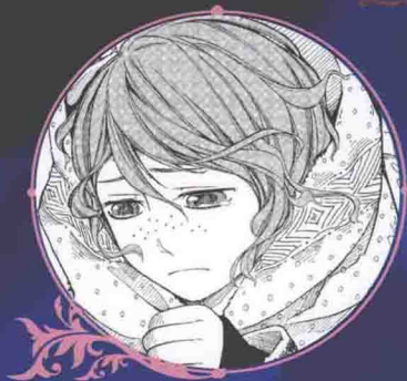
东莱 异血人，东关的妹妹

司城——夜行族人，萧龙学园大学园区优才计划学生 归海——巨人，萧龙学园大学园区优才计划学生 洛里——萧龙学园大学园区学生会会长 百发——萧龙学园大学园区学生 公祖——大学园区区长，萧龙种族人 仲长——109号仓库管理官 空桐——红毛怪医家族分家当家，现空桐医院院长，洛里的父亲