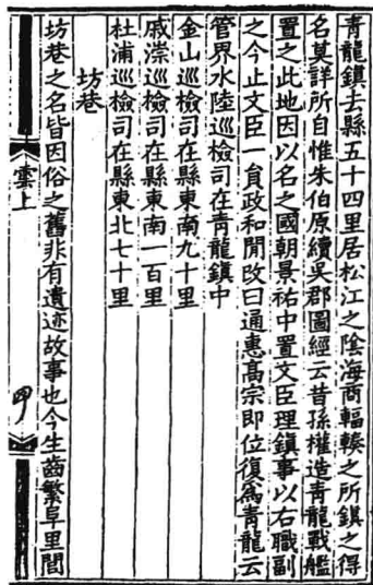
图 1:《绍熙云间志》记载的青龙镇

有关宋代文献记载青龙镇状况的还有《宋会要辑稿》、《吴郡志》、《輿地纪胜》等。《宋会要辑稿》是清代徐松根据《永乐大典》中收录的宋代官修《宋会要》加以辑录而成，全书 366 卷，卷帙浩大，内容丰富，十之七八为《宋史》各志所无，是研究宋朝法律典制和经济状况的重要史料。其中“方域”、“职官”、“食货”等条目均收录了有关青龙镇的状况，尤其“食货”条目将熙宁十年（1077 年）青龙镇上缴的商税数额详细地记录了下来，从而对该镇商业的发达程度有了具体的了解和认识。《輿地纪胜》是南宋中期王象之纂成的一部地理总志，核述严谨，其中简略地提及青龙镇的位置和“海商辐辏”的情况。