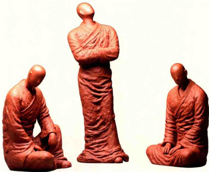
紫砂雕塑·三个影子，作者周刚

古淡为意，与欧阳修和苏东坡父亲苏洵是诗友，他曾怀着对紫砂壶的爱好，慕名到过陶都宜兴，还留下《陶者》诗一首。其次，是梅尧臣的诗友欧阳修《和梅公仪饮茶诗》云：“喜共紫瓿吟且酌，羨君潇潇有余清。”北宋苏轼也有“松风竹炉，提壶相呼”的词句。另外，还有宋人作《满庭芳·试茶词》云：“雅燕飞觞，清谈挥麈，使君高会群贤……轻淘起，香生玉尘，雪溅紫瓿园……”这首宋词，既见于秦观的《淮海居士长短句》，又见于米芾的《宝晋英光集》。