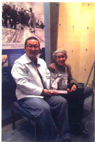
筆者和這張老照片的女主人公 在美國華盛頓海軍總部見面