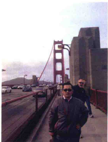
會後與友人在金門大橋有趣合影