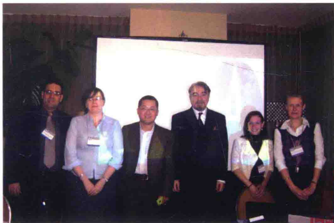
筆者與「後共產國家分會」討論後合影