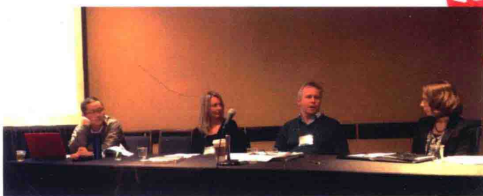
筆者擔任美國國際關係學會國際傳播分會小組會議評閱人。