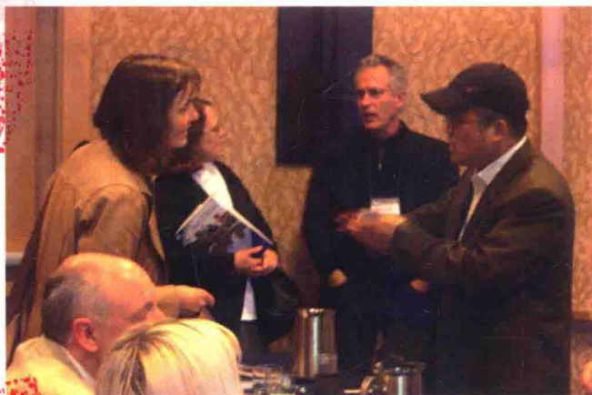
小組會前進行討論。(新媒體和傳統媒體在國內和國際政治和社會關係中所扮演的角色：The Roles of Traditional and New Media in Domestic and International Politics and Social Relations)