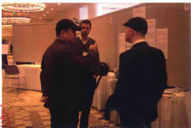
會下與小組會議成員進行交流