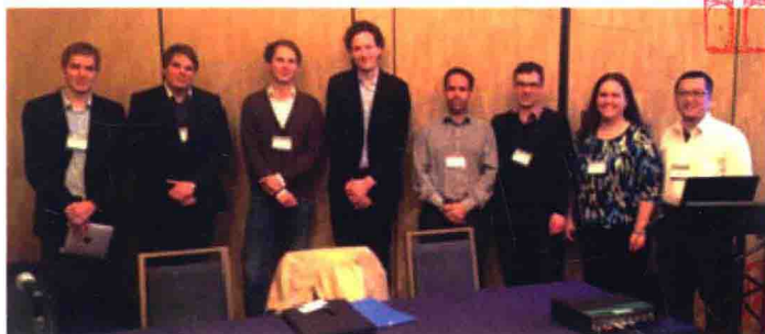
筆者在分會評論來自耶魯大學、倫敦政經學院、柏林大學、波恩大學學者的論文，之後大家親切合影。