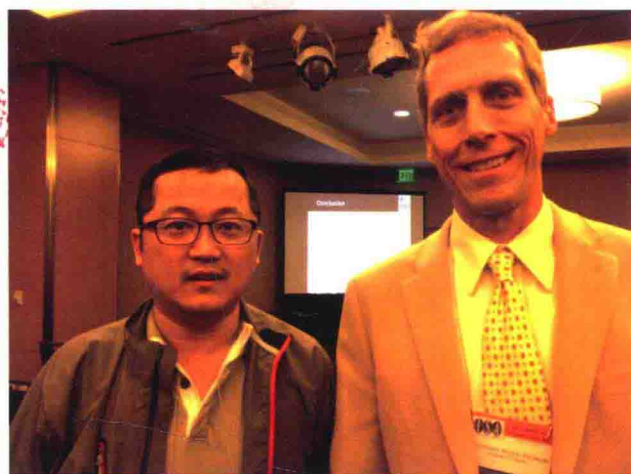
筆者與美國國際關係學會外交分會主席。