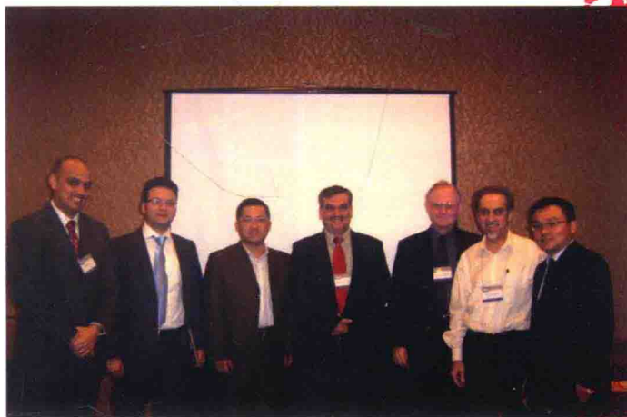
外交政策和全球和平的連結（Exploring the Linkage Between Foreign Policy and the Global Peace）小組會後合影。