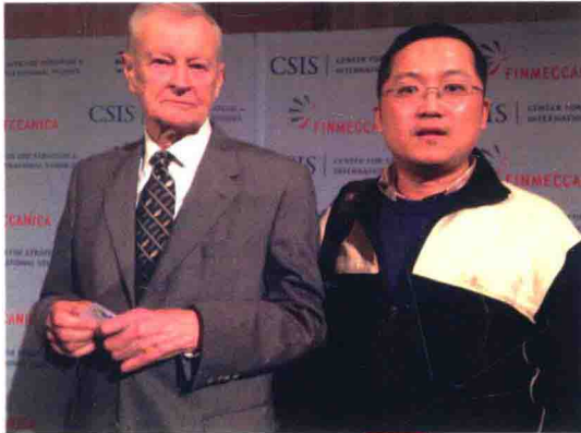
參加美國戰略與國際研究中心的「2012年全球安全論壇」後，與老朋友、CSIS 資深研究員布熱津斯基先生合影。