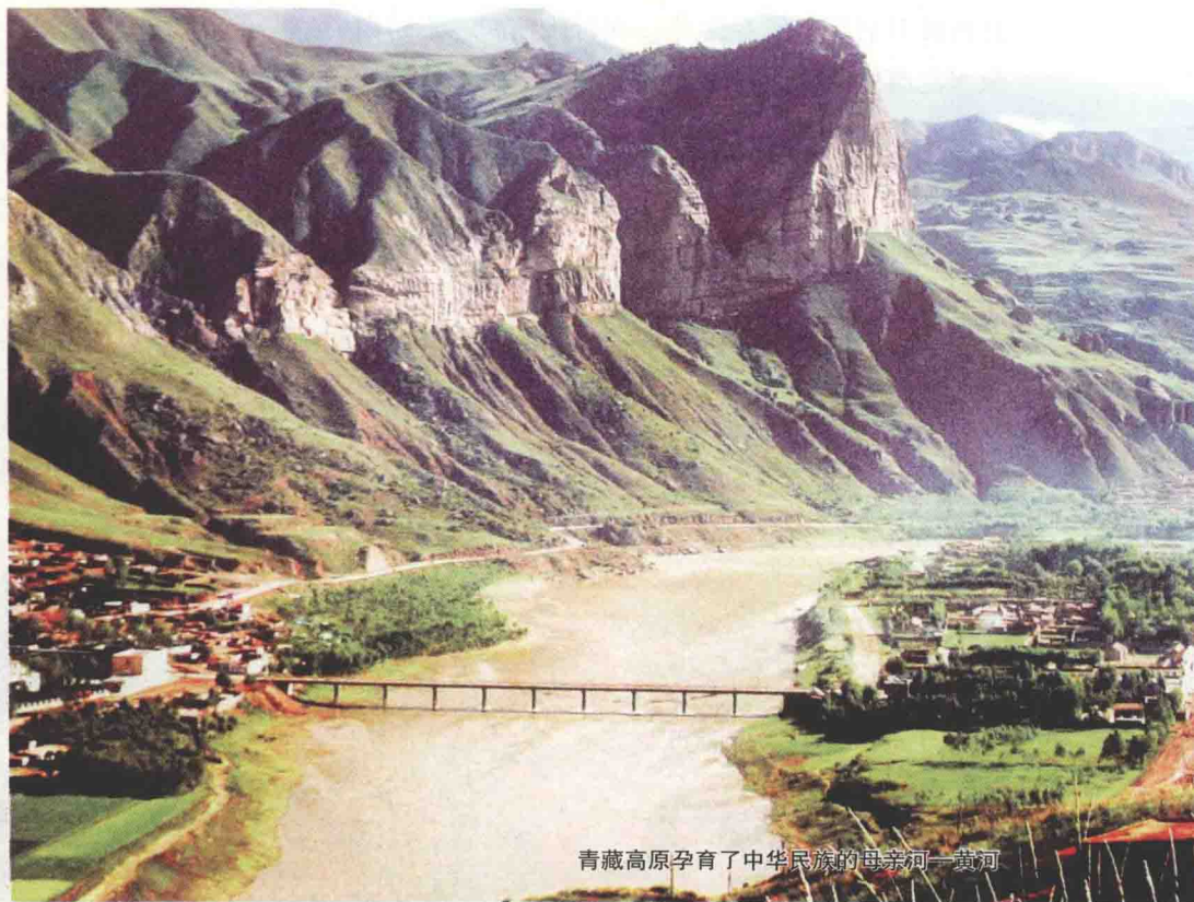
青藏高原孕育了中华民族的母亲河——黄河

胸臆拓展器局，以取得事半功倍的最佳效果，岂不美哉。笔者曾毕十年之功，探寻藏地奥秘，积累的经验与知识，为大家解读疑惑、提供线路资讯，只需携本著一卷，沿所绘线路入藏，即可感受千年古道的变迁、汉藏交好的传承、土司制度的痕迹、母系家族的遗风；领略沿途壮阔神奇的美