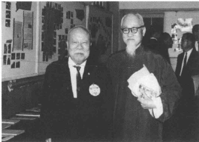
王云五先生（左）与台湾白话文运动推行者蔡培火先生（右）参加基督教青年会艺文活动。