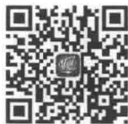
传媒人书店 (For IOS)