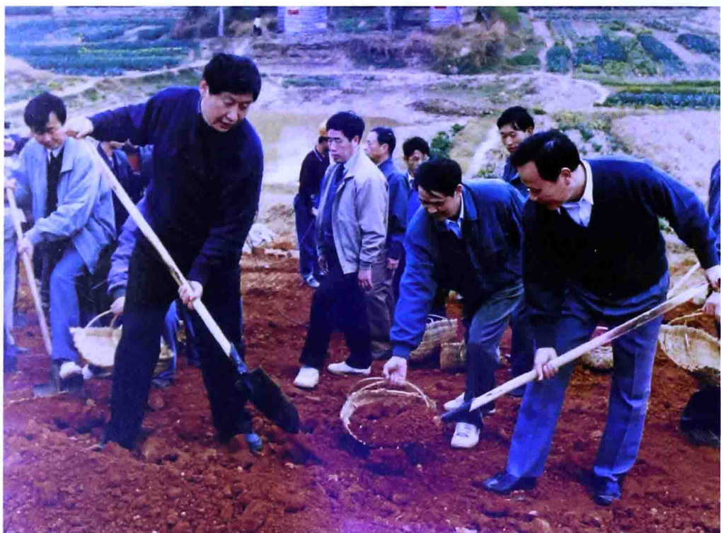
一九九五年十二月，時任福建省副書記、福州市委書記的習近平在閩侯縣參加閩江下游防洪堤加固工程勞動。