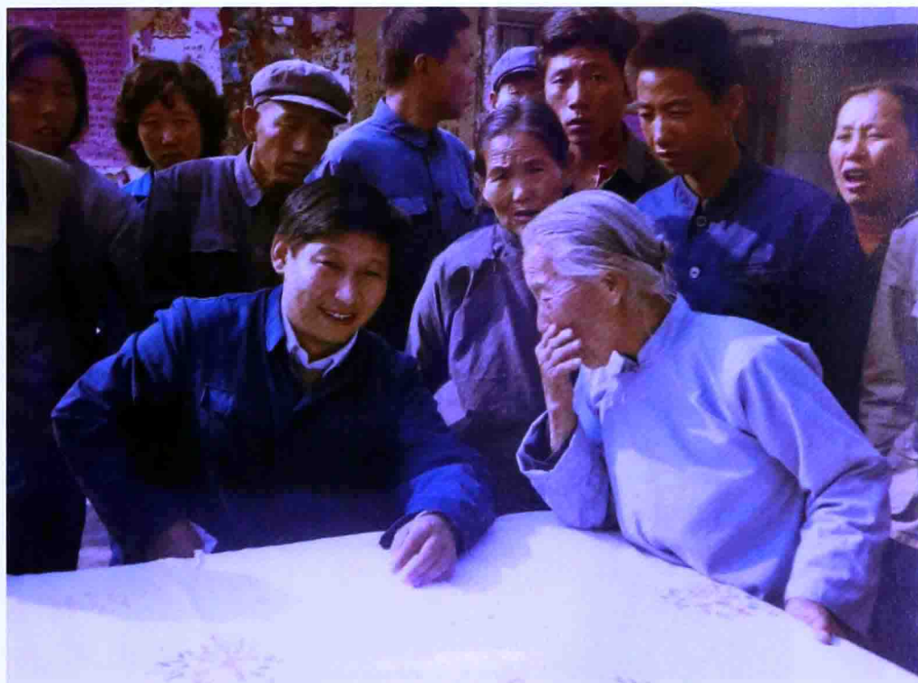
一九八三年，時任河北省正定縣委書記的習近平臨時在大街上擺桌子聽取老百姓意見。