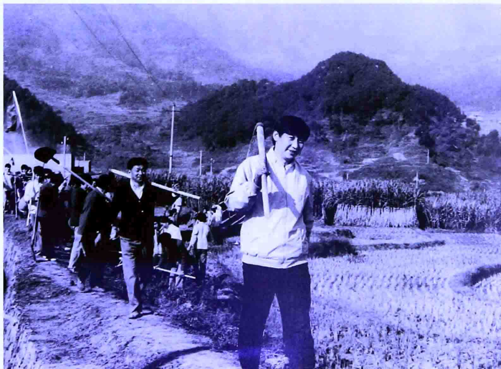
一九八九年，時任福建省寧德地委書記的習近平在農村參加勞動。