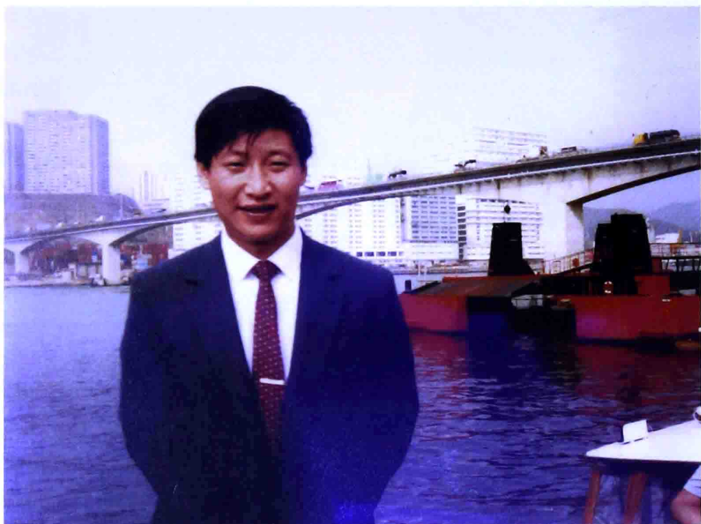
時任福建省廈門市副市長的習近平到國外考察