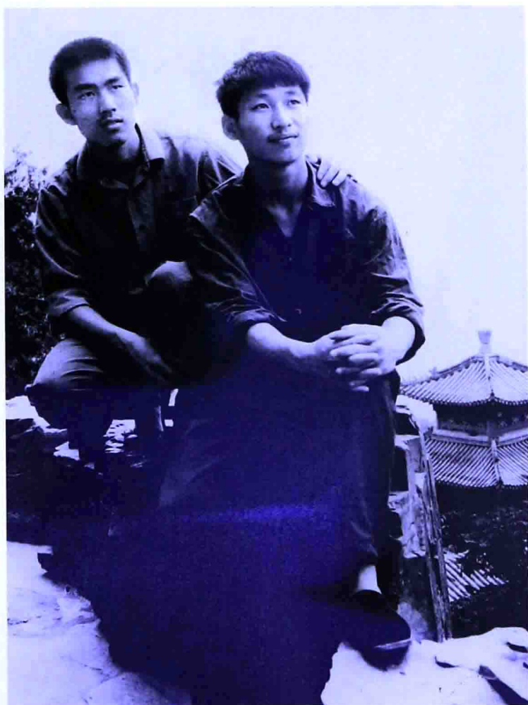
一九七七年，讀大學時的習近平。