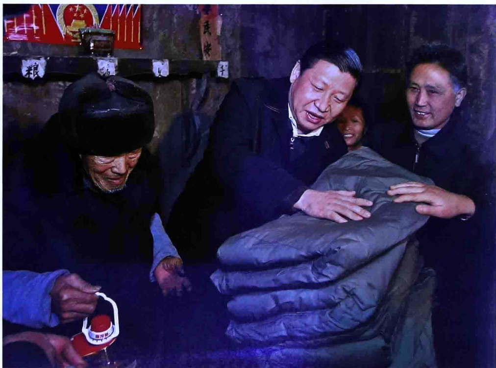
二〇〇八年一月貴州雨雪冰凍災害時，時任中共中央政治局常委、中央書記處書記的習近平到銅仁地區萬山特區高樓坪鄉老山口村受災的侗族村民唐召維家看望慰問。