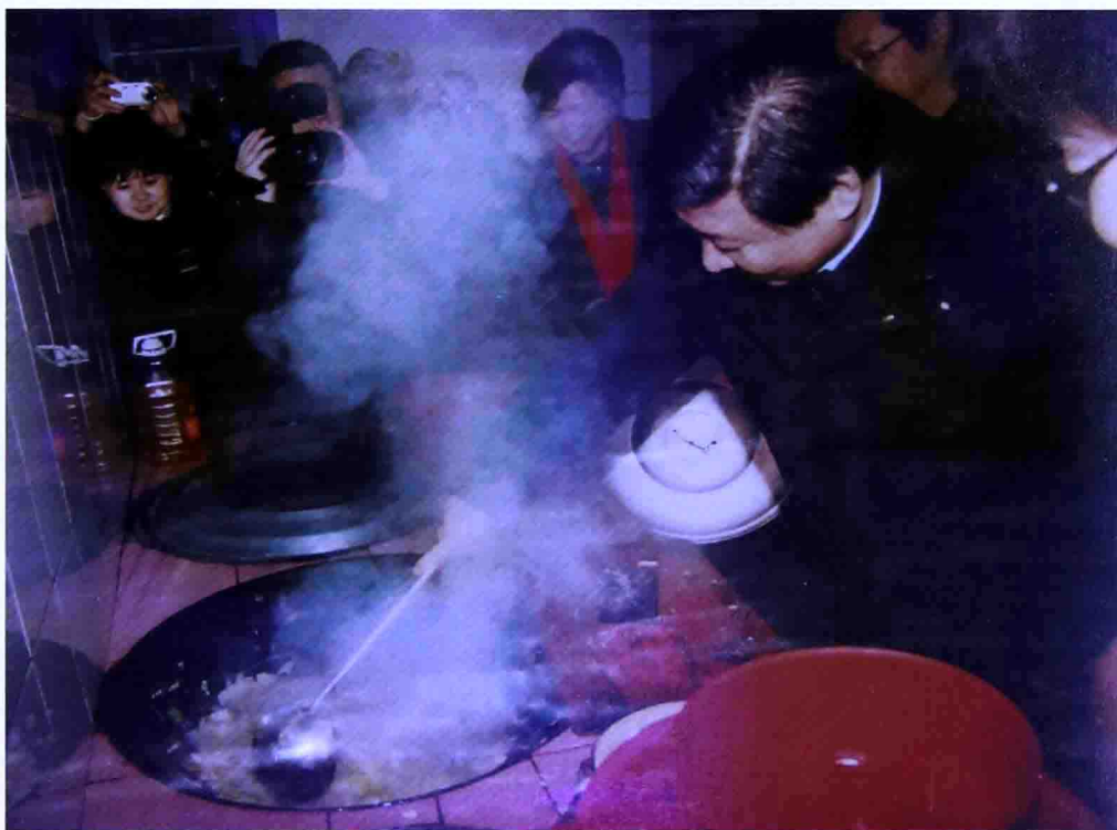
二〇〇七年一月，時任浙江省委書記的習近平在浙江省慶元縣屏都鎮敬老院為老人們炒菜。