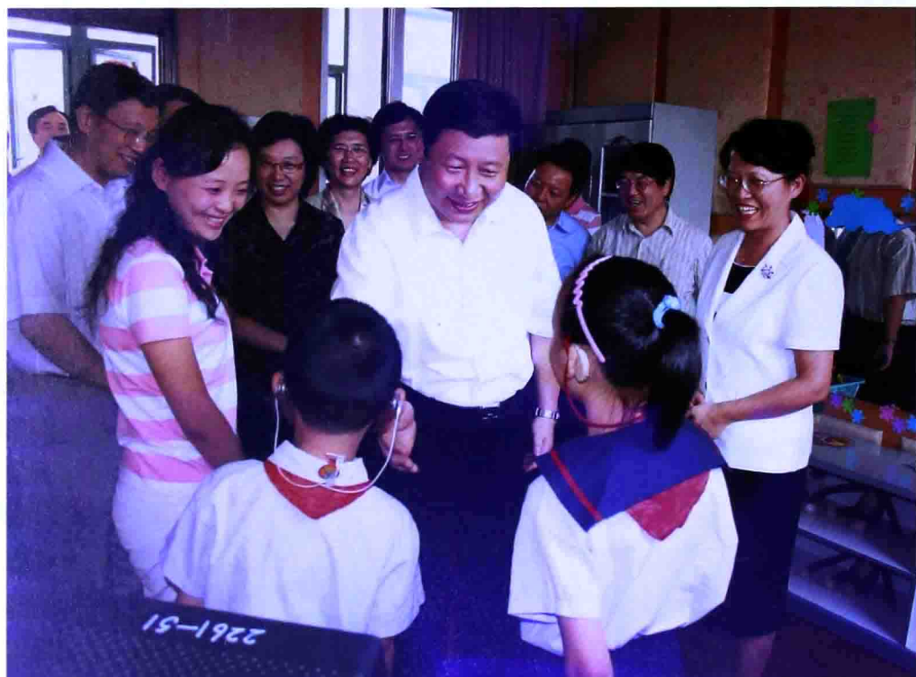
二〇〇七年九月，時任上海市委書記的習近平在上海市閔行區啟音學校與聽障學生親切交談。