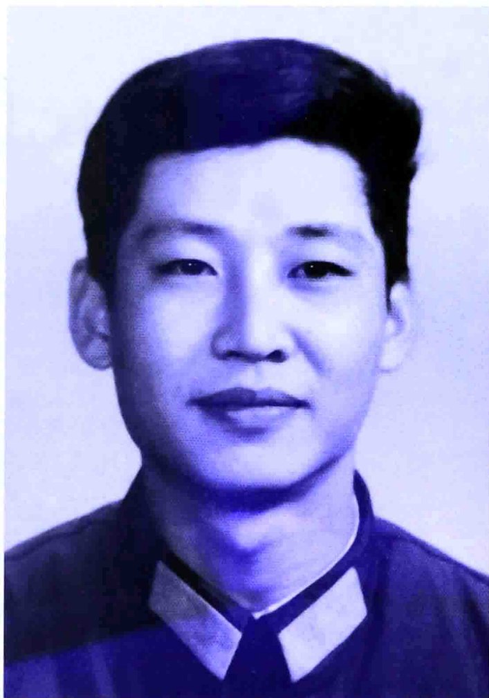
一九七九年，在中央軍委辦公廳工作時的 習近平。