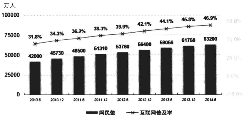
中国网民规模和互联网普及率

来源于2014年7月21日中国互联网络信息中心（CNNIC）发布的第34次《中国互联网络发展状况统计报告》