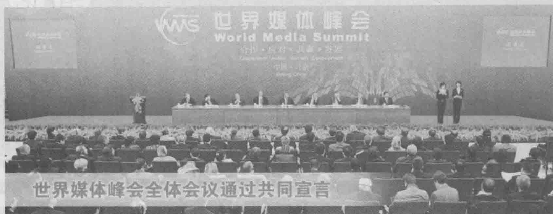
2009年10月9日，世界170多家传媒机构领袖聚会北京，胡锦涛主席到会致辞

现代新闻传播业从发展之初起，就和经济、政治、科技、文化等因素交织得十分紧密，不同时代的差异很大，不同国家和地区的差异也很大，形成了一幅经纬交织、复杂多变的历史画卷。本篇的目的，在于尽可能归纳现代新闻传播活动在不同时代的特征，梳理出世界新闻传播业发展的大致历史轨迹。