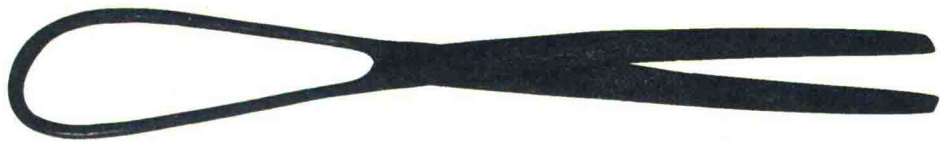
东汉剪刀（中国刀剪刀博物馆藏）

也许由于长时间埋在土里的缘故，这4把剪刀满是锈斑，还有一些泥渣牢牢粘附在上面。拿起来有些沉，由于生锈厉害，已经没有剪刀“剪切”的功能了。乍看之下，还以为是被人扔掉的废铁，很不起眼。据称，它们是目前浙江出土年代最久远的4把剪刀。汉代的剪刀，之前在浙江还没发现过，在全国来说也是少见的。