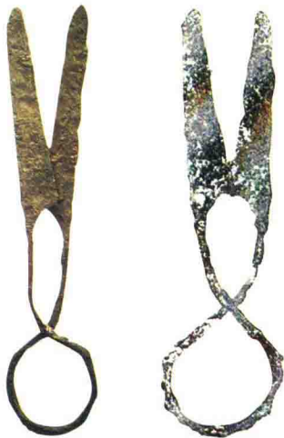
河南巩义汉墓出土的铁剪