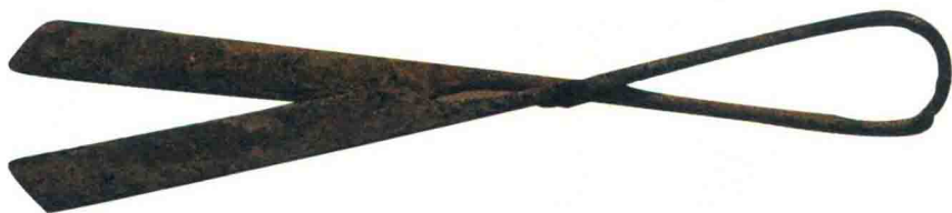
汉代铁剪（中国刀剪剑博物馆藏）

著名文物鉴定家蔡国声在《新民晚报》上撰文称：“该剪刀的造型奇特，结构合理，在当时有很高的使用价值，在今天又难能可贵地提供了西汉时期（至少2000余年）的剪刀的实物，因此有很高的文物价值和历史价值。”