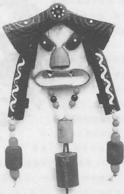
纳西族东巴图腾风铃

弗洛伊德在整理其他学者们对图腾崇拜起源的研究之后，遂利用精神分析学的方法逐渐解开了图腾之谜。他从小孩和强迫性神经症病人与原始民族心态间的相似性提出了图腾是父亲影像替代物的观点。他主要是从原始民族对图腾的矛盾态度和小孩子对父亲的矛盾情感（伊底帕斯情结）间的密切关系，再做更深层的研究。除了在原始民族的图腾崇拜中找出这些线索外，他还在古希腊的神话和悲剧中寻求出许多有研究价值的证据。