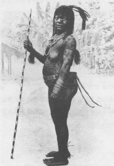
刚果边远地区的妇女，腰带和双辮是图腾装饰。