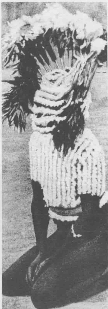
用巫术获取食用球茎的土著。这位土著的羽绒帽像一个球茎，上面像一朵花。这一图腾巫术是想使所有的可食球茎都为本部落开花结果。

和人类灵魂相类似的特性等想法。伴随着泛灵论的产生还出现了两种控制人类、野兽和物质及其灵魂的理论：巫术和魔法。巫术，在本质上是一种以对待人的方式来影响灵魂的做法（使它们息怒、服从命令等），即利用在活人身上被证明为有效的一切手段。魔法，则采取一种与日常生活心理方式不同的特殊方法来影响灵魂，它并不考虑灵魂的存在或其性质。巫术与魔法的特点，我们可以举一个简单的例子来说明：用喧哗和喊叫来驱除灵魂，这种行为我们可称之为巫术。若先知道它的名字，然后以强迫方式来驱除它则魔法已被用上了。在对泛灵论的施术方式（巫术与魔法）作彻底的研究分析后，弗洛伊德发现原始民族在施术的操作过程中，极明显地暴露