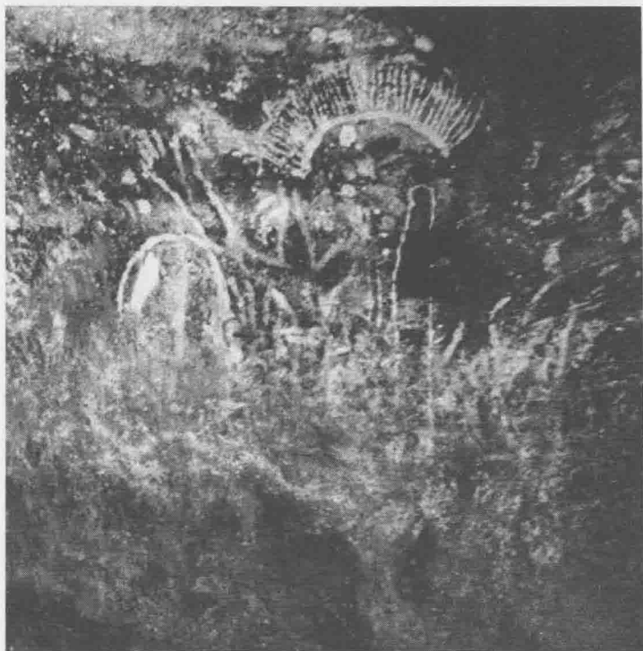
土著人山洞里的图腾

(南洋群岛内的一个岛屿)上,当一队英勇的远征军带着敌人的头颅得胜归来时,他们便举行了一种特别隆重的“息怒”仪式。在这种仪式中,远征军的首领都被加以严厉的禁忌。举行仪式的时候,一般都供奉了牺牲(祭物)来平息被割下了首级的敌人灵魂的愤怒。在某些民族则盛行一种将死去的敌人的灵魂转变为守护神、朋友或恩人的方法。(2)对统治者的禁忌。原始民族对他们的领袖、国王和僧侣所持的态度常常由两种互补而非冲突的观念来加以主宰。一位统治者“不仅要受保护,同时