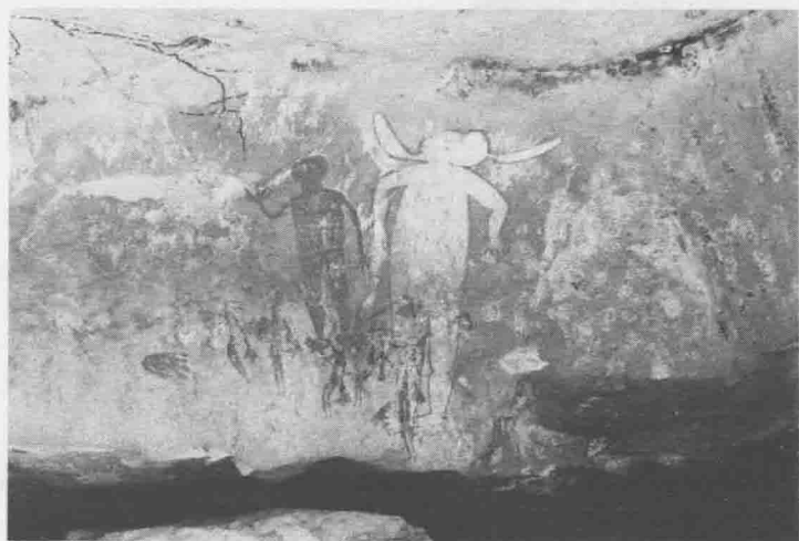
土著人的岩石图腾画

直接的方式附在一个人或物身上因而产生的结果。(2)由玛那以间接的或以传递的方式而产生的结果。(3)前两种方式同时存在。总之，禁忌的来源是由于附着在人或物身上的一种特殊的神秘力量（玛那，原始民族假设宇宙有这种力量存在），它们能够利用无生命的物质作媒介而加以传递。我们可以把被禁忌的人或物比喻成带电体，它们是这种可经由接触传递可怕力量的容纳地方。如果激发这种电能的物体本身太脆弱而无法抵制它们时，则将产生破坏作用。例如，一位国王或僧侣附有玛那，则其本身将因它所具有的神秘性而成为禁忌。于是，当一位平民接触到国王或僧侣的身体时，因玛那的作用将使他受到禁忌的处罚——通常是意指死亡。接着，弗洛伊德提出了原始民族的一些常见禁忌：（1）对敌人的禁忌。在原始民族里，当他们杀死一个敌人时，必须举行一些仪式。例如，在帝汶岛