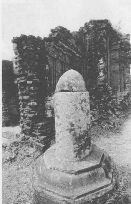
越南美山圣地——占塔遗迹中遗留的阳具图腾石柱

是由心理作用所造成的。最后，他在对孩童心理和强迫性神经症的研究比较后，得到了一个较为具体的结论：泛灵论时期在次序和内涵上与自恋时期相似；宗教时期就像小孩子崇敬他们的父母一样，相似于目标选择阶段；至于科学时期，它正如同一个人达到了成熟的阶段，人们已放弃了纯粹的享乐主义而能就事实对自己作适当