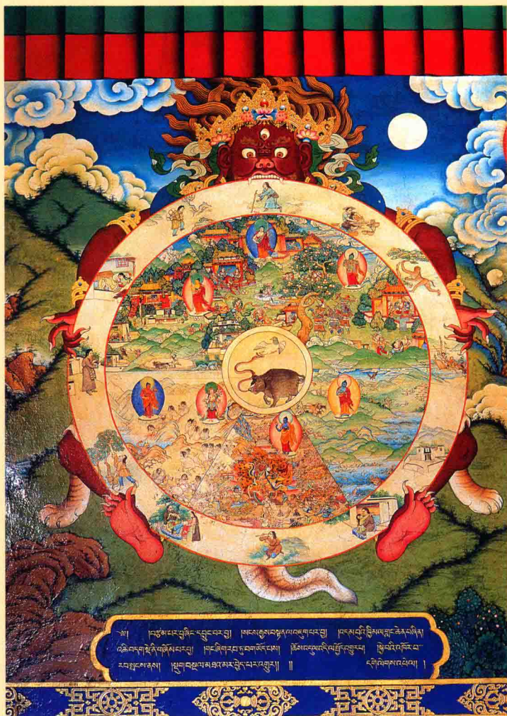
图一五 《生死流转图》壁画

藏族人民也为观音菩萨确立了新的道场，它就是坐落在西藏自治区首府拉萨市中心、古城西北红山上的布达拉宫，是世界上海拔最高的古代宫殿。它始建于公元7世纪时，是吐蕃赞普松赞干布为迎娶文成公主而始建，距今有1300多年的历史。现有建筑群为17世纪中叶五世达赖喇嘛受清朝册封后重新