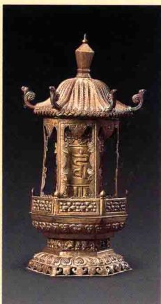
图一七 首都博物馆藏清代银转经筒

场。1961年国务院将布达拉宫颁布为全国第一批重点文物保护单位；20世纪90年代布达拉宫又被列入世界文化遗产名录（图一六）。