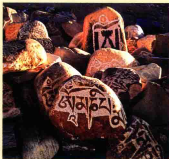
图一八 纳木错湖旁边的玛尼石