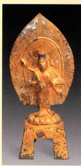
图五 台北故宫博物院藏北魏太和二十二年（498年）铜镀金观音菩萨像

观音道场形成于唐末五代时期，其形成与一位日本僧人有关。据记载，五代后梁贞明二年（916年），日本僧人慧锷来华求法，学成归国前，到五台山请得一尊观音造像，准备带回日本供奉。当他取道宁波，航行至梅岑山新罗礁时，遇狂风大作，巨浪涛天，海面上涌现出许多铁莲花，挡住了他的去路。被困三日三夜后，他跪拜在观音圣像前祷告，祷告之时，铁莲花逐渐消失。他从中感悟到观音不肯去日