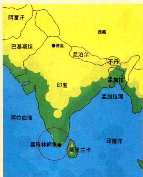
图二 印度观音圣地莫科林岬角所在地位置图