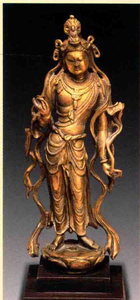
图六 台北故宫博物院藏唐代铜镀金观音菩萨像