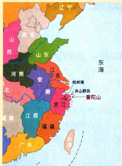
图七 普陀山地理位置图