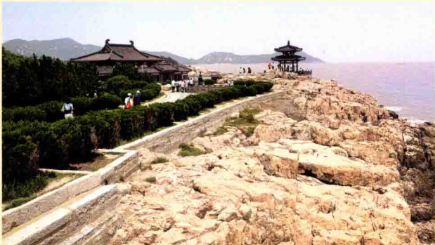
图八 普陀山不肯去观音庙