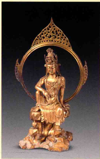
图一三 浙江省博物馆藏五代铜镀金水月观音像

送子观音，来源于《妙法莲花经·观世音普门品》。该经记载说：“若有女人，设欲求男，礼拜供养观世音菩萨，便生福德智慧之男；设欲求女，便生端正有相之女。”由于我国古代社会盛行多子多福思想，所以人们便根据佛经这一记载塑造出送子观音形象。其像始见于唐代，明清时期最为流行。她迎合了世俗社会的需求，是佛教世俗化的重要体现。其形象最明显特征是怀中