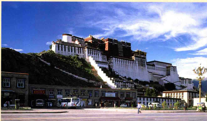
图一六 布达拉宫全景图

兴建，并经过历代达赖喇嘛不断扩建而成。整个宫殿采取木石结构，高117米，面积约12万平方米，包括红宫、白宫、山后的龙王潭和山脚下的“雪”四大部分，共有佛堂、经堂、灵塔殿、习经室等建筑15000余间。其中，红宫和白宫最为突出，红宫为历代达赖喇嘛的灵塔殿和各类佛堂，位于整个建筑的中心和顶点；白宫在红宫外侧，是历代达赖喇嘛的宫殿、大经堂、噶厦政府机构和僧官学校等所在。达赖喇嘛的寝宫位于白宫最高处，又称日光殿。从7世纪起，先后有9位藏王和10位达赖喇嘛在此居住，因为藏族人民尊奉松赞干布和达赖喇嘛为观音菩萨化身，所以他们的驻锡地也就成了观音菩萨在西藏的应化道