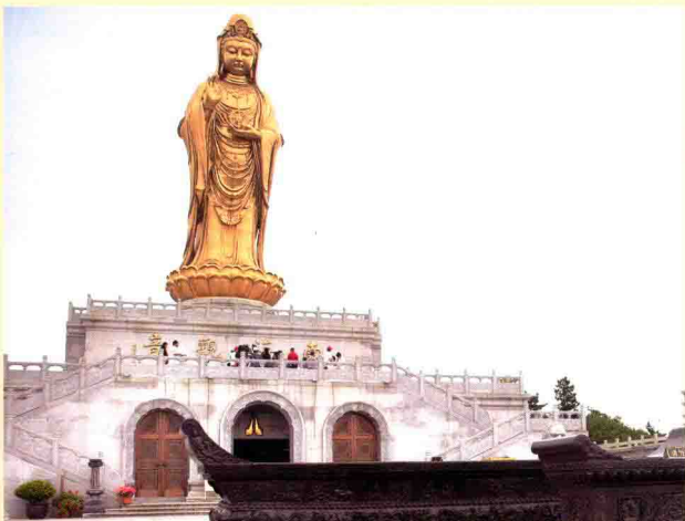
图九 普陀山巨型观音菩萨铜像

本的灵示，于是捧像登陆，在当地一位张姓渔民帮助下，在梅岑山潮音洞前建起一座“不肯去观音庙”，供奉观音圣像，观音道场就此开基（图八）。