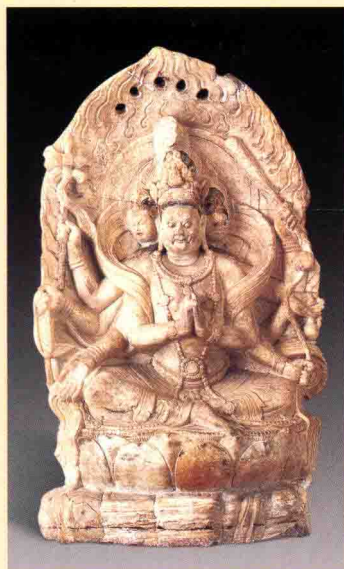
图一一 西安市碑林博物馆藏唐代石雕 马头观音像

华经》记载的“三十二应身观音”，《千光观自在菩萨秘密经》记载的“四十观音”、“二十五观音”、“八观自在”，《阿婆缚抄》记载的“二十八观音”，《诸尊真言义抄》记载的“十五观音”，密宗崇奉的“六观音”和“七观音”，天台宗所奉的“六观音”，以及我国民间信奉的“三十三观音”、“送子观音”等，总计有百余种之多。观音菩萨的这些种类和形象体现了观音大悲济世的愿力和法力，同时也反映了人们对观音寄予的无限希望，反映了我国古人崇高的理想和道德追求。当然在这些观音组合中，有些是相互重叠的，有些是不常见的。因此，下面我们只就一些常见的，并具有独立特性的观音种类进行介绍。