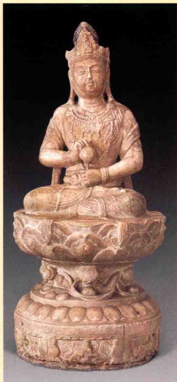
图一〇 西安市碑林博物馆藏唐代石雕 圣观音像