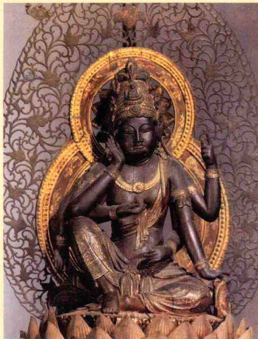
图一二 日本法隆寺藏8世纪木雕如意 轮观音像

马头观音，又称马头金刚、马头明王，是密宗所奉“六观音”之一，主司畜生道众生的救度。有一面二臂、四臂，三面二臂、八臂，三面八臂等诸种形象，其中常见为三面八臂形象。其特点是：三面皆呈忿怒相，头顶安白马头，八臂分别持莲花、宝瓶、数珠、斧、罽索等法器（图一一）。