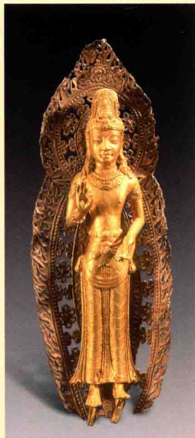
图一四 云南省博物馆藏大理国金阿嵯耶观音像

藏族人民把观音菩萨奉为自己民族的保护神，尊之为“雪域怙主”，藏语称“冈金贡保”，即“藏民族保护神”之意。其根据在藏文史籍中有很多相似的记载，如《西藏王统世系明鉴》记